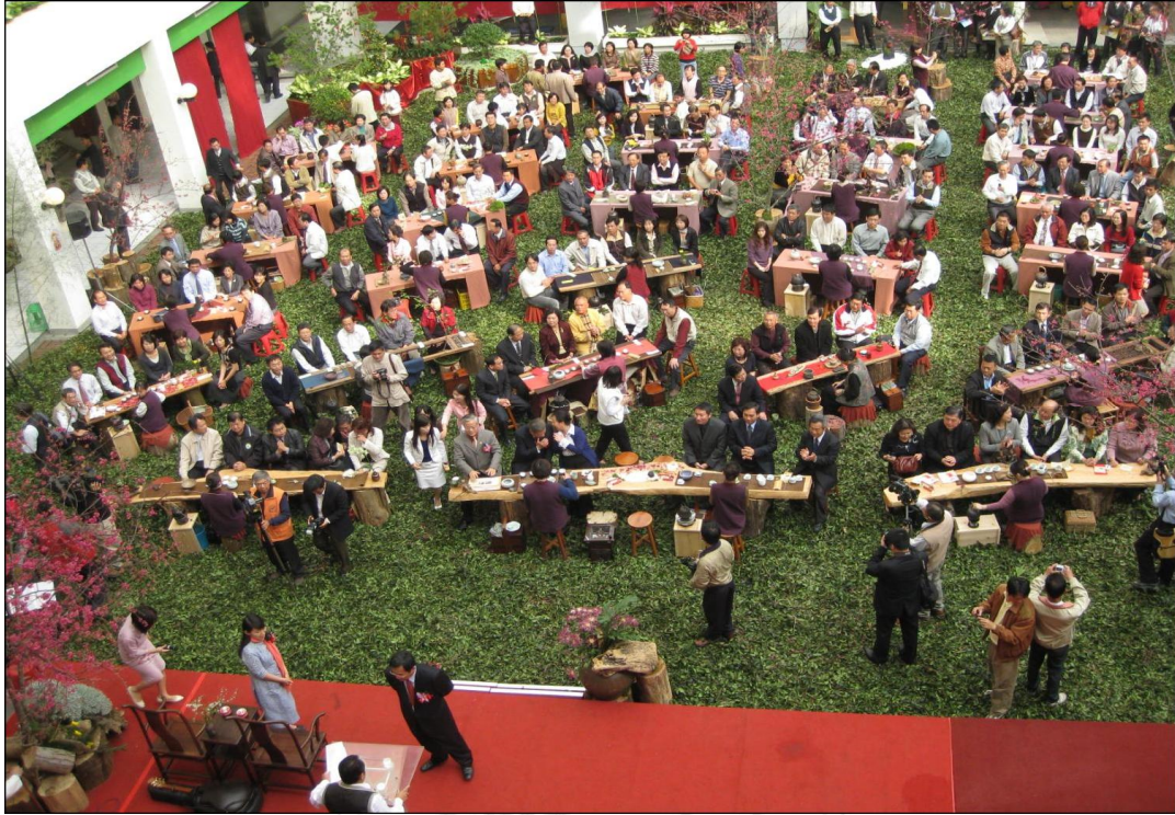
圖 2-2-1:2009 年嘉義縣政府新春團拜茶會

「此次活動最美的地方是社區居民認同社區發展，同心協力，全員動起來…這些努力的過程，真令人感動。」 8