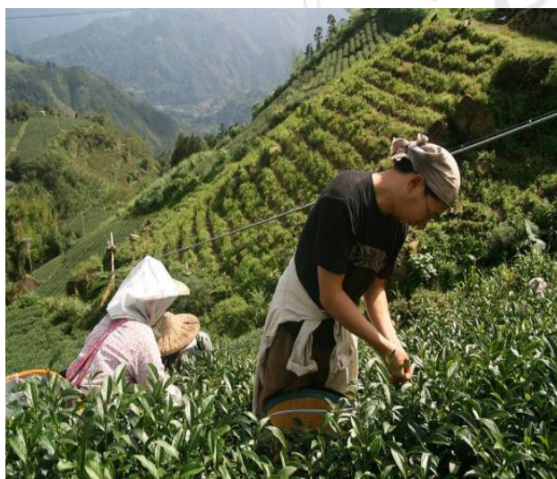
圖 2-1-1: 駐村採茶

駐村團隊為了更貼近茶農生活也親自到茶園採茶，參與茶葉萎凋、曬菁、揉捻…等過程，最後製作完成的茶並命名為「藝術家的茶」。由於這些過程都緊扣著社區的產業，民眾參與意想不到地熱烈，特別是茶具製作陶藝課程更是擾動了社區，許多以前難得參與社區活動的村民竟然開始關心社區，在陶藝茶具製作中，民眾也逐漸多了對茶具的想像，認識原來茶器有更多元的可能，領會到茶器關係著茶湯的呈現。