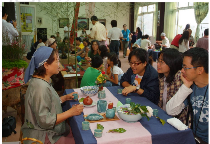
圖 2-1-3: 太和陶風茶會

根據研究者實際參與的經驗，其實茶會成果展只是一個形式，真正參與的民眾，在駐村過程中已明瞭一切，村民努力的參與，內心感受到其中的美好，生活、美感、茶文化，將成為他們生命中的元素，這一切已深植村民心中。正如當時社區理事長郭芳源先生所言：「這是山上有史以來最藝術與美麗的活動。」