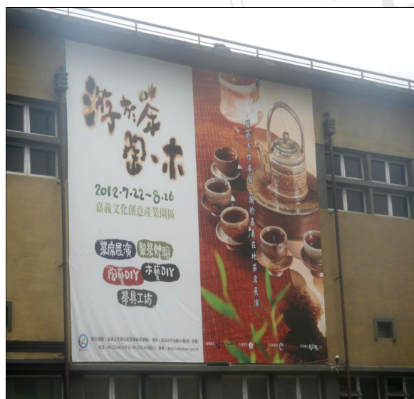
圖 2-5-1: 「游於茶 陶、木」文宣

綜觀上述幾場茶會活動，常會發現茶席上使用的茶具是錯亂，不管茶席的感覺是如何優雅、美好，但精神上卻常是錯置，「宜興壺」的過度使用，彷彿台灣沒有自己的茶具文化。正如同《台灣茶器》一書作者吳德亮先生在序文上所言：「台灣茶人所使用的茶器，卻大多來自中國宜興。每當慕名而來的國際友人，懷抱『朝聖』的心情前往台灣各大茶區，品飲清香獨具的台灣茶品，卻往往為茶商或茶農引以為傲的宜興壺收藏感到錯愕。」 11 為了台灣的茶器文化，為了協調台灣的茶席文化，研究者策展了一場結合台灣陶茶具、嘉義木藝、阿里山茶的嘉義在地茶席展演。