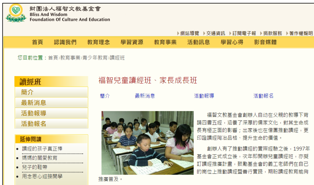
圖 2 財團法文教基金會