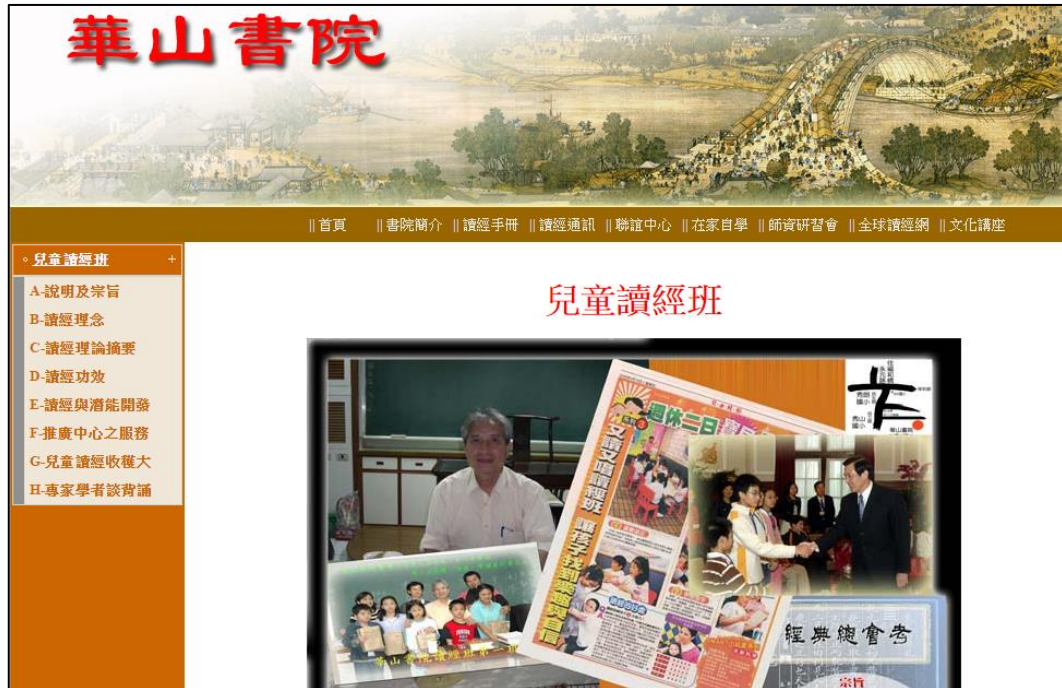
圖 1 華山書院