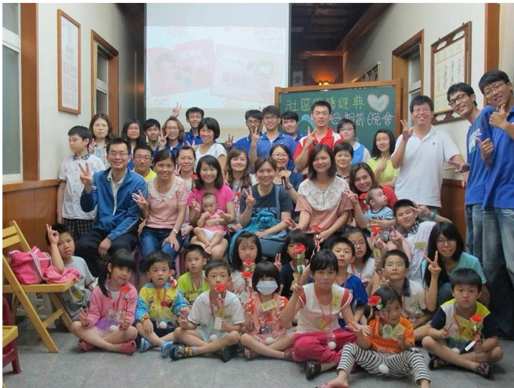
圖 3 讀經班推廣聯誼活動