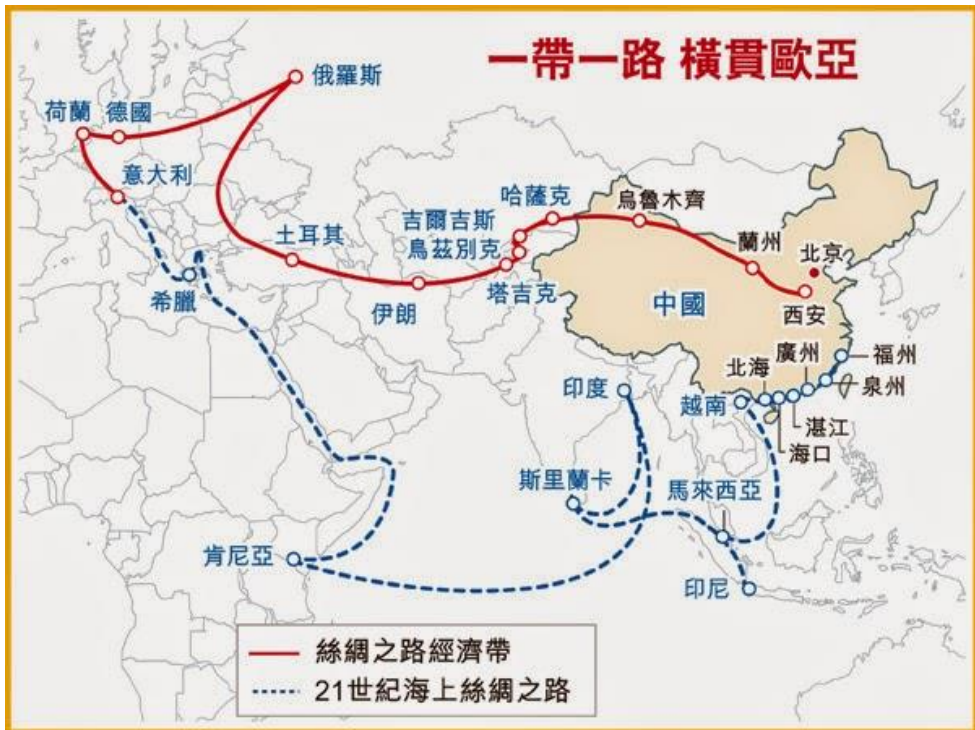
圖一：「社評：一帶一路引領世界進入“亞歐世紀”」，2015 年 4 月 9 日，《中國評論新聞網》。 http://hk.crntt.com/crn-webapp/touch/detail.jsp?coluid=92&kindid=0&docid=103688374

取代的地位。另外，哈薩克是上海合作組織成員國，而且哈薩克跟俄羅斯和中國兩國有很好的關係。2002 年中哈兩國簽署「中國和哈薩克斯坦共和國睦鄰友好合作條約」 5 。自 2011 年起，中國成為哈薩克的最大出口市場和第二大貿易夥伴，所以可以說哈薩克在「絲綢之路經濟帶」具有最重要的地位。