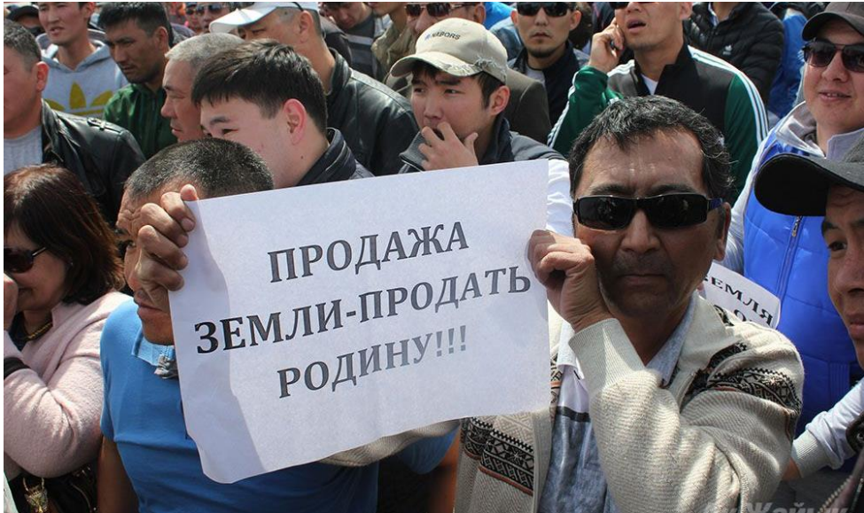
圖二：“Казахстанский Атырау: вместо митинга – на субботник”, Центр-1, 2016 年 9 月 26 日。 https://centre1.com/kazakhstan/kazahstanskij-atyrau-vmesto-mitinga-na-subbotnik/

2016 年 5 月 5 日哈薩克總統努爾蘇丹·納扎爾巴耶夫 Nursultan Nazarbayev 下令暫時凍結修正案，同日總統罷免國民經濟部長、副部長以及農業部長。根據當地媒體報導，總統指出罷免的理由是相關部長們沒有對國民懇切細緻地說明 10 。另一方面，政府對抗議運動採取高壓手段，根據半島電視台 Al Jazeera 報導，後來抗議運動的主要領導人陸續被捕 11 。