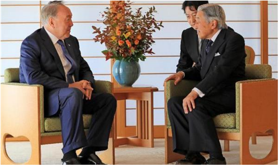
圖四：「天皇陛下、カザフ大統領とご会見」『産経新聞』2016 年 11 月 7 日。 http://www.sankei.com/life/photos/161107/lif1611070040-p1.html

有些學者說，「中國在中亞面對日本的挑戰」 20 。但筆者認為，雖然俄哈兩國向日本親近，但日本企業對哈薩克的投資比較消極 21 。哈日關係目前雖沒有很大的問題，而且納扎爾巴耶夫之前也曾對安倍說哈薩克人和日本人長得很像，兩個領導人的關係也很好 22 ，但哈日經濟關係沒有哈中關係那麼密切，2015 年哈日貿易額僅約 10 億美元 23 ，但哈