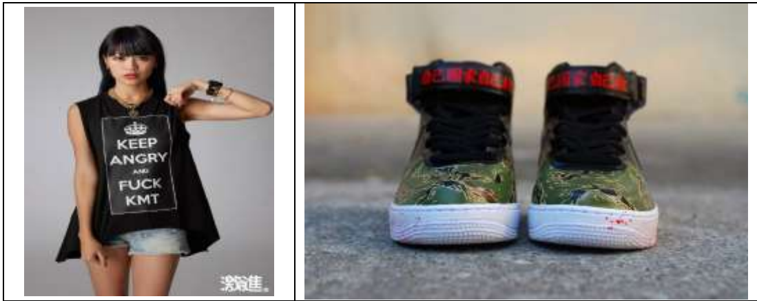
圖 4. 激進設計商品