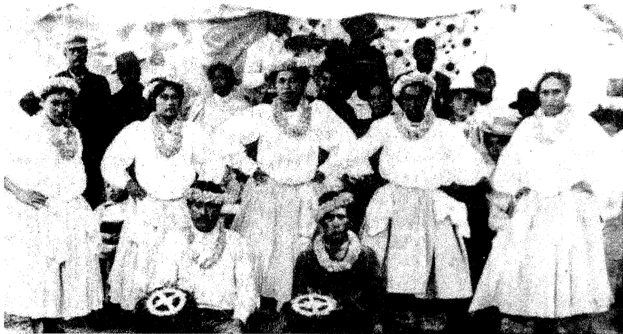
●欣賞呼拉舞表演的白人。