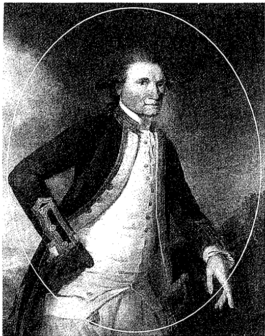
●庫克船長 (Captain James Cook) 的肖像畫。

面的觀測及太平洋區域的丈量等科學工作外，也「發現」了許多太平洋島嶼以及當地的原住民。庫克最早發現夏威夷是在第三次航海途中的一七七九年，庫克「登陸」夏威夷的同時，也是夏威夷被「登錄」的開始，換言之，夏威夷已成為大英帝國版圖的一部分。依據他《正式航海記錄》中的描述，他所看到的土人對英人都十分友善，這是因為登陸之時正逢夏威夷舉行新年祭典馬卡希基 (Makahiki)，土人以爲庫克一行是豐收神祇羅諾 (Lono) 的化身而加以款待。庫克對夏威夷土人的友好意象，成爲歐洲人對「太平洋樂園」意象的原型之一。然而，所謂友好其實是