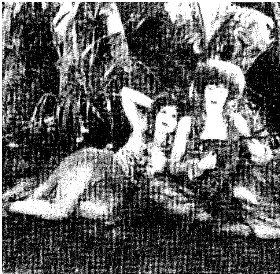
●好萊塢拍攝的夏威夷電影。