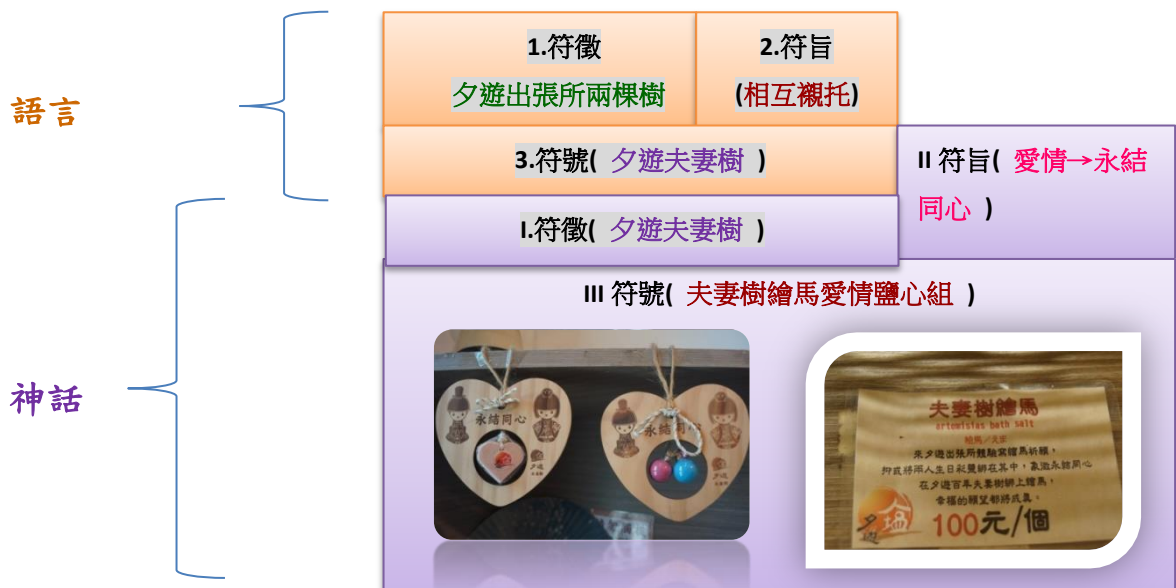
表十四、羅蘭巴特的語言與神話系統交錯關係

以羅蘭巴特的「語言與神話系統交錯關係」為擴充系統，以臺灣夫妻樹的文創品牌「夕遊夫妻樹」為例，擴充推演「品牌符號化」的過程：