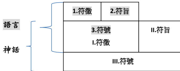
表二、語言與神話系統交錯關係

說明：這一套擴充系統是可以無限延伸的。「1.符號。2.符旨。3.符號。」是第一套系統。將這一套的「3.符號」與「I.符徵」劃上等號，然後再進入另一套擴充系統「I.符號。II.符旨。III.符號。」，如此，漸次並無限擴充。在標點符號來說，這種語言與神話的交錯關係是一種刪節號(……)。