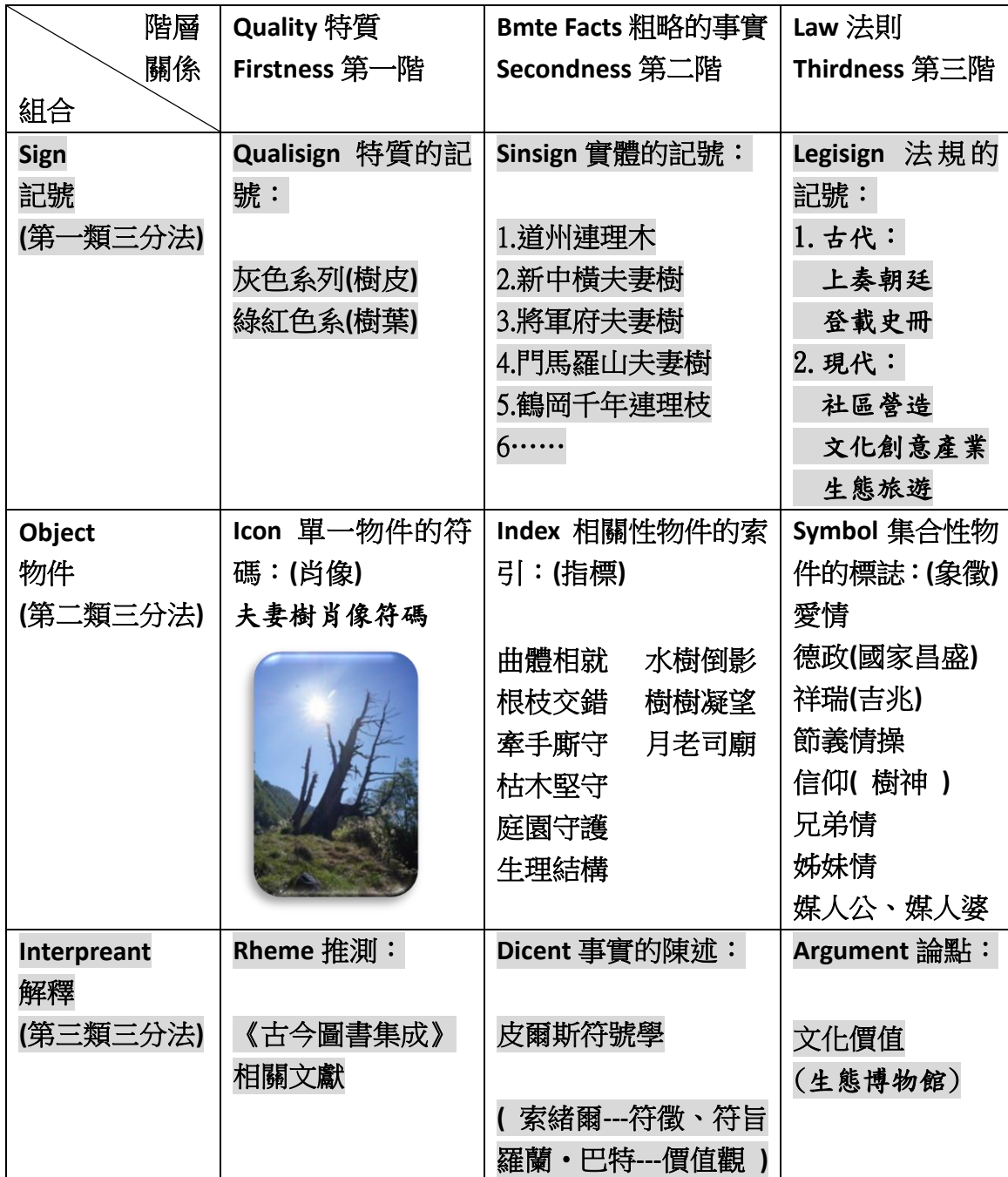
表九、研究計畫之「皮爾斯符號學的階層和組合關係表(九宮格)」 25

「文化」一詞，緣起於拉丁文( culture )的字義，指對於動物與植物的培育，從自然的生產活動中累積出來 26 。何謂「文化」？各方說法五花八門，由於本文論述內容牽扯到「符號與夫妻樹」，筆者傾向採用以下說法：英國歷史學家湯恩