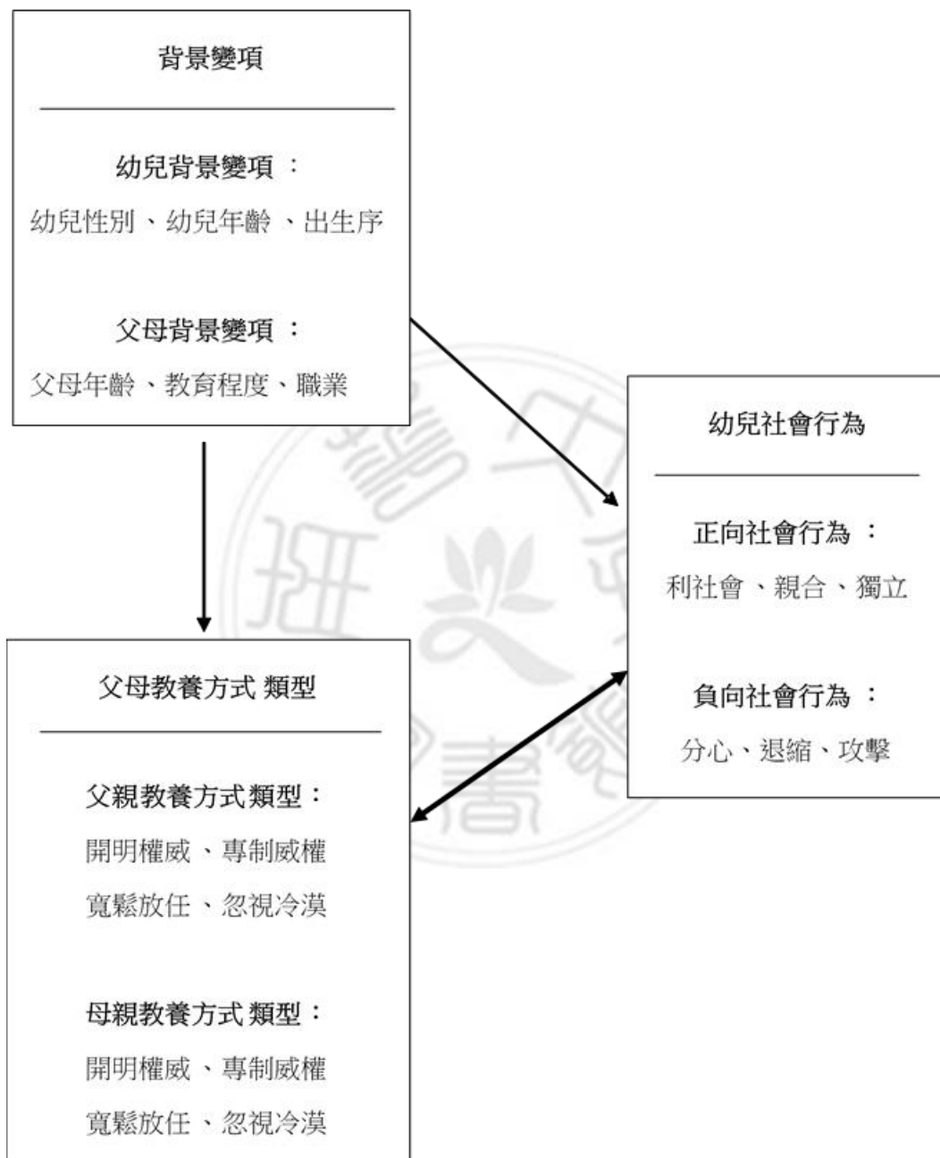
圖 3-1 研究架構圖