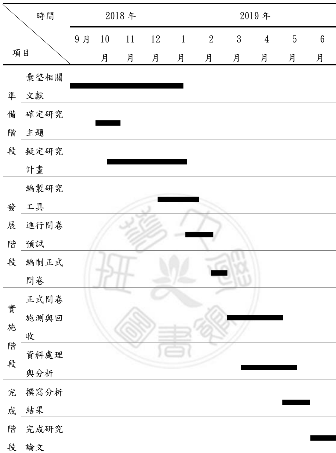
圖 3-3 論文撰寫進度甘特圖