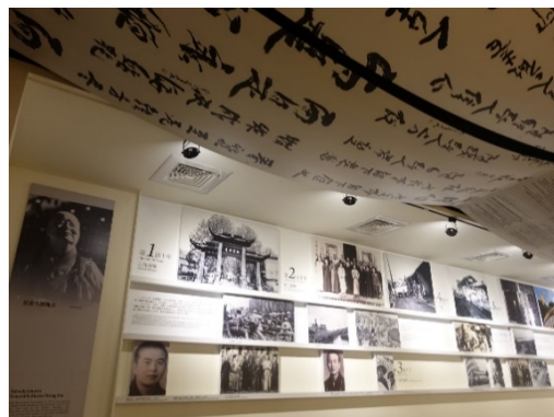
圖 2：展區入口-星雲大師簡介