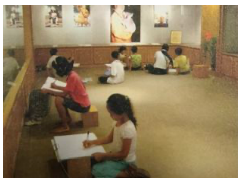
圖 19：兒童臨摹照片一景 157 ↑ 最贏得小朋友熱烈作畫的一區。