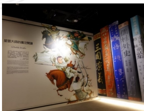
圖 8：善用轉彎空間所設計巨型書架

展場利用空間上的轉角，作為每一個小主題的轉場，此段走道一樣利用狹長的走廊設計，一側牆面展版演示帶入時空的介紹，從渡海來台到歷經在青草湖的時期寫作，至宜蘭雷音寺的弘法階段。