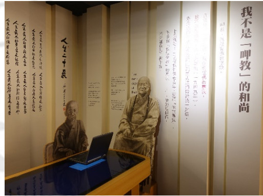
圖 13：以口述的方式持續著作

持續不斷的文化事業，即便到了晚年眼盲手抖，也仍要以口述的方式持續筆耕 139 ，更有整面的墨水瓶排列起的牆，因為一筆字而成立的基金會，是在背後默默推動這百年大計的文化事業，綜合以上才建立了現在所看到的佛光山體系，於是乎這艘弘法的大船已呈現在世人面前。