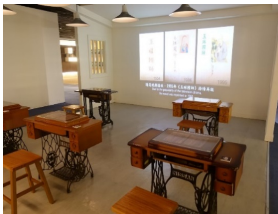
圖 10：重現以裁縫車作為書寫桌的樣貌

星雲大師相信佛教之所以流傳千古，是因為有文字的力量，作為弘法的資糧，文字生生不息，人不在，文字般若還在。所以他所主張弘法與寫作的理念為，要有文學的外衣，哲學的內涵，因為文學要美，哲學尤其要有理，內外相應，無論是長文是短文，必然是好文章。