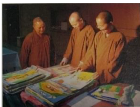
圖 20：評審專注審查畫作 158 ↑ 評審專注的神情。