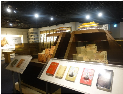
圖 12：以模型展示文化事業建構起的佛光山

星雲大師說：「雖然年年為了龐大的維護開銷入不敷出，但是從大眾讚許的聲音及眼神，我肯定了多年來的信念。這不僅具有弘法度眾之功，亦同時兼有保存佛教文物之效，而這也是我一再努力，希望做到『佛教與藝文結合』的目標。」 138 這一階段的展覽廳，將各個階段的發行刊物或是著作，按照時序排出並佐已介紹，從《覺世旬刊》到《人間福報》，從《普門雜誌》到《普門學報》，從《佛光大辭典》的編撰到《佛光大藏經》的發行，《釋迦摩尼佛傳》、《普門品講話》等。在展區中央為佛光山主要建築大雄寶殿的模型，模型的基礎是為數眾多的各種出版書籍的堆疊，以立體的手法展現出弘法的根基是建立在文化事業的基礎上的。