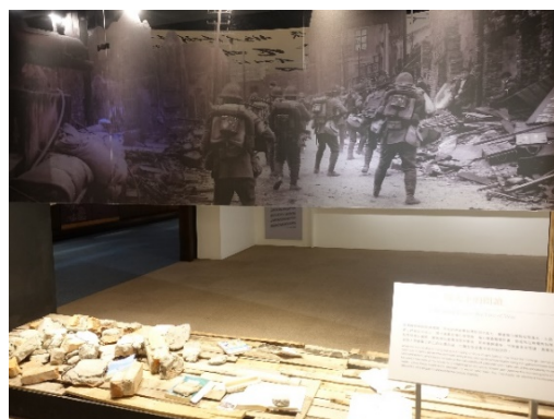
圖 4：重現動亂的時代意象與書籍磚瓦 散落一地

《百年佛緣》、《貧僧有話要說》為晚年因為視力模糊，以口述方式出版，2015年又以「趙無任」之名，出版《慈悲思路·兩岸出路》一書，著作內容關心時事緊抓住社會的趨勢，與時俱進。