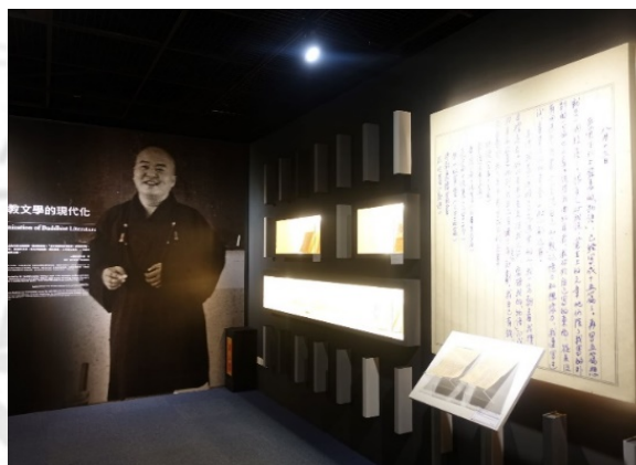
圖 11：草稿中的寫作規劃，已如期一一完成、出版

星雲大師所有的著作並非隨意的生活手札，而是有完整規劃性的寫作過程。首先定出書名，提列各個章節綱目後，起草撰寫內容。從筆記當中可以看到在某年八月十三日，除了敘述當年在《覺生》雜誌發表文章的心得外，還提及三年內必須完成的內容。如今，這些文章已裝訂成冊如期出版，一步一步地完成自己的目標理念 137 。到了台灣，懷著滿腔弘法熱誠，如何逐步的以文字化為弘法的力量，策展者試著帶領觀眾從弘法者各種微細的角度去解析雲大師弘法的思想脈絡，可以從展示出