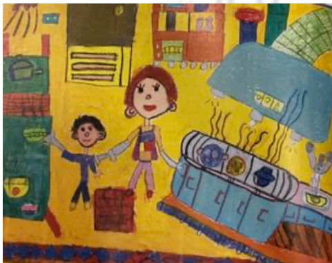
圖 18：幫媽媽做家事－楊佳龍 156