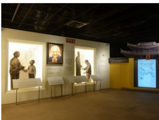
圖 6：與老奶奶的互動、志開上人教導寫字、焦山定慧寺的牌樓

在經過介紹星雲大師生平的歷史走廊，在轉彎處利用戰爭動亂的意象，帶領觀眾進入因戰火而不易接受教育的情境，利用碎裂的磚頭、石塊以及殘破的木板，重現星雲大師所敘述的，在棲霞律學院就讀期間，附近的師範學院遷址，圖書館的書散落一地，於是將地上的書撿起，當起小圖書室的館員，藉此機會閱覽全書，也藉機觀察學長們多借閱那些書籍，從這點可以看出惜福的性格，珍惜文字資源，注意細節的個性，不放過一點求知的機會。