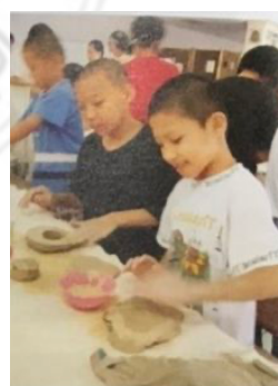
圖 24：兒童教室一景 161