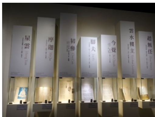
圖 3：星雲大師的筆名與著作 ↑各時期的筆名與相對應的著作書籍。

報·藝文》的創刊；從《佛光大辭典》的編撰到《佛光大藏經》的發行，撰寫出版《玉琳國師》、《釋迦牟尼佛傳》、《無聲息的歌唱》、《佛教叢書》、《往事百語》、《迷悟之間》等書刊，並翻譯二十餘種各國語言流通世界各地。