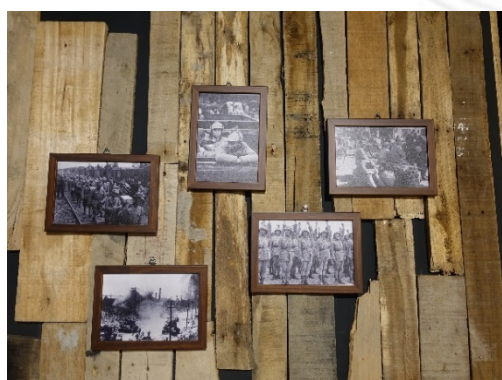
圖 5：轉角的牆面以木板殘片搭配 黑白的戰爭歷史照片裝飾

星雲大師在《百年佛緣》書中提到「我從一個二十歲不到、為佛教改革與前途振臂疾呼的僧青年，到台灣駐錫弘講、建寺安僧，靠著一枝禿筆生存立足，乃至後來創辦佛教的文教事業，將佛陀教法透過文字與出版品流傳到世界各個角落。我這