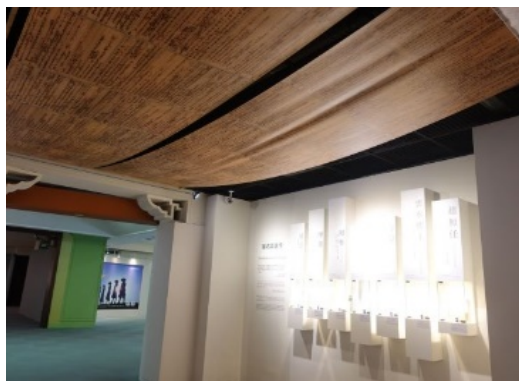
圖 1：星雲大師的筆名與著作

踏入展區可以看到以星雲大師的生平為開場，講述一個貧苦的務農家庭出生，歷經土匪、北伐、中日戰爭與國共內戰等戰亂環境中成長的歷程，從十二歲出家，曾在大陸金山寺、焦山寺、棲霞寺、天寧寺等叢林參學的經過。