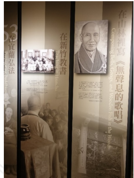
圖 9：渡海來台的各時期介

另一側則接續學習的成長歷程，述說對閱讀的愛好，星雲大師說過「之所以啟蒙我喜歡文學，還是由於佛教的經書比較深奧，讀起來不甚了解，而民間的文學小說不但看得懂，並且趣味橫生，所以我就這樣深深地愛上了文學」 134 。展廳中設計了巨型的書籍，可以看到並非是佛教典籍，而是傳統民間故事，戲劇性的表現書架上的書在觀賞者的眼中，會一眼捉住目光的立體效果。星雲大師自己是這麼形容於文學結下因緣的：「我這一生，除了與佛教的關係特別的殊勝，其它的學術文化，就要算我與文學的因緣最為深厚。因為我一生沒有進過學校，也沒有受過老師特殊的訓練，除了寺院的教育，讓我獲得佛學的一些知識以外，應該就是我個人喜愛閱讀文學的著作了。」 135