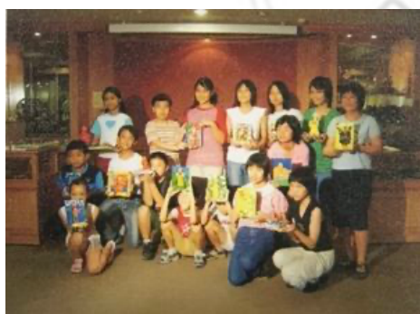
圖 23：採訪一景 160