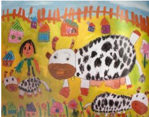
圖 17：乳牛－許馨云 155