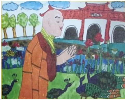
圖 16：星雲大師－李培綸 154