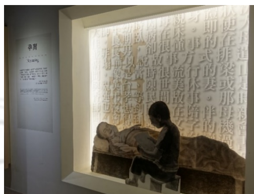
圖 7：半立體的場景重現兒時情境

利用半立體的定格畫面，以情境復原的方式，演示幼時與老奶奶的相處經歷，以及在出家前都沒有真的習過字，與志開上人的一段話，堅定了日後要努力向學的起點，一段段的故事，漸漸堆疊出星雲大師的性格，其說故事的方式，使得觀賞者容易投入情境。