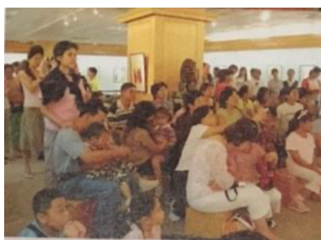
圖 21、圖 22：頒獎一景 159