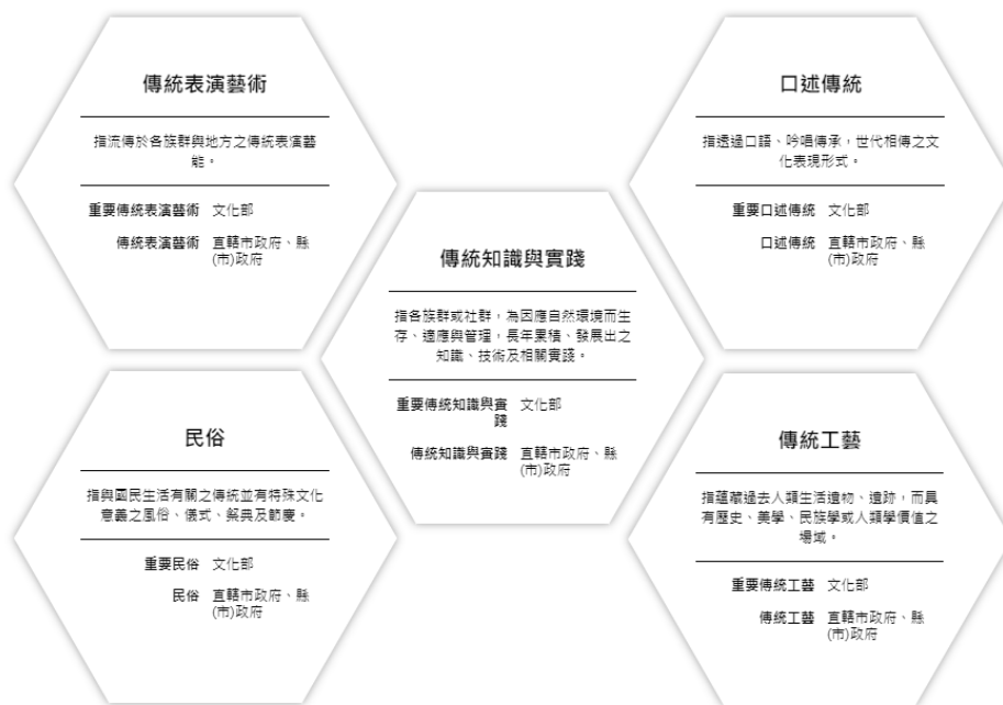
圖 2-2 無形文化資產