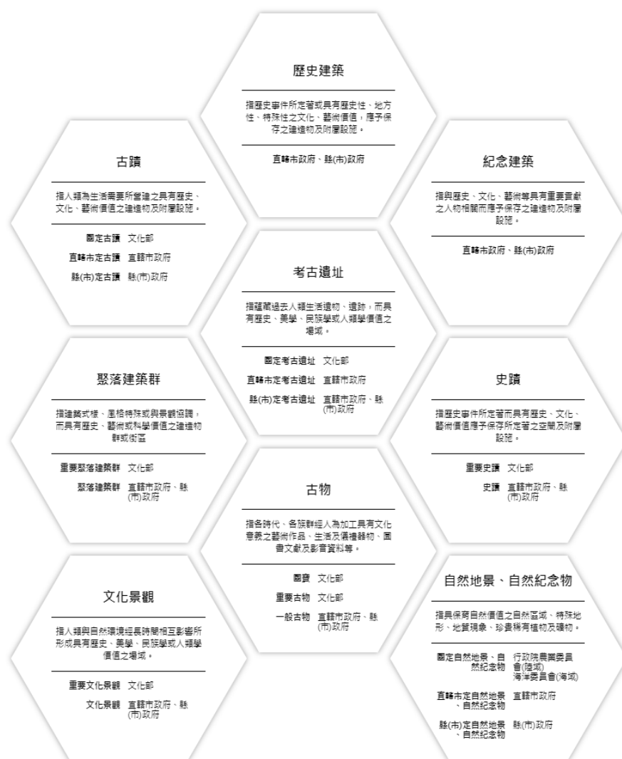
圖 2-1 有形文化資產