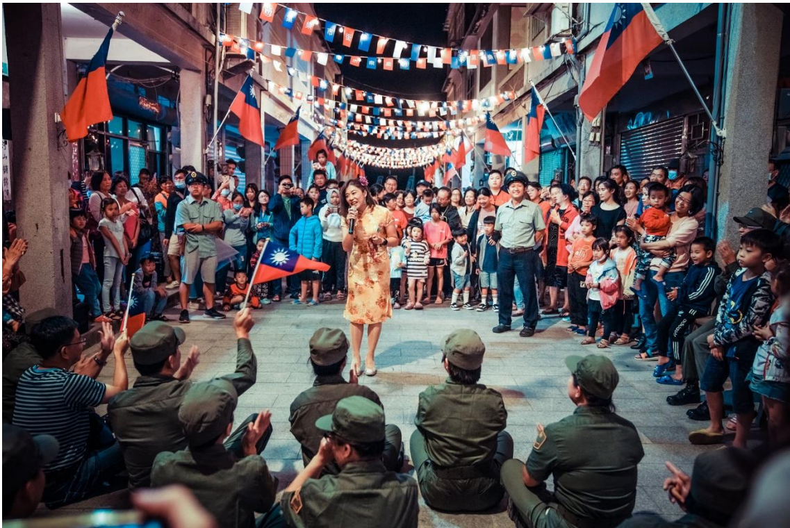
圖 1-2 戰地一條街活動

用戰地資源，透過老兵故事劇場「烽火歲月」的演出，將西方街打成為具有戰地特色街區。