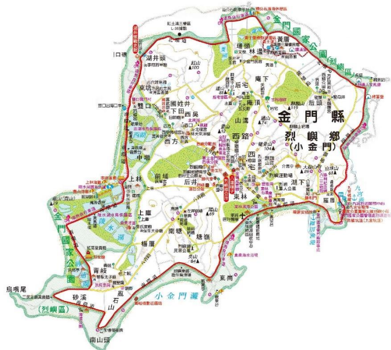
圖 1-3 西方老街位置圖