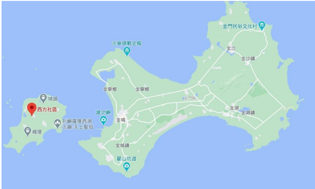
圖 1-1 西方社區位置圖

烈嶼鄉轄內西口村轄下計有 7 個自然村，分別為湖井頭、東坑、雙口、下田、西吳、西方及后宅，西方社區於烈嶼鄉中間偏西之位置，村內產業以農業為主，人口外移及老化明顯。