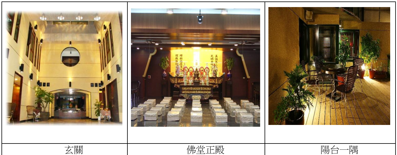
圖 6 世華廣場 23 樓整修後

至於如何應付道場固定開銷增加問題？一則恪遵妙極大帝四訓 43 中的「勤儉克己復禮」，將錢財花在刀口上；再者踐行《大學》：「是故君子先慎乎德：有德此有人，有人此有土，有土此有財，有財此有用。」 44 培養光明德行，親民真誠、關心付出，日久自然感召志同道合者齊心護持，出錢出力；有了民心，自能保有土地生產財物，再將之用於道場、大眾，形成善性循環。