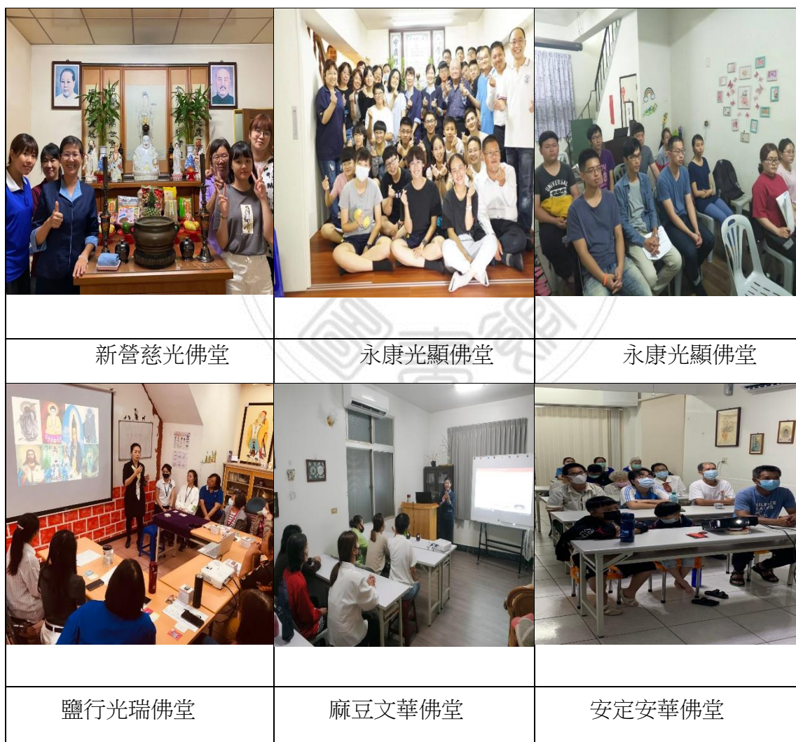
圖 7 臺南各公共佛堂

大的責任，包括資源統籌、開課規劃等事宜，此模式優勢在於資源可做最好的整合，例如李玉麟老師所合作的機構就和當地小學和中學有合作，不需擔心生員的問題。在國內佈點方向，由於臺南地區公堂相繼成立，在各佛堂積極開課、辦道渡人的努力下，目前世華廣場二十三樓場地已有不敷使用之感，每逢懺悔班或是臻美班，各地班員回到光輝上課，佛堂即呈現擁擠狀態，因此未來規劃以尋覓更大的佛堂用地為要，又因市區地價高昂，故目標均考慮位於郊區的物件，例如：玉井、左鎮、新化、善化、土城等地皆曾經列入考量；如此，總堂遠離市區，又顯示出各個城鎮中公堂的重要性，因此同步進行中的是臺南各地公堂的積極安設。