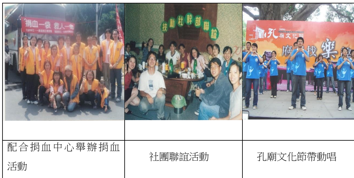
圖 3 年輕人的社團-「扶勵社」活動