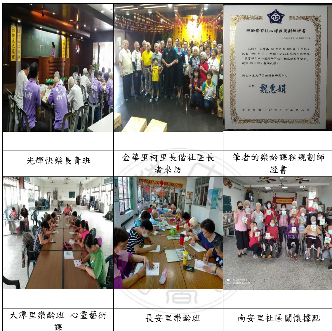
圖 11 樂齡長青班

靈藝術帶入樂齡學習場域、社區關懷據點，使課程更加多元、專業，讓長者再創生命價值。