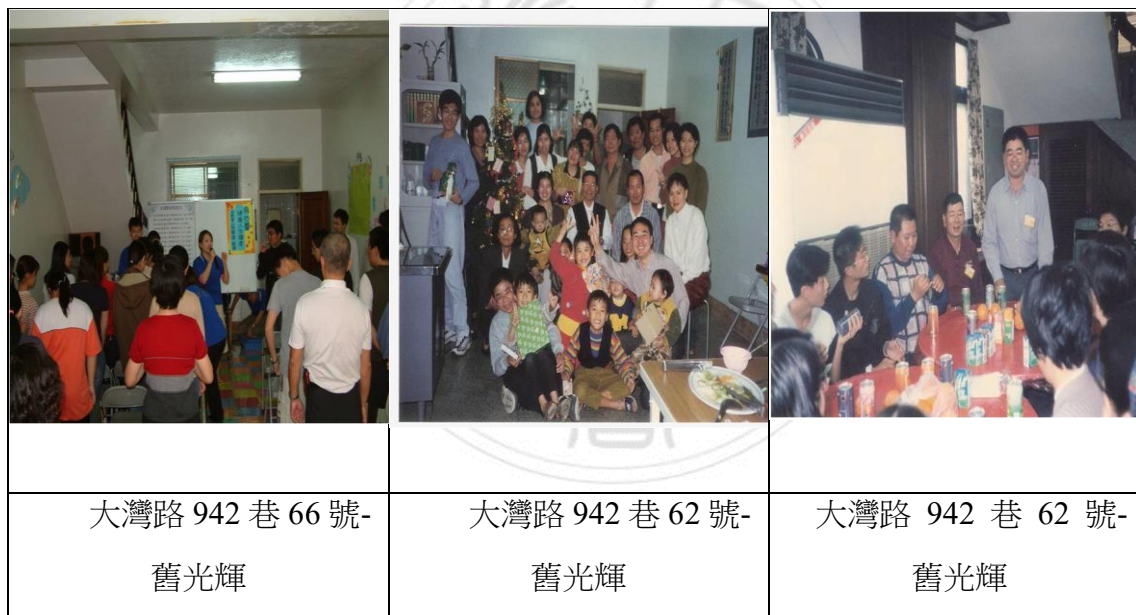
圖 2 舊光輝

兩年後道務更加鴻展，空間又不敷使用，於是又積極四方尋找適合的地點，正應驗了「人有善願，天必從之。」這句話，此時之前 66 號屋主兒子又搬回北部了，因此就同時租了兩棟，當時已發展光輝「扶勵社」 37 社團，有多位外縣市考上臺南各院校的學生住宿光輝，並已成全當地一些學生成員幹部，故乾道學生在 66 號，坤道學生在 62 號分開居住。