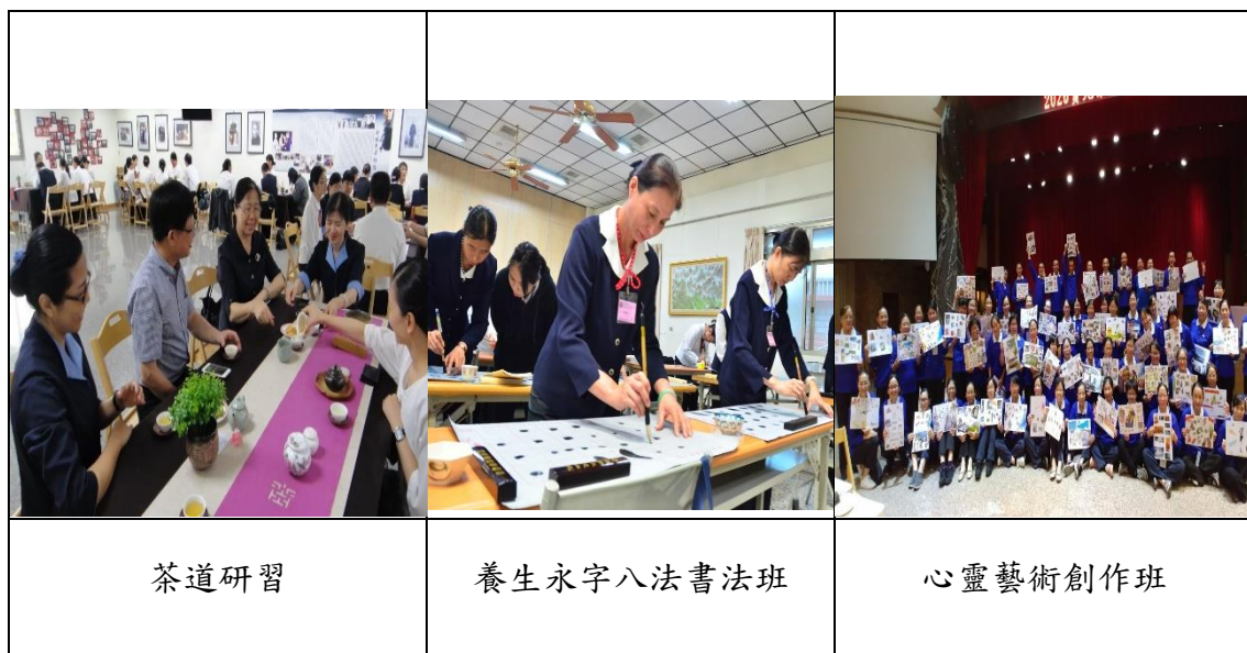
圖 12 多元德藝教學