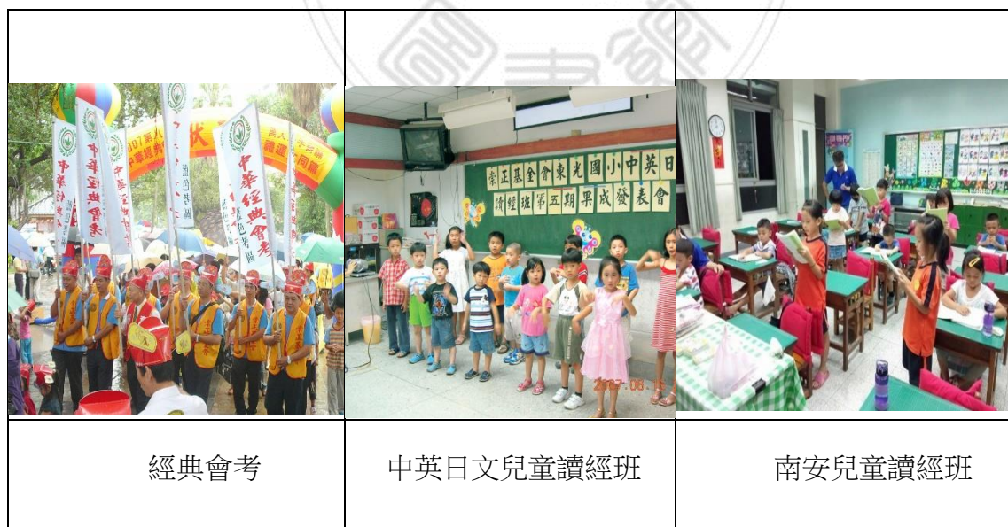
圖 8 經典會考及兒童讀經班

感恩王老師與朱老師的積極帶動，使後學在修辦道的過程中成長不少，讀經班的帶領、每晚的家訪成全，甚至後學到祖國開荒，之前的經驗奠定了現在帶班與面對事情處理的方式，內聖外王的功夫越來越精進了。 72