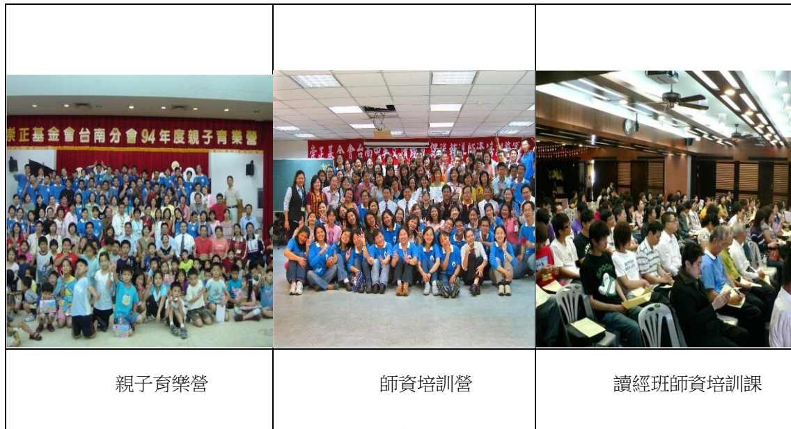
圖 9 親子育樂營及讀經班師資培訓