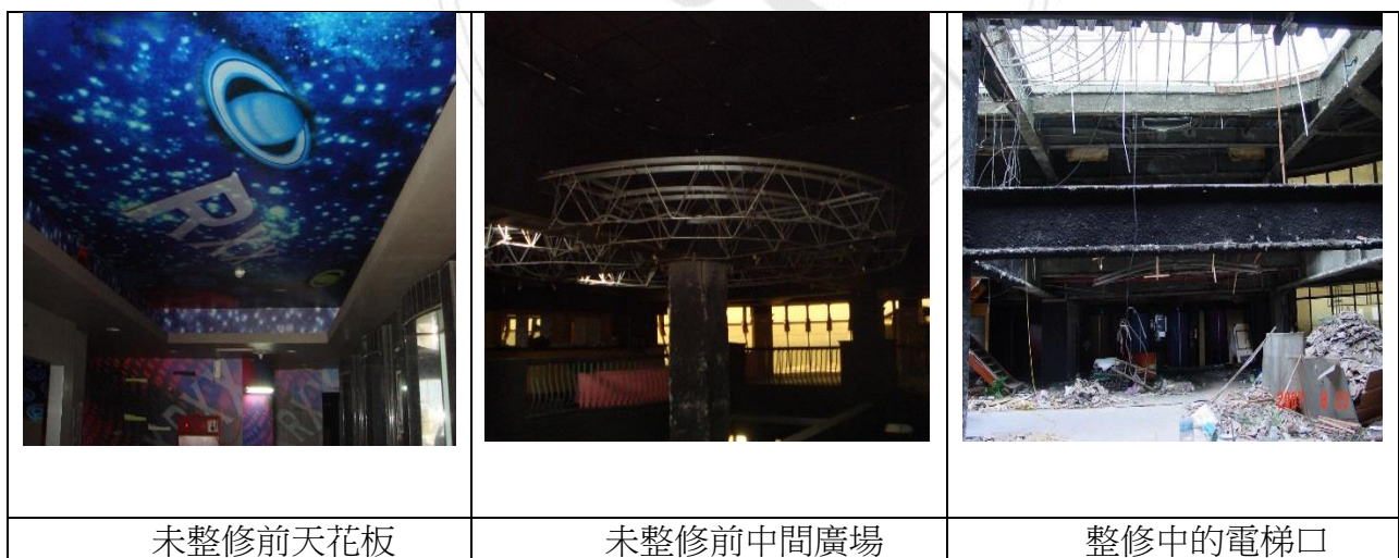
圖 5 世華廣場 23 樓整修前