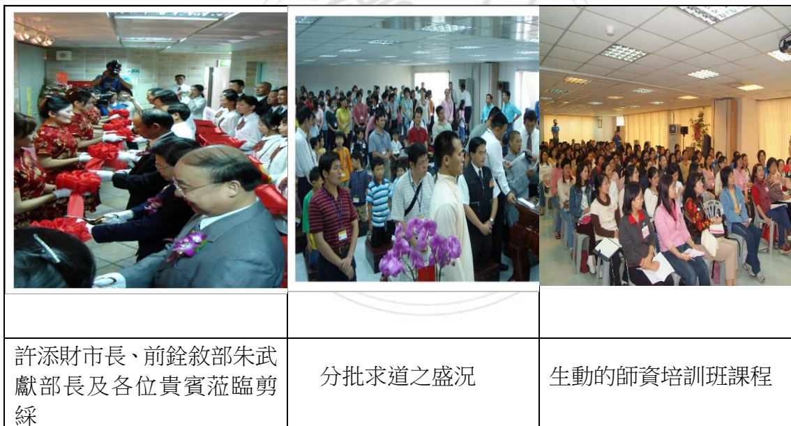
圖 4 光輝道場在「世華廣場」七樓時期

硬體空間受限的問題解決了，緊接著開始著手規劃中英文師資培訓班，招生對象除了道親，主要還有讀經班的家長們。課程設計每一梯次有六天，連續三個星期六、日完成，內容有三大主軸：志願服務的精神及意義、讀經理念和重要性、以及實務的教學技巧演練，每一梯次都有一、兩百位學員參加，受訓完成後即自發的安排到就近的讀經班服務。於此，人力不足的問題亦獲得解紓。