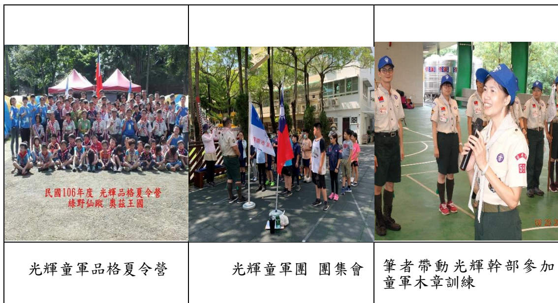
圖 10 童軍訓練及活動