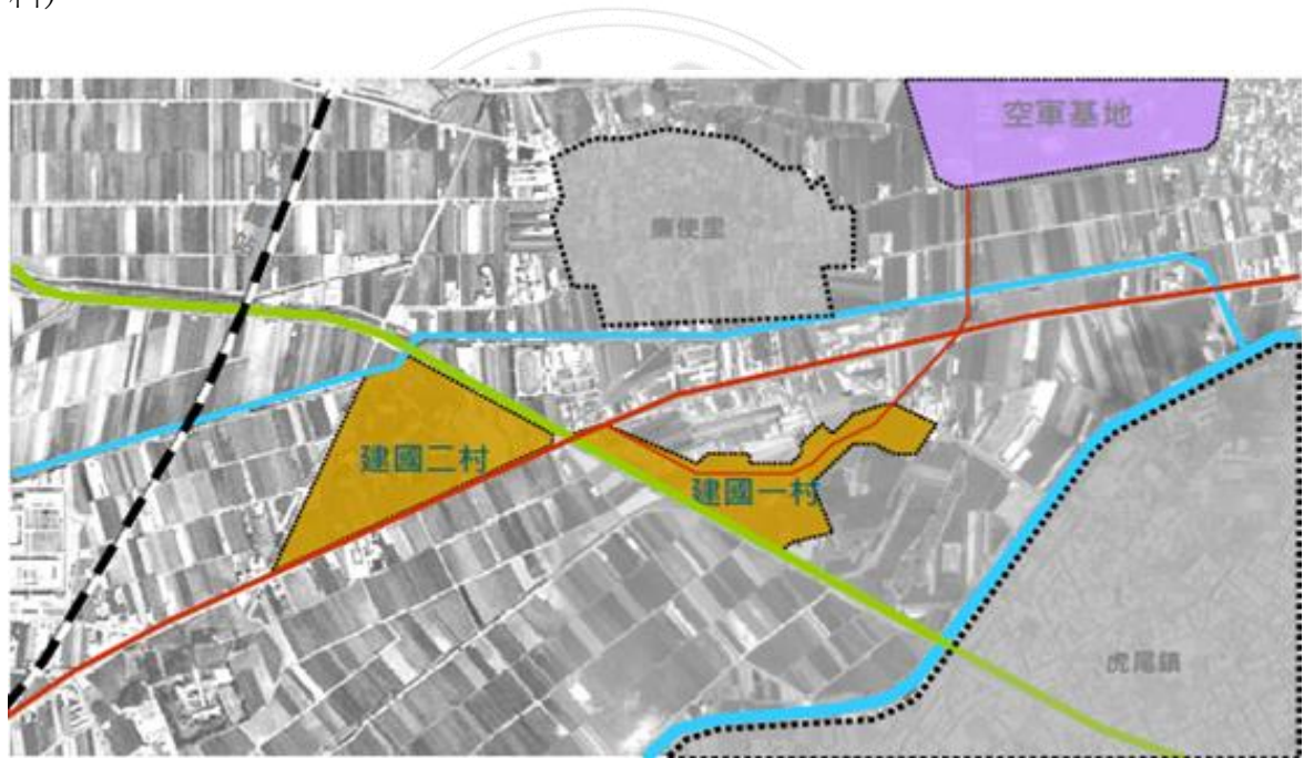
圖 1，虎尾建國眷村(建國一、二村)

本研究之虎尾建國眷村位處虎尾鎮中心，地處於虎尾鎮建國里，是國內少見之農村型眷村，有獨特的軍眷文化地景及自然農業環境景觀。以建國一、二村為主要場域保存及歷史現場再造地區，目前場域內既有軍事設施：大小防空洞 27 座、戰備蓄水池 6 座、入口崗哨 3 座、高水塔 2 座、方形濾水蓄水池 2 座、圓柱型濾水蓄水池 2 座、入口門樓 2 座。(文化部文化資產局、建國眷村再造協會資料)