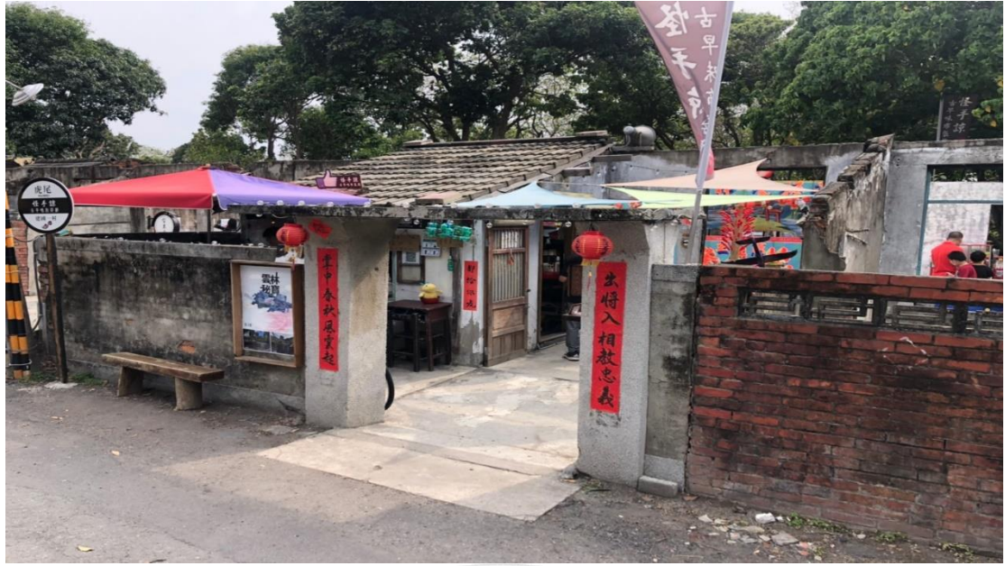
圖 4，眷村內商家，圖片來源：研究者自攝