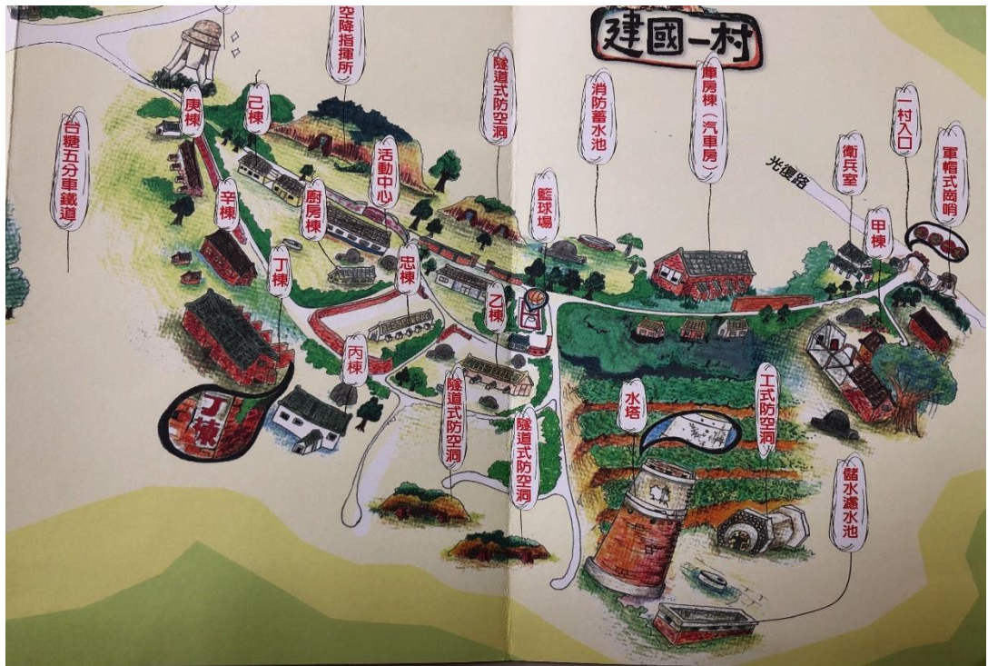
圖 5，建國一村

增援國軍在雲嘉地區的軍事行動裡增加困難，吃盡了苦頭，這就是虎尾在二二八事件中如此重要的原因。