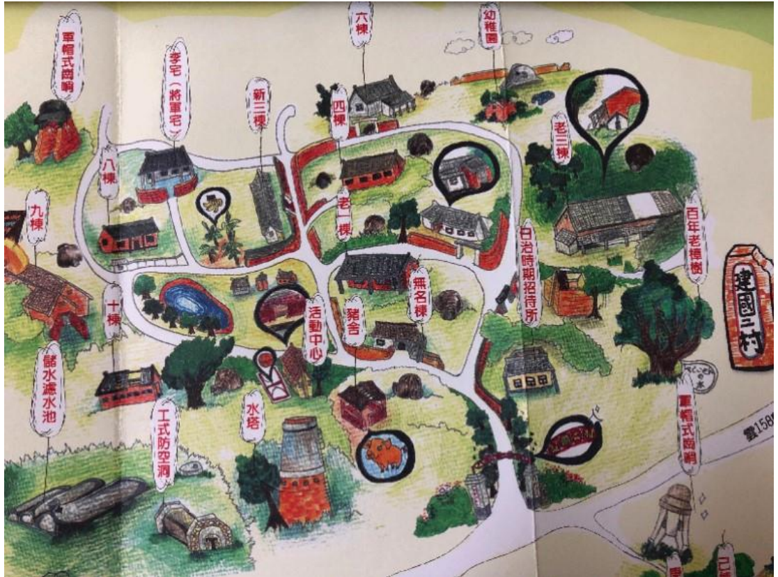
圖 6：建國二村