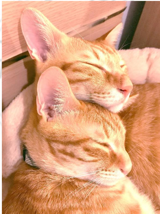
圖 4-4 巴迪與妞妞

確實她講的一些巴迪和妞妞跟我的回應，讓我比較沒有那麼自責，就是我對待牠們的病情的處理這樣子，還有我對牠們付出的感情跟那些愛啊、關心什麼的，確實有接收到，牠們真的有感受到，她還有提到說像哥哥會做什麼舉動啊來跟我撒嬌，或者是妞妞跟我做什麼舉動，回應對我的好感什麼的，對那部分讓我覺得就是很窩心。這個部分確實有被療癒到。(橘 1-4-12)