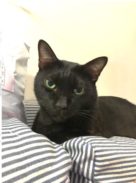
圖 4-3 OA

「雖然至今我對牠的愧疚感還仍存在，但這個夢療癒到我的部分是我的 OA 還 是很愛我，因為牠會來看我啊，我講的話牠還是會聽啊，還是聽得懂我的話 啊。唉。」(史 1-7-3)