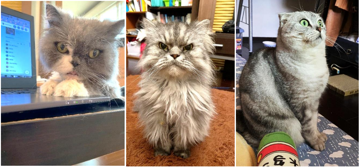
圖 4-5 左起依序為：內內、DiDi、GiGi