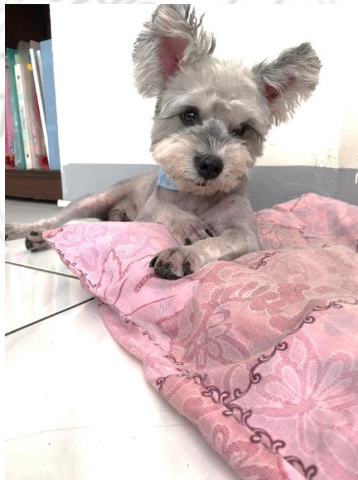
圖 4-2 寶寶