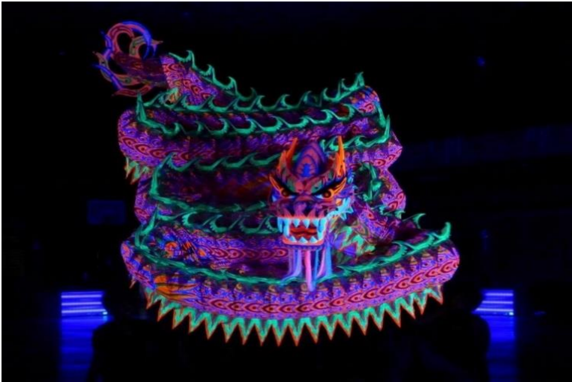
圖 3-6 舞龍隊參加地方社區展演活動