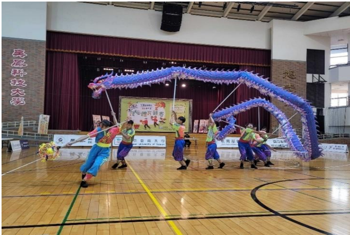
圖 3-4 舞龍隊參加 111 年度教育部體育署全國各級學校民俗體育競賽