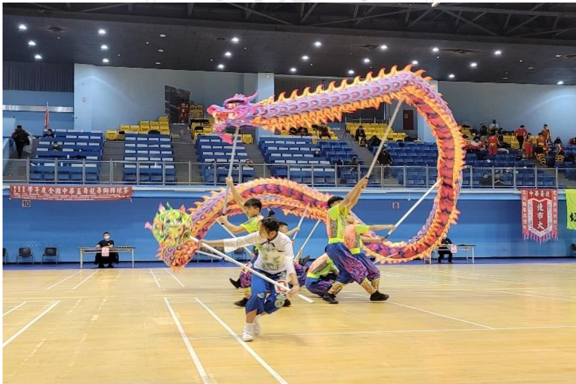
圖 3-5 舞龍隊參加 112 年度全國中華盃比賽