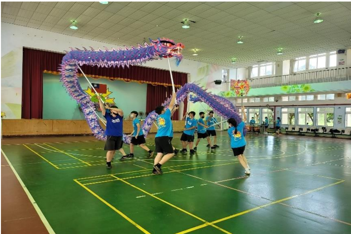
圖 3-1 校內訓練-舞龍練習圖(一)

芳苑國中舞龍隊的成立，獲得地方社區熱烈的迴響。參加大賽是全校中高年級同學擔任，而且因為學校人數有限，無法像大學校可以挑選選手，因而全校同學都是選手，同學間不分男女全力以赴，舞龍隊成員訓練項目，包括武術、體能訓練、戰鼓及舞龍等，這些訓練需要消耗大量體力與耐力，而堅持留下來是能吃苦耐勞，大部份學生之所以參加舞龍隊，代表學校參加演出或比賽為第一原因，而深厚同儕友誼也是重要因素。以下圖 3-1 與圖 3-2 說明芳苑國中舞龍隊之平時訓練狀態。