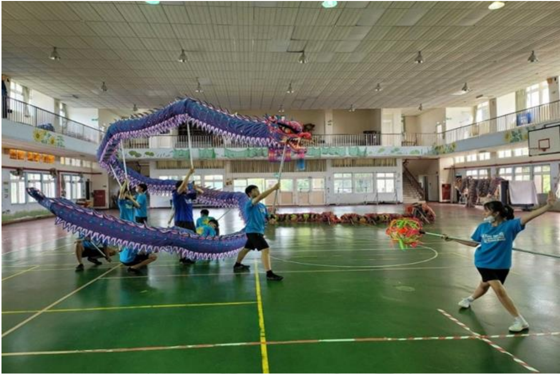
圖 3-2 校內訓練-舞龍練習圖(二)