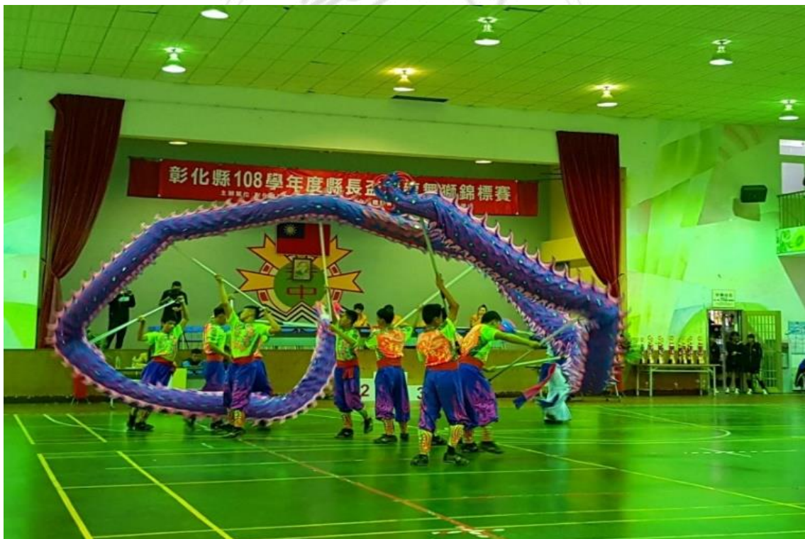
圖 3-3 舞龍隊參加 108 年度彰化縣縣長盃錦標賽

而芳苑國中舞龍隊成立以來表演邀約不斷，舞龍隊成員來自各年級有興趣的學生，目前已有幾所大學體育系或體育大學相繼成立民俗體育組，這也讓舞龍隊的孩子多了一條升學的管道。以下圖 3-3、圖 3-4、圖 3-5 即是本校舞龍隊參加過幾個重要舞龍比賽，讓孩子們努力揮灑汗水的舞台。