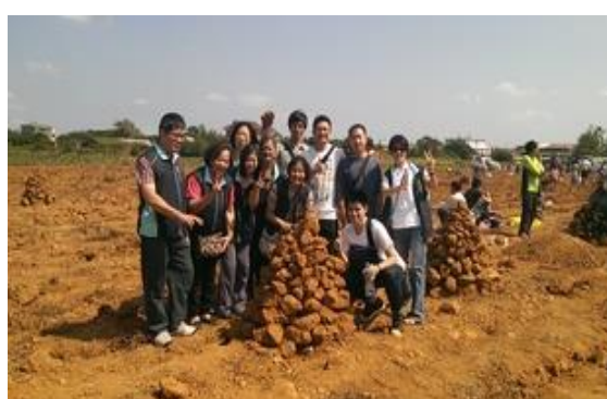
圖 3-11 2013 大楊美食文化嘉年華