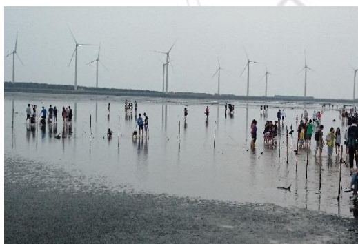
圖 3-2 高美溼地現況