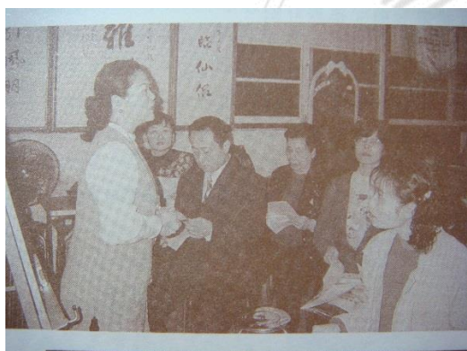
圖 3-6 南管薪傳研習情形