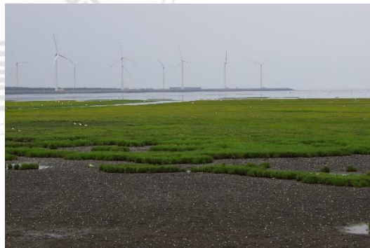
圖 3-3 高美溼地現況