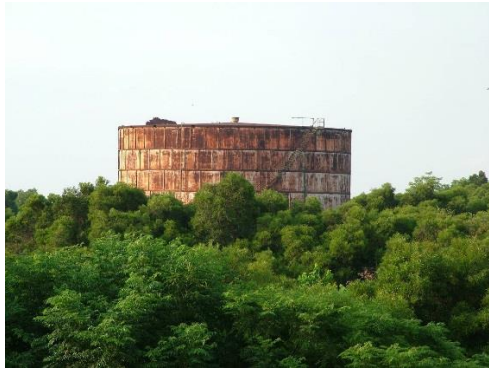
圖 3-4 大楊油庫現況圖