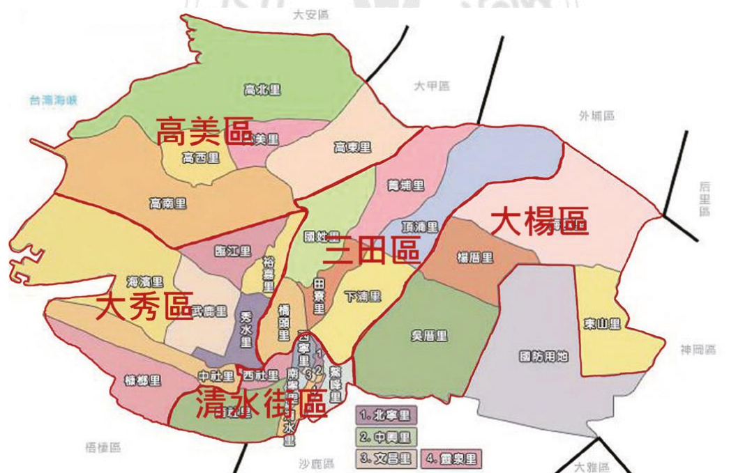
圖 3-1 清水區行政區域圖

清水位於大肚台地與台灣海峽間的清水隆起海岸平原北部一帶，東倚大肚山脊，與神岡區相接，西臨台灣海峽，北隔大甲溪與外埔、大甲、大安三區相銜接，南連梧棲、沙鹿兩區，東西寬為 12.55 公里、南北長 7.5 公里，交通動線四通八達極為便利，全區面積計為 64.1709 平方公里，依地形性質分為清水、大秀、三田、高美、大楊等五大區域。行政區域共分 32 里。 6