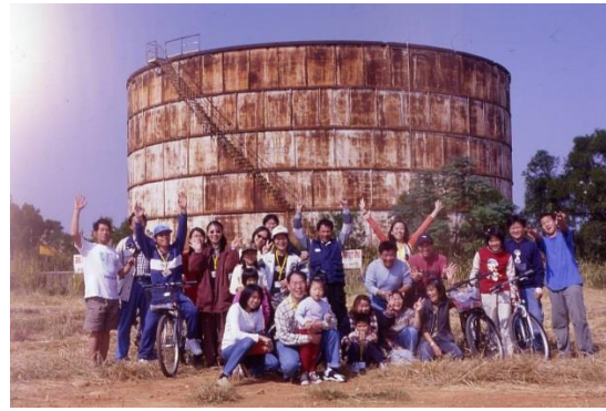
圖 3-5 油庫體驗之旅活動照片