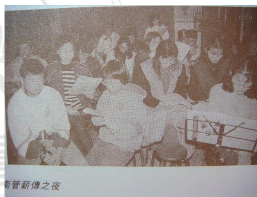
圖 3-7 南管薪傳研習情形