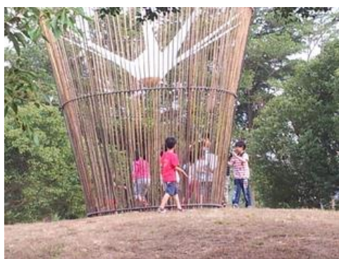
圖 3-10 2012 山海地景藝術節