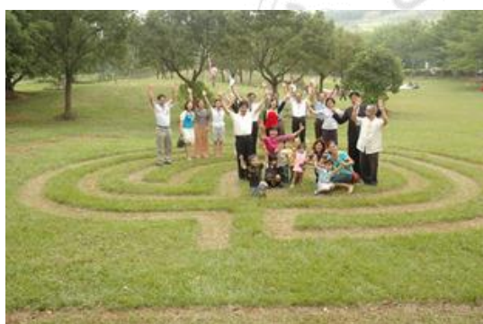
圖 3-8 2008 山海地景藝術節