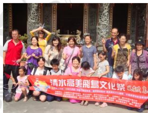
圖 3-9 2011 飛鳥文化季活動