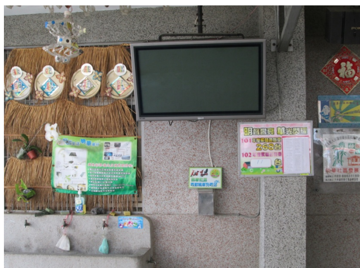
圖 4-6：兼具純樸民風的電動機車充電站