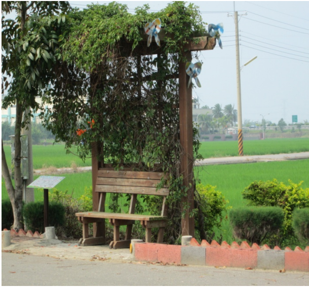
圖4-8：明華社區坐椅兼具美觀、生態與風力發電

即是明華社區讓自然環境重新整頓，消除污染，恢復原始的生態樣貌之後，再加上符合時代潮流，也係躍為主流價值的環保、有機以及低碳之訴求，將既有的自然環境資源重新整理，加上合乎政策的新思維，兩者結合不只是 1+1=2 ，而是 1+1 的N次方的產值。這是明華社區由老舊、凋零、年輕人紛紛向外跑，到躍升為嘉義縣之明星社區的重要原因。