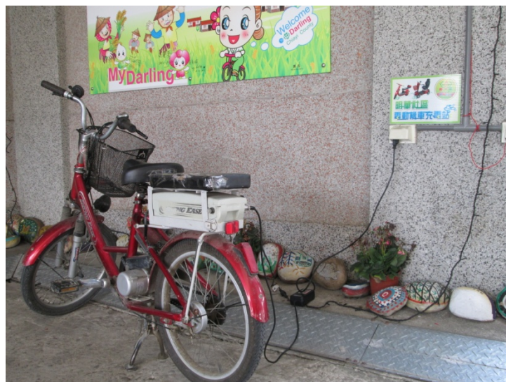
圖 4-5：電動環保腳踏車

這些環保資源已被運用到社區的觀光休閒方面。很多遊客前來，不只因為明華社區清潔乾淨，更享受因環保而形成的有機及健康無害的環境。