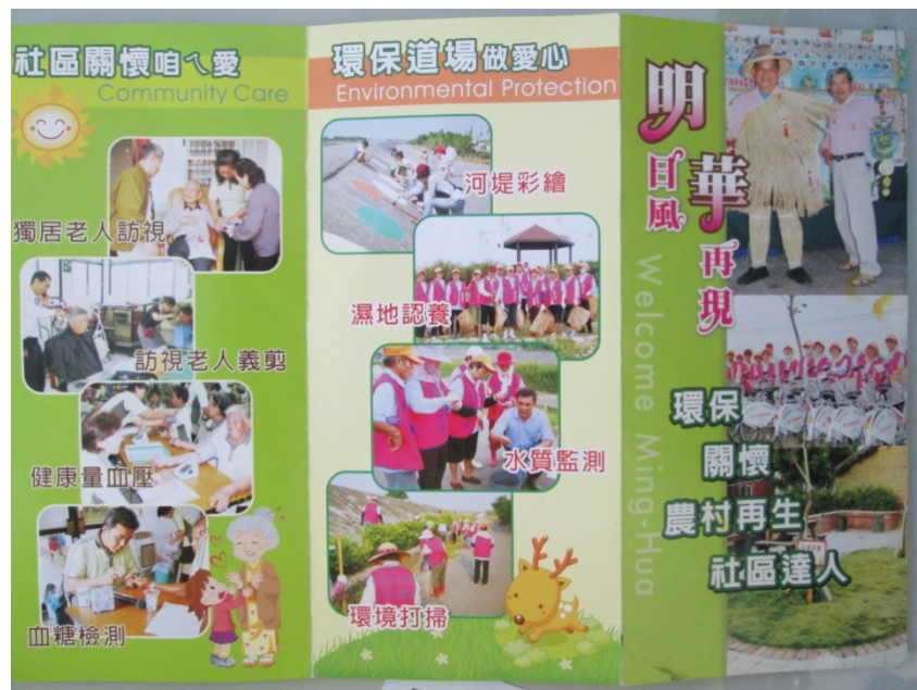
圖 4-2：以環保及農村再生為訴求的明華社區簡介 DM

這個火種是讓民眾藉由與其他社區的比較，特別是視線及視覺，即可評斷的環境，來自覺於明華社區所需要改變之處，這種自覺是社區營造及帶動民眾參與的火種，也埋下了明華社區朝向有機、低碳及環保發展的方向。但火種不是點燃即可，火種的燃燒是需要持續的。