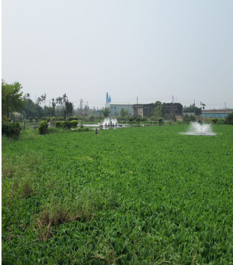
圖 4-3；三疊溪明華濕地

這處濕地也是明華社區的污水處理池，它原本是公墓的滯洪池。由於北港溪上游的三疊溪遭到工業和家庭廢水嚴重污染，水質污濁還發出惡臭，明華社區於是將公墓滯洪池改造成濕地生態園區，在水中種植水生植物，藉由光合作用祛除水中的有機物和氨氣，經過自然淨化、處理與過濾後再排放入北港溪。