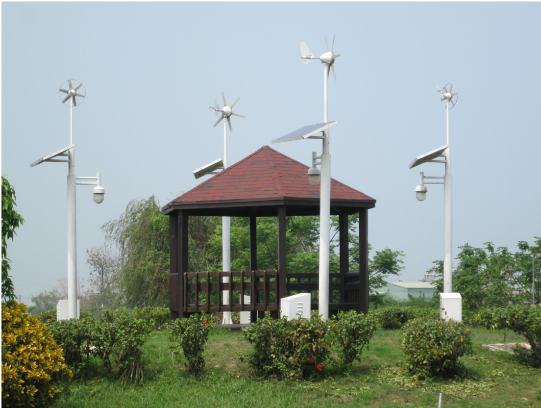
圖4-10：太陽能及風力等環保元素隨處可見的明華社區