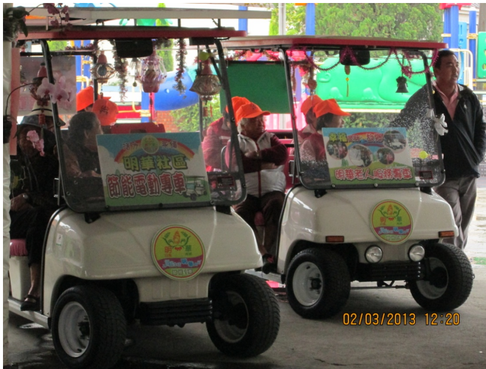
圖 4-7：明華社區之節能電動車

平常可以載一些不方便遊客參觀，還可載老年人到其他地方去(G-0-3-8)。 現在社區現有電動腳踏車都是鼓勵企業或個人捐出來的，3台、2台、1台都可以，我們車後輪那裏設計廣告的地方替他們做廣告，其他單位來這裡都會借用腳踏車如南華大學、中正大學、慈濟醫院等，無形中對他們增益很大(G-0-3-15)。