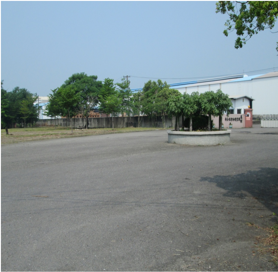
圖 4-4：萬財木業前被整理過的空地

事實上三疊溪濕地可說是明華社區發展休閒旅遊的核心，但也是糞土變黃金的實例。而明華社區舊有的環境，因為清潔，因為生態，竟然成為一種吸引人們前來消費、賞玩的資源及資產。