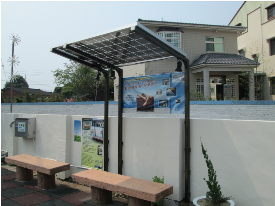
圖4-9：明華社區之太陽能設備

即是明華社區讓自然環境重新整頓，消除污染，恢復原始的生態樣貌之後，再加上符合時代潮流，也係躍為主流價值的環保、有機以及低碳之訴求，將既有的自然環境資源重新整理，加上合乎政策的新思維，兩者結合不只是 1+1=2 ，而是 1+1 的N次方的產值。這是明華社區由老舊、凋零、年輕人紛紛向外跑，到躍升為嘉義縣之明星社區的重要原因。