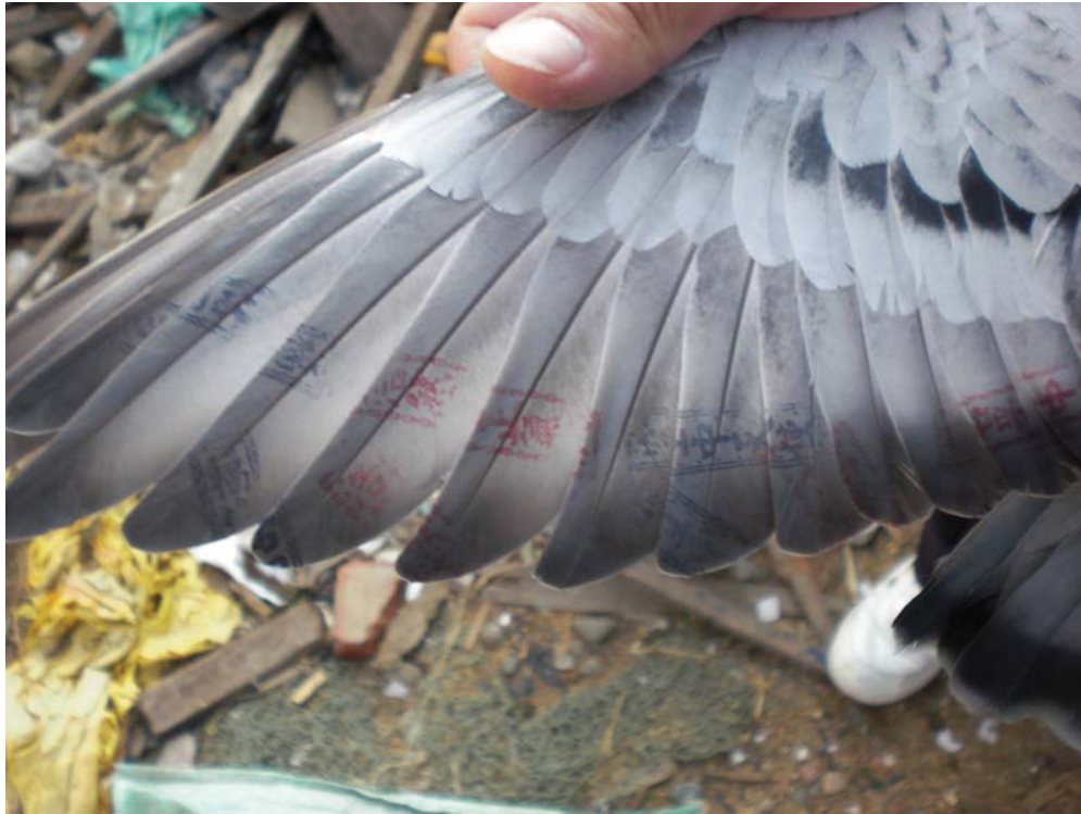
(圖 4-7 鴿子翅膀上的輪印)

上面為翅膀上的輪印。一半在鴿子的翅膀上，一半在審查資料上，如果鴿子飛回來，鴿會的工作人員必須和對腳環外，還要檢驗翅膀上的印章，是否和當初比賽前的印章吻合。