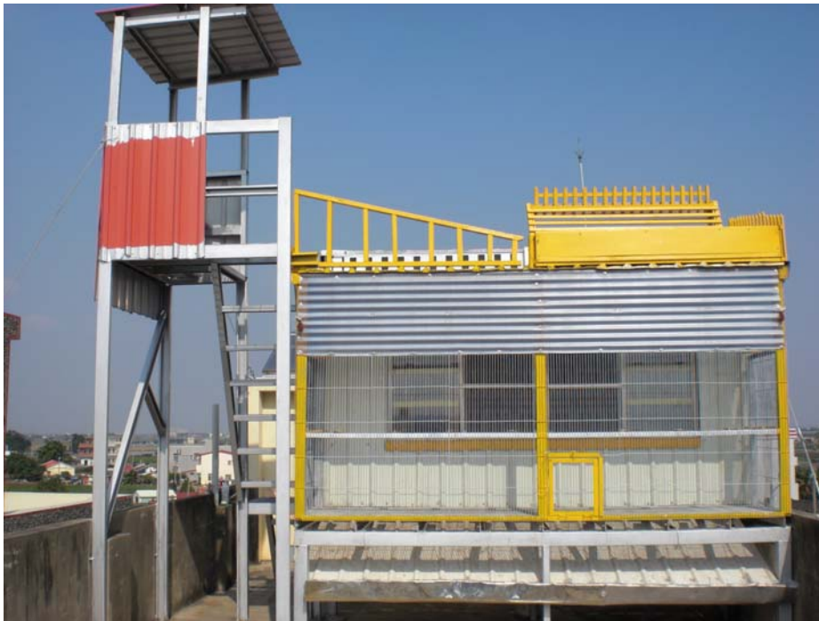
(圖 4-1 住家頂樓鴿舍)

然而，上述的一些做法都是在設置鴿舍所必需要考量的，這次在觀察者的家中，其鴿舍的設計如(圖 4-1)，是賽鴿所居住的地點；然而(圖 4-2)是種鴿所居住的地方。