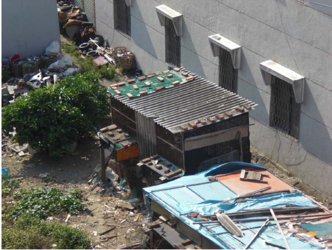
(圖 4-2 住家樓下種鴿舍)

在美麗外觀下，前年 A1 花了台幣近 50 萬，打造鐵製材料鴿舍，而捨棄木製鴿舍。因台灣是潮濕多雨的海島氣候，木頭易腐爛，不易養殖鴿子，所以 A1 在前年換掉舊木製鴿舍，角逐次年的比賽。