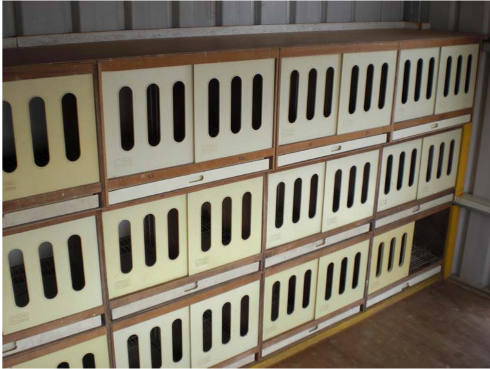
(圖 4-6 比賽鴿子的櫥窗)

而訓練方式，可分為(1)訓認(2)飛翔練習(3)放鴿，每一步都很重要，這都會關係的鴿子在比賽中的表現，然而這三部分實施，又有一些小細項：