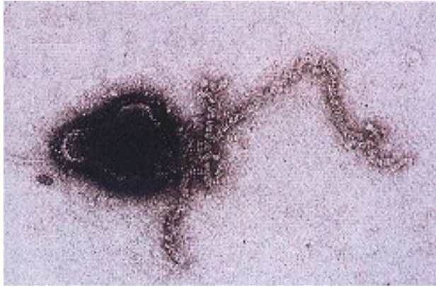
(圖 4-5 為電子顯微鏡下所見巴拉米哥病毒)