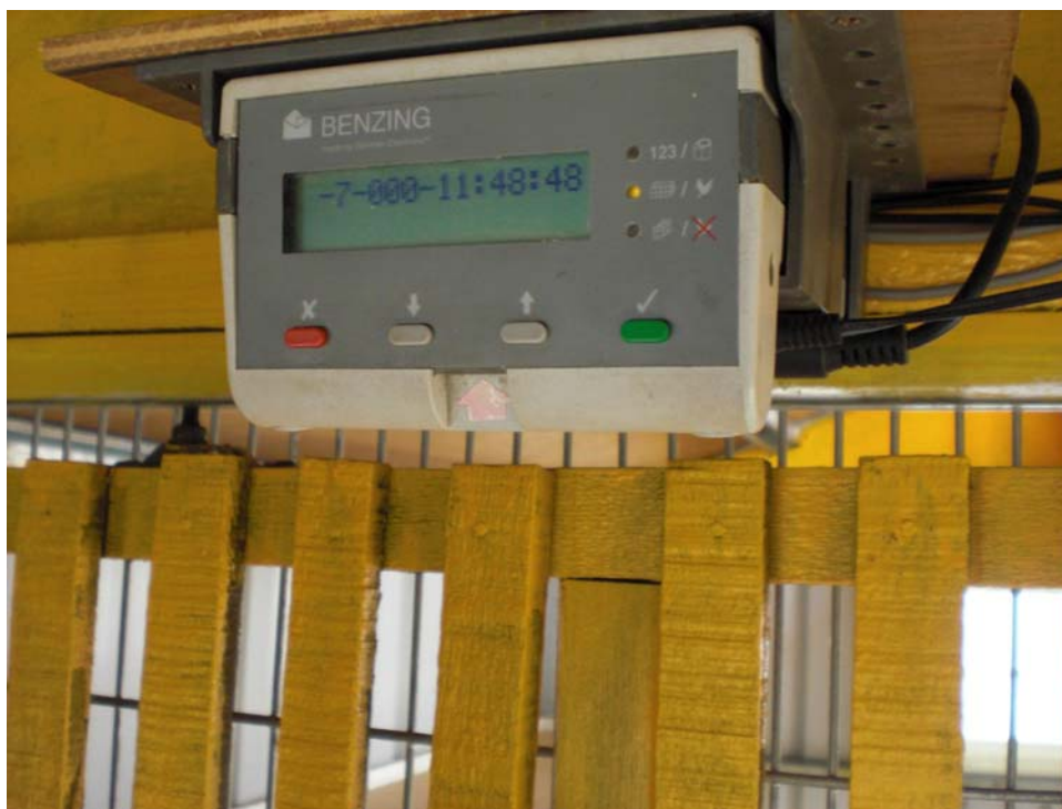
(圖 4-9 感應器)

因為怕有人會給你搞鬼？搞 AB 舍，這你要叫人怎麼賭，會裡規定 10 分鐘裡面，感應到 10 分鐘之內要把鉛片打進去，如果鴿鐘感應到 1111 十點回來，但是他在十點零五分打進鉛片，這個鴿子就是正常，但如果感應完 10 分鐘以內你沒打進鉛片，這隻鴿子失格。但你失格不是頭一隻喔，是整個鴿舍都失格，這是很恐怖的。(C1)