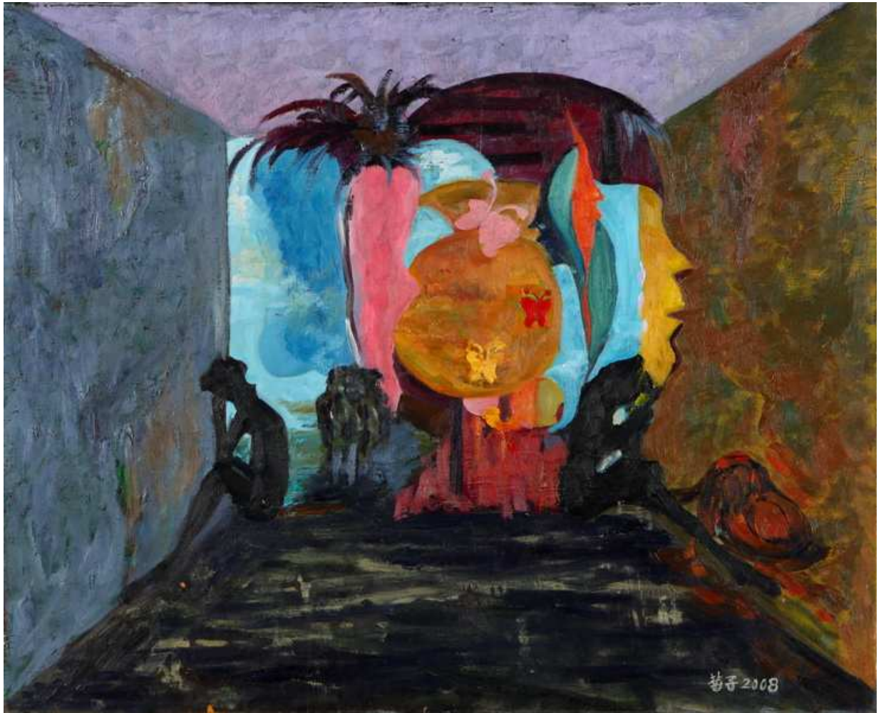
圖 4-1-5 蘇菊子，情殤，油畫，2007，15F