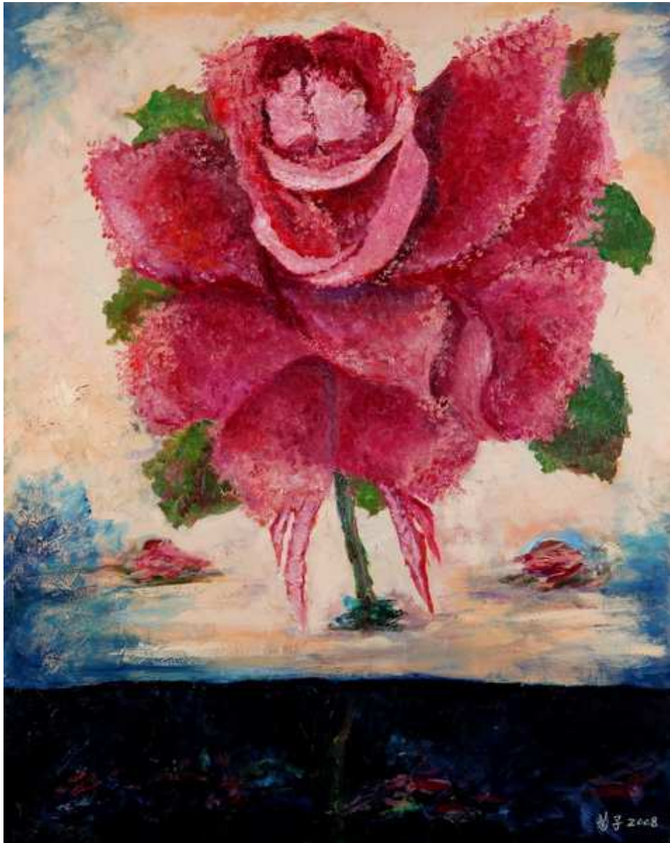
圖 4-2-3 蘇菊子，親密關係II 油畫 2008，30P