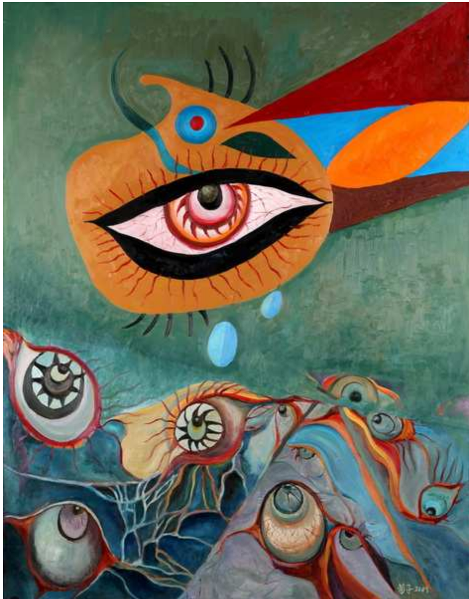
圖 4-2-8 蘇菊子，異樣 1，油畫 2009，50F