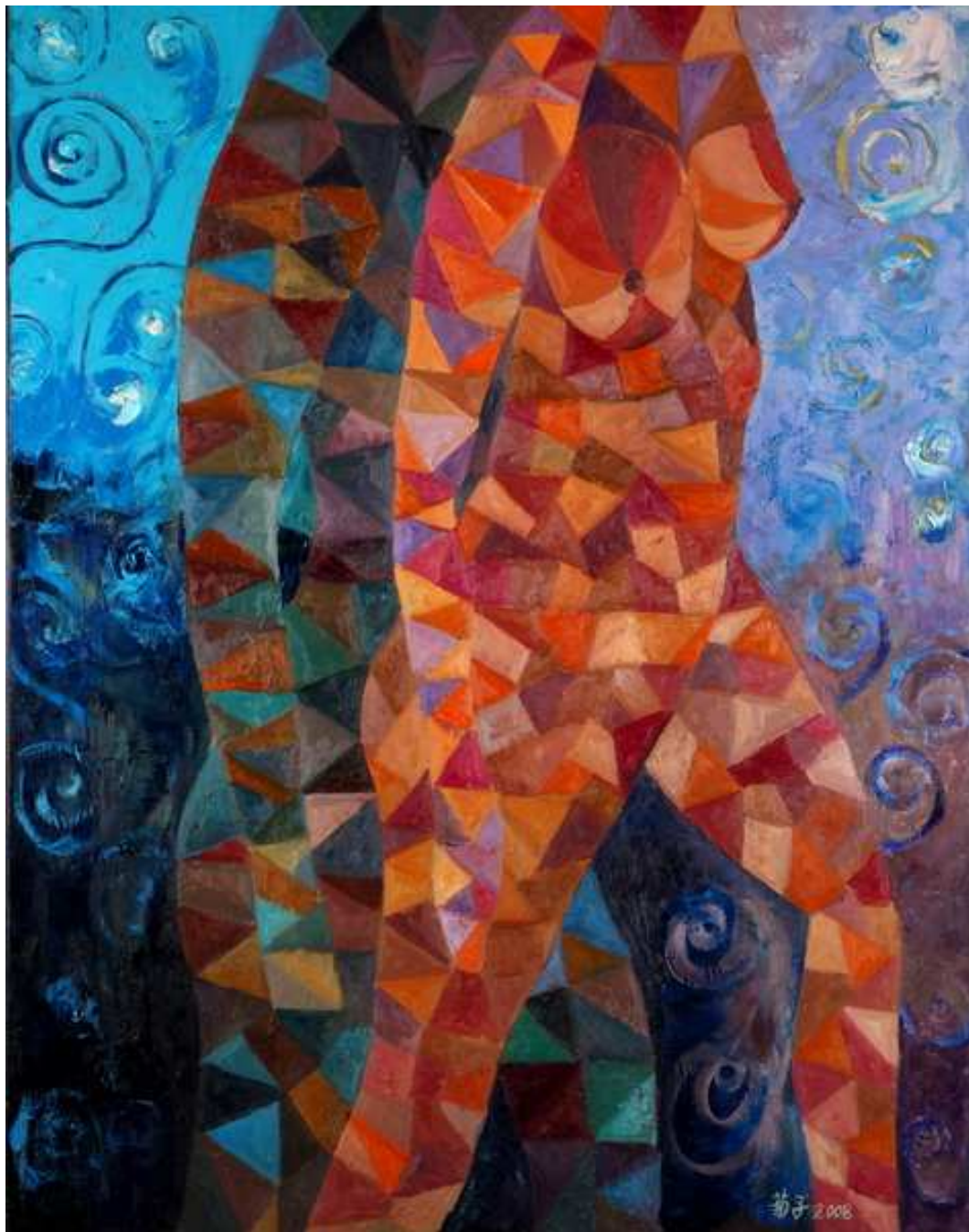
圖 4-2-2 蘇菊子，親密關係I 油畫 2008，50F