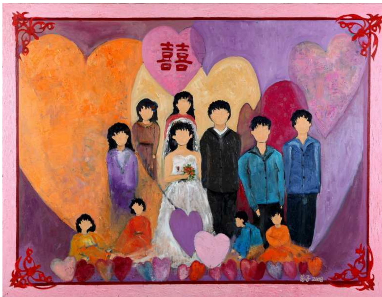
圖 4-2-5 蘇菊子，囍，油畫 2008，50F