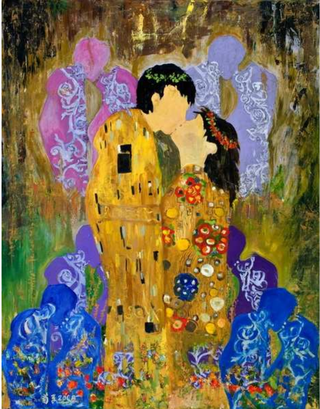
圖 4-1-2 蘇菊子，金童玉女，油畫，2007，50F