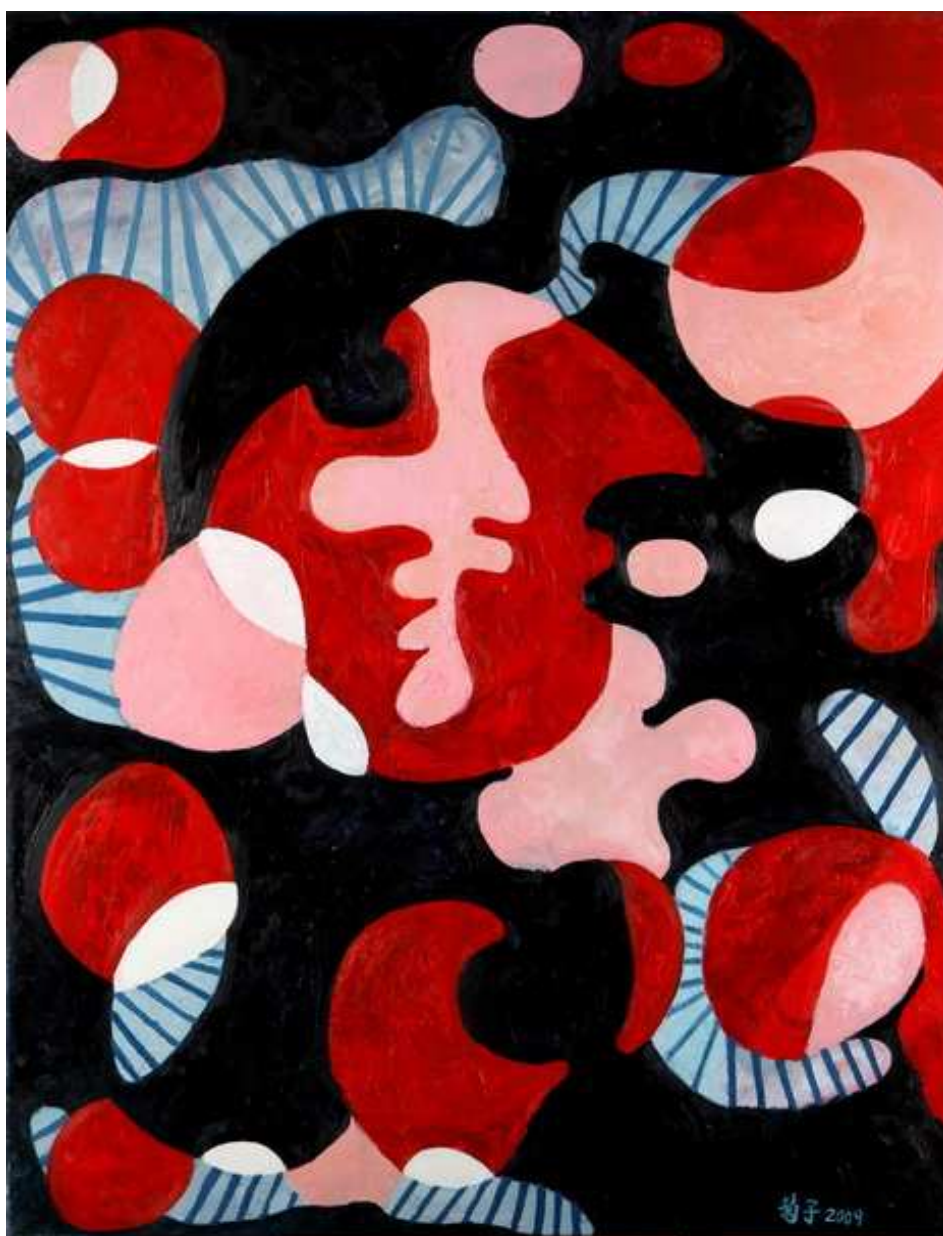
圖 4-2-7 蘇菊子，錯置，油畫 2009，50F