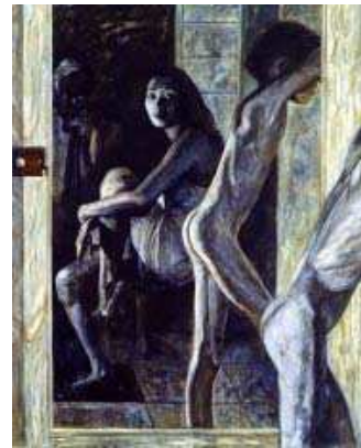
圖 2-6 平淡人生，劉曼文，1996