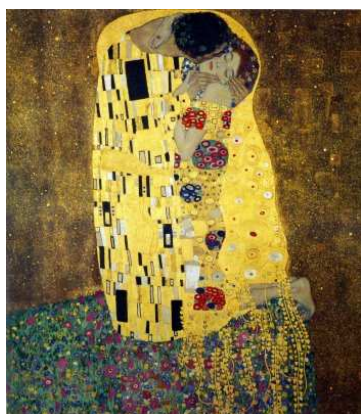
圖 2-1，克林姆，吻，1907-08 年， 維也納奧地利美術館，油畫