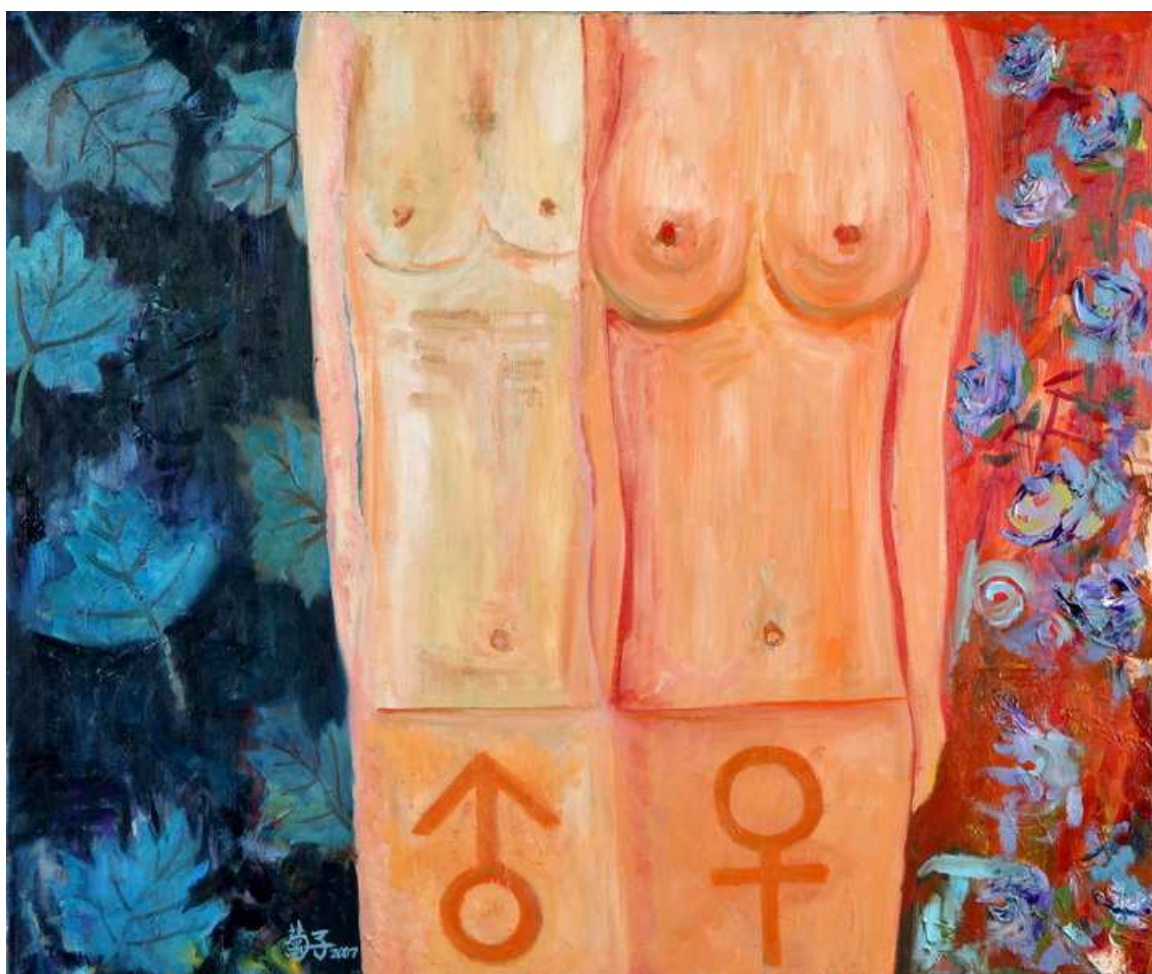
圖 4-1-1 蘇菊子，紅男綠女 油畫，2007，20F