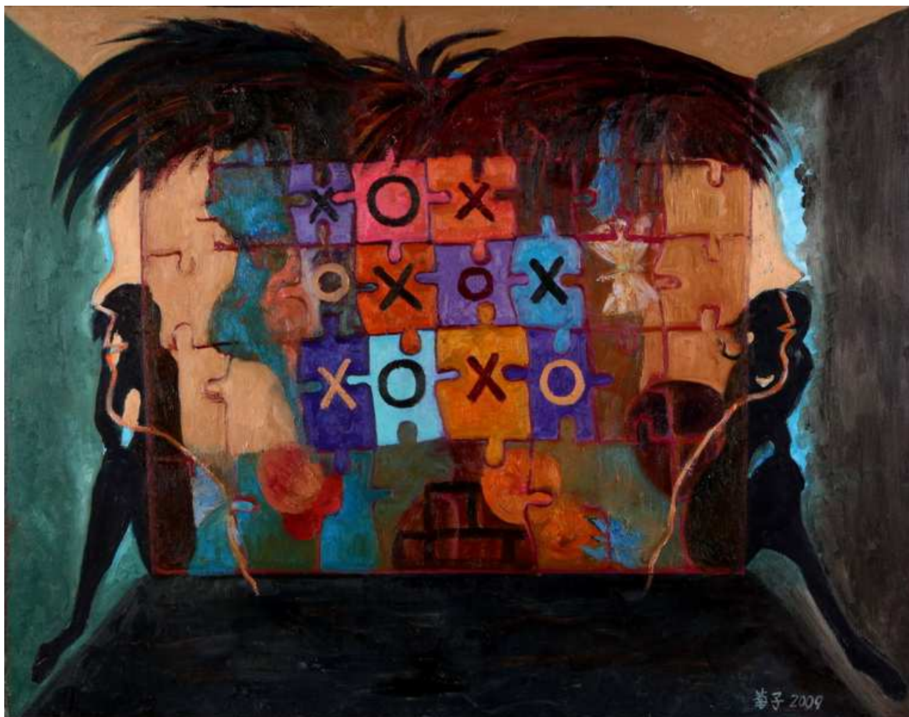
圖 4-1-6 蘇菊子，記憶拼圖，油畫 2008，50F