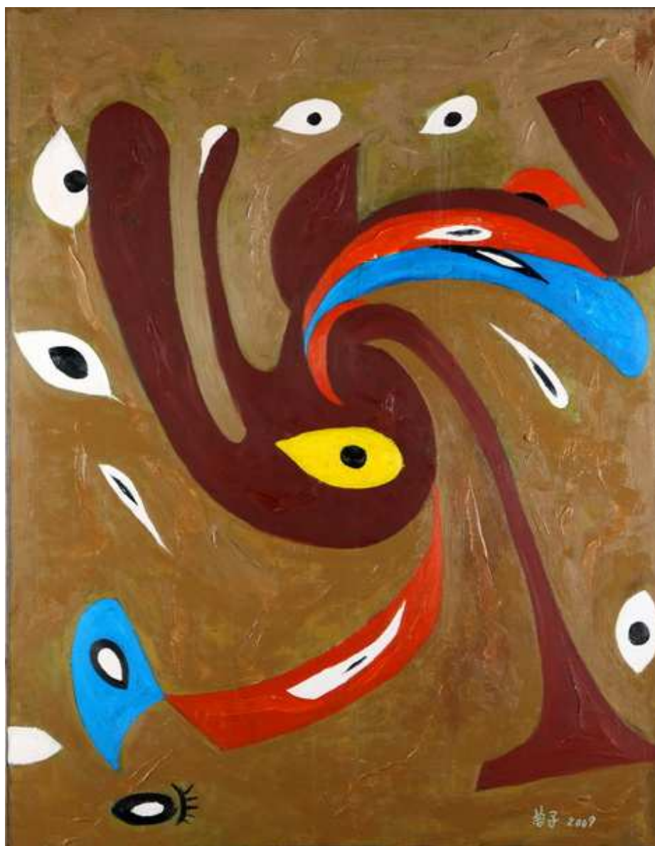
圖 4-2-9 蘇菊子，異樣 II，油畫 2008，50F