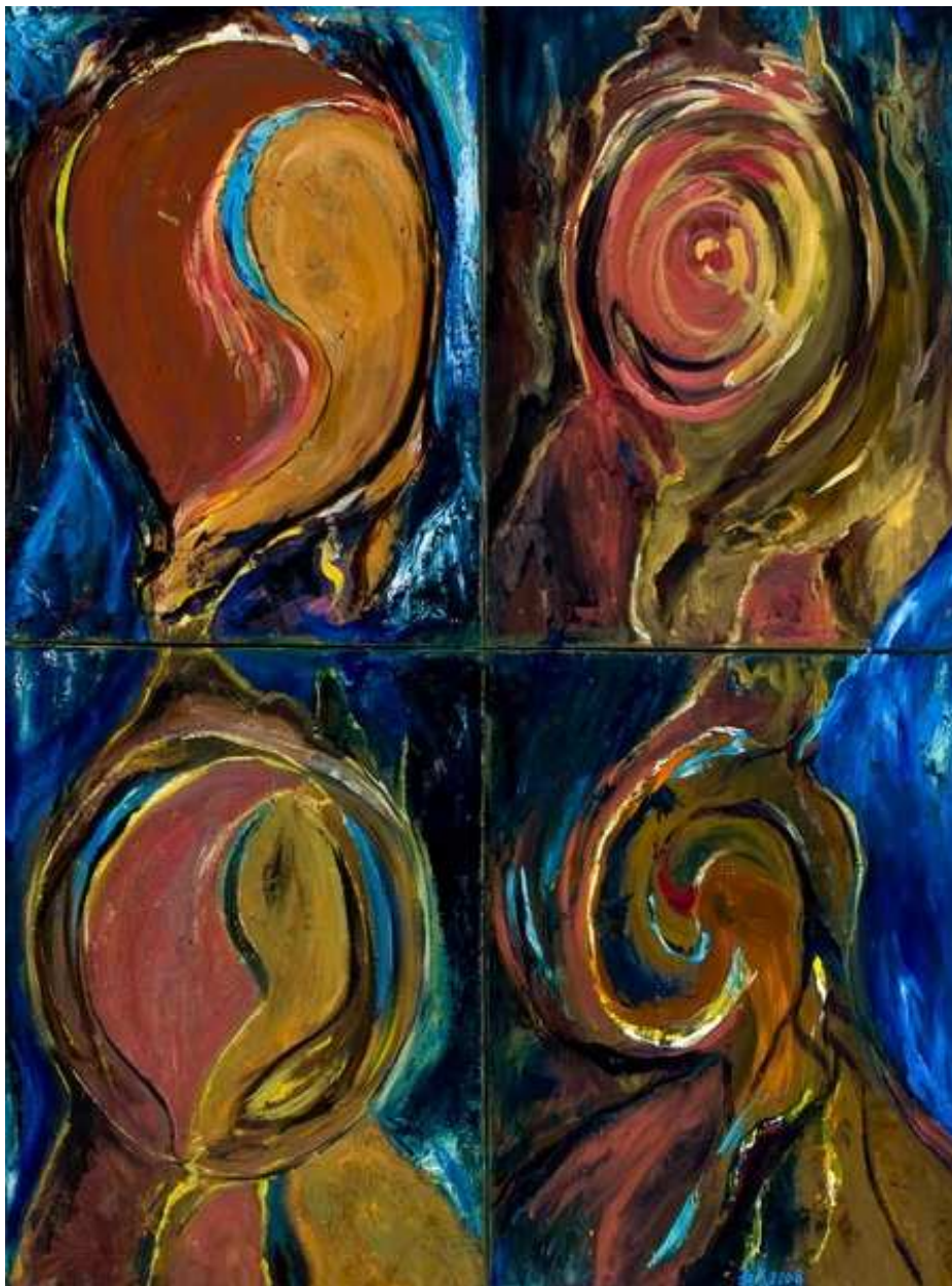
圖 4-1-3 蘇菊子，愛情變奏曲，油畫，2007，40F