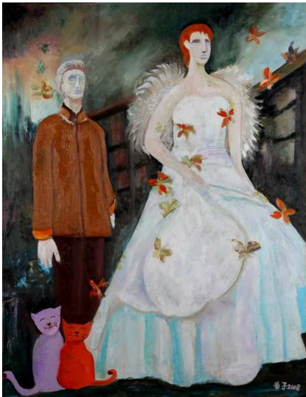
圖 4-2-6 蘇菊子，霓裳羽衣，油畫 2008，50F