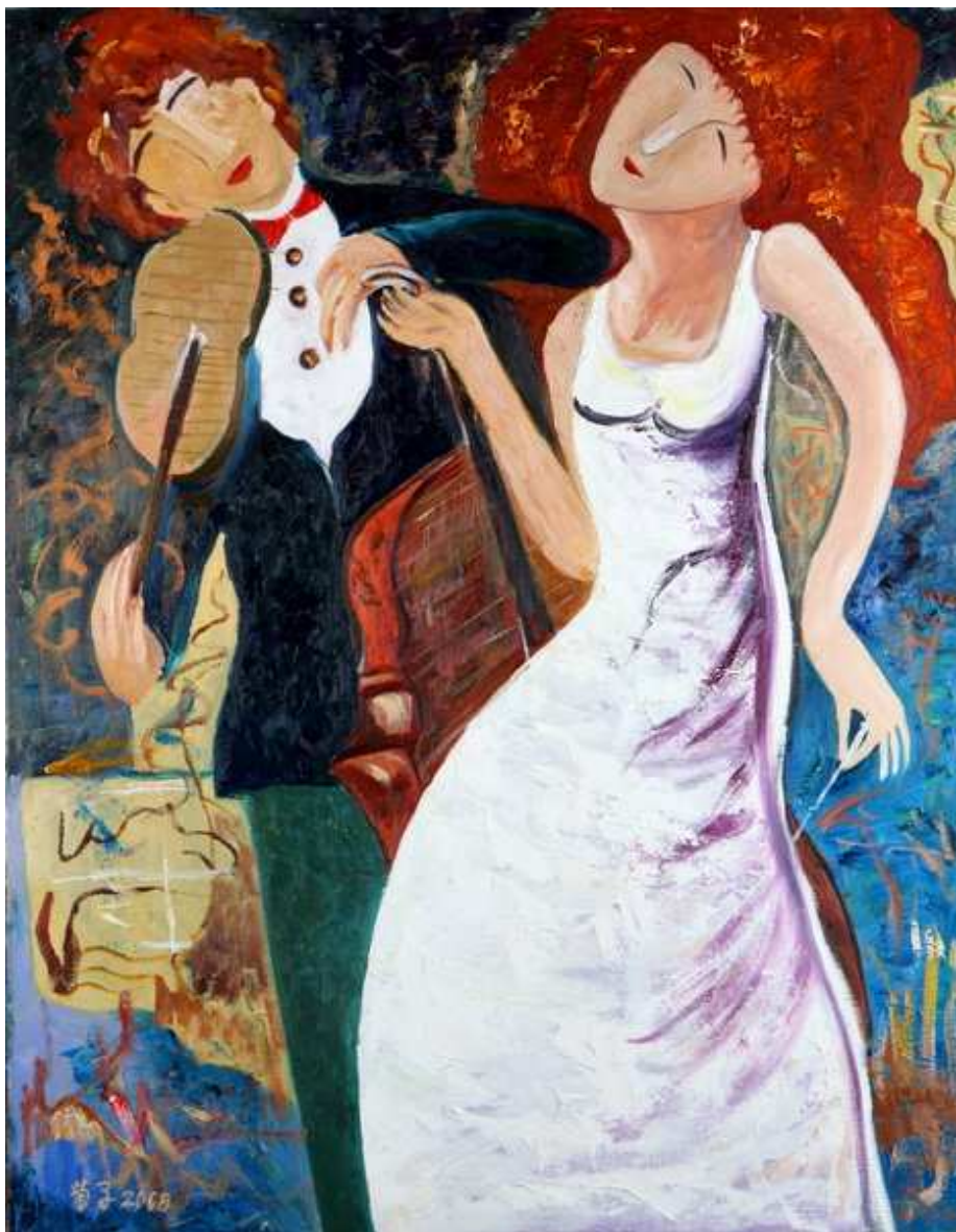
圖 4-2-1 蘇菊子，琴瑟和鳴，油畫 2008，50F