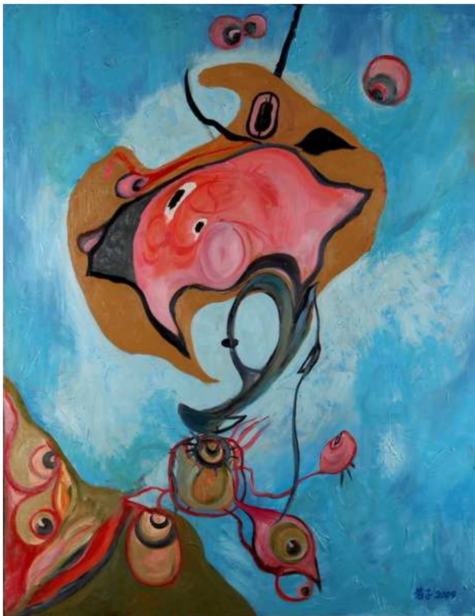
圖 4-2-10 蘇菊子，異樣 III，油畫 2008，50F