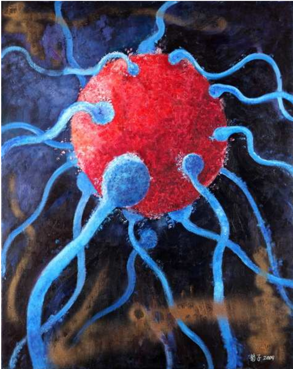
圖 4-2-4 蘇菊子，親密關係 III 油畫 2008，30P