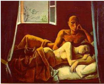
圖 2-5 晨曦，卡爾·霍費爾，1935，油畫

婚姻難道是如此令人絕望嗎？應該不是。要不總是有許多人想要跳進來，它迷人之處為何呢？或許值得婚裡、婚外的人細細思量！