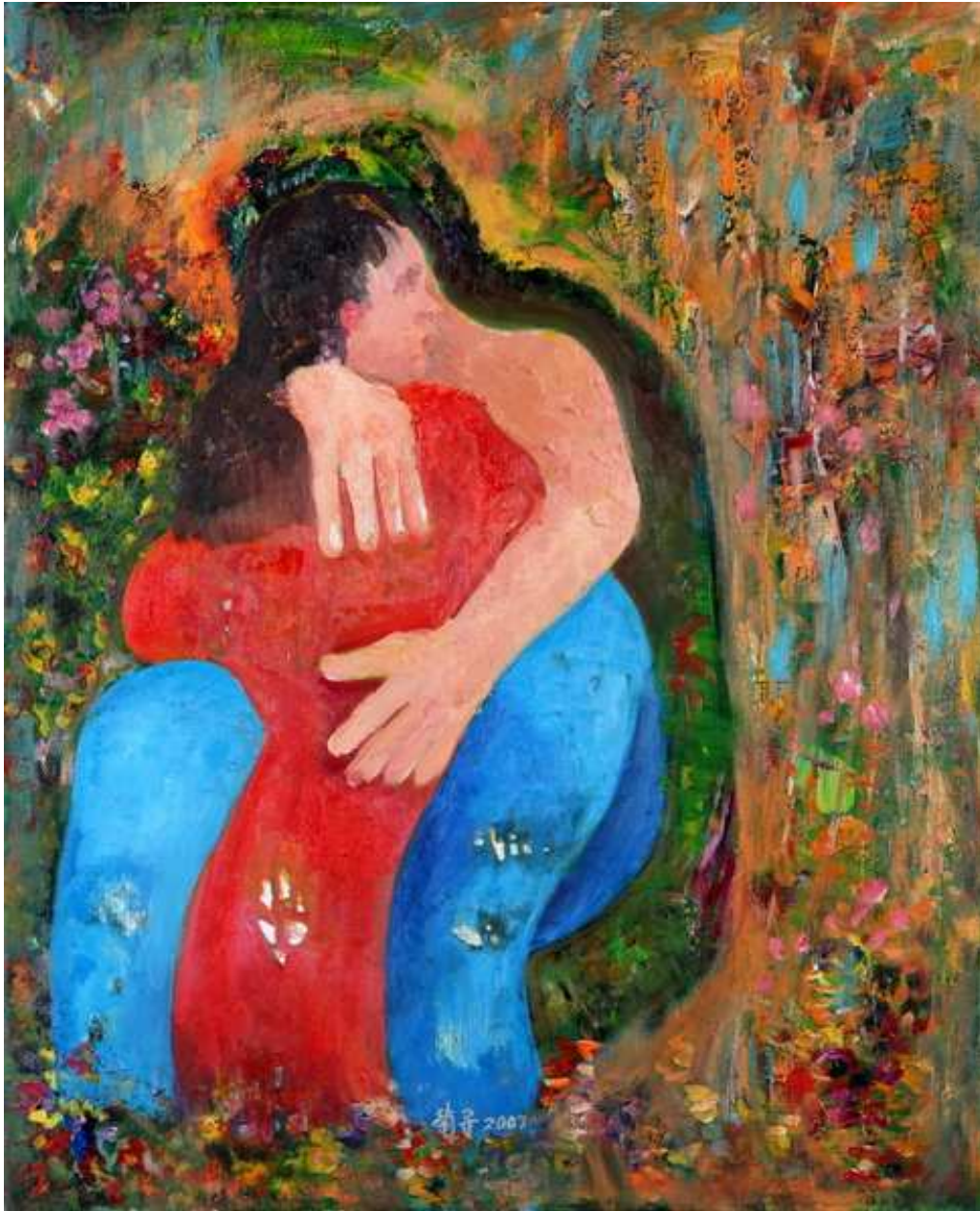
圖 4-1-4 蘇菊子，擁抱，油畫 2007，15F