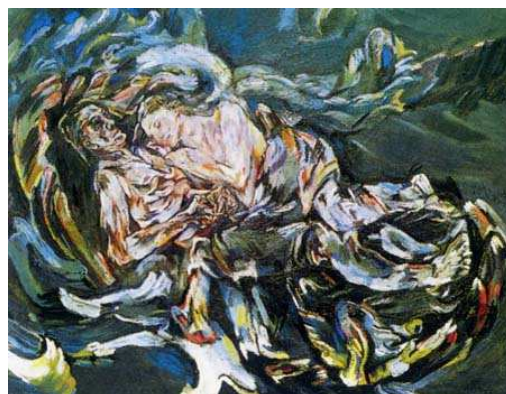
圖 2-7 風中的新娘，柯克西卡，油畫，1914；巴塞爾藝術博物館