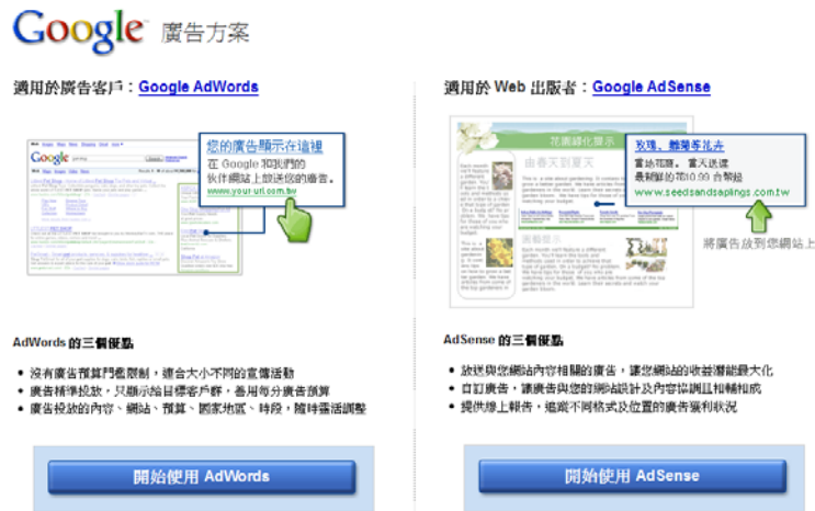
圖九、Google 的廣告招募頁面 52