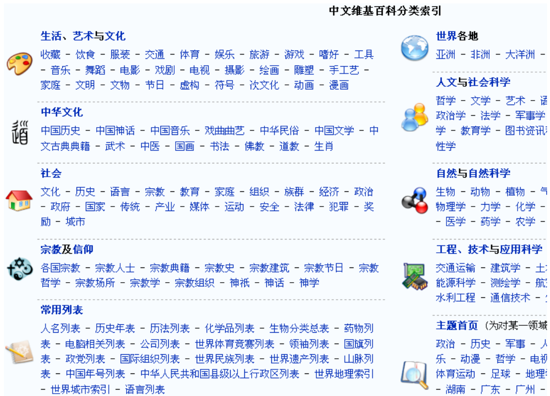
圖十一、中文維基百科分類索引 53

在第四章第一節便有提過關於中文維基百科版面更新的例子，雖然有許多不同的版面樣式提供投票，卻不是選定後固定，之後階段的投票中，不論是顏色、框架、字體等等細部，任何贊成者都必須提供能夠說服人的意見，這就表示，維基百科中的發言者若希望其他人同意他的意見，不能夠以強制性的方式無視他人意見而執行，反而需要在聽取批評後不斷返回修正自己的看法或另外提出解釋，直到能夠說服他人達成「共識」之後才成爲暫時的最終結果。這並不表示維基百科中的管理員或管理階級強制性的要人接受這套溝通理性的原則，相反的，遵從維基百科原則者，也是在過去經由共識的過程之後才如此行動，因爲當發文者在討論或意見中表態的同時，就內在的同意了維基百科所秉持的原則。