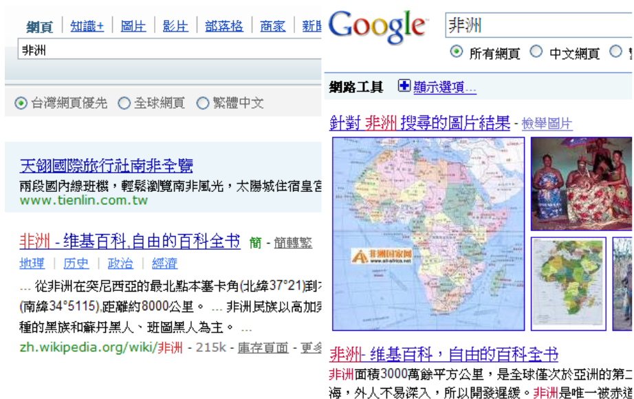
圖十、Yahoo (左) 和 Google (右) 搜尋「非洲」的結果