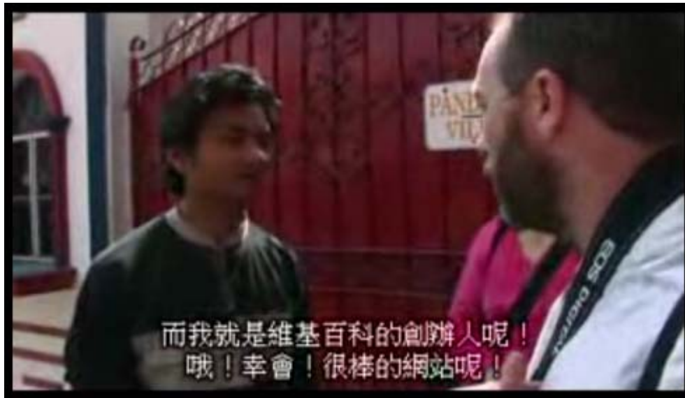
圖十三、Jimmy Wales 訪問片段

以上的例子顯示論述不是維基百科「強迫」的讓人接受，而是以開放和自由等解放的理念讓社會認可，接受者進而轉變了其原本的真理觀。現代新的知識真理觀，與其說過去受到壓抑的知識建構能力被解放，不如說像是維基百科的努力那般，以反思過去知識建構制度的方式，去論述和宣傳其理念，最終使人們的知識真理觀改變。維基百科因此並非執意的去帶來各種解放方法，而是以其論述來說服現代人，權力的運作如此一來就不侷限於對能力的壓制，透過對網路、對現實建立關係的方式，維基百科確實的達到其所想要的權力效果。