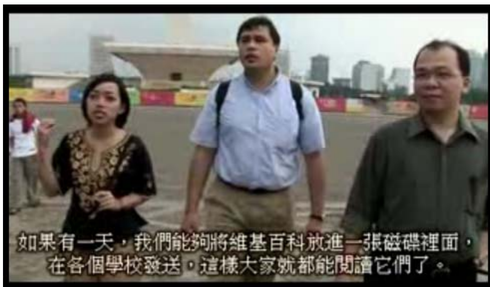
圖三、《自由取用全體人類的知識》片段

這意味著，維基百科試圖以不同的論述挑戰傳統的知識建構。傳統百科全書專家學者們的成果被認為獨斷的、拒絕開放的知識，就算該知識內容在現代資訊化了也是設限的，只歡迎具有某些條件的國家、地方或機構參考，並且該知識內容是由專家學者們強制人們接受的，沒有討論的餘地。同時，表現了挑戰傳統