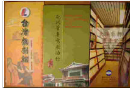
圖 65 台灣戲劇館、南北館音樂戲曲館、國立中正文化中心表演藝術圖書室等之簡介

由表 29 顯示，各公立音樂資料館所發行的相關出版品，以館（室）簡介最為普遍達到 57.1 %（4 所），其次為 CD 占 42.9 %（3 所），專著占 28.6 %（2 所），期刊、錄音帶、錄影帶、VCD、音樂導覽手冊皆占 14.3（各 1 所）。