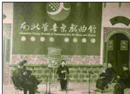
圖 64 南北管音樂戲曲館戶外舞台之音樂會 (簡介)

由表 28 顯示，各音樂資料館辦理教育推廣活動，常與其母體機構合而為一，無法單獨的運作辦理；如國立臺灣交響樂團資料中心、台灣戲劇館戲劇視聽圖書室、南北管音樂戲曲館圖書視聽資料室。辦理的項目上以影片欣賞、研習班較普遍占 71.4 % (5 所)，其次為音樂講座占 57.1 % (4 所)，讀書會占 14.3 % (1 所)。