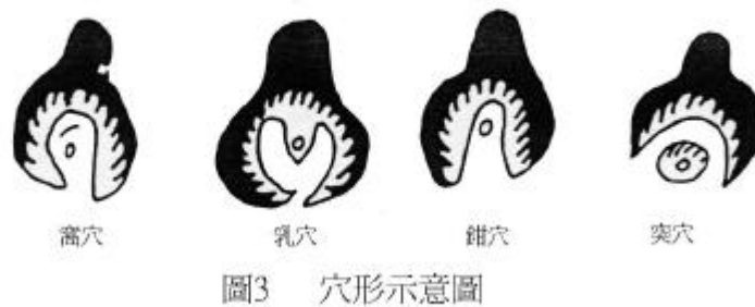
(圖 3 引自劉沛林《風水》，頁 114)