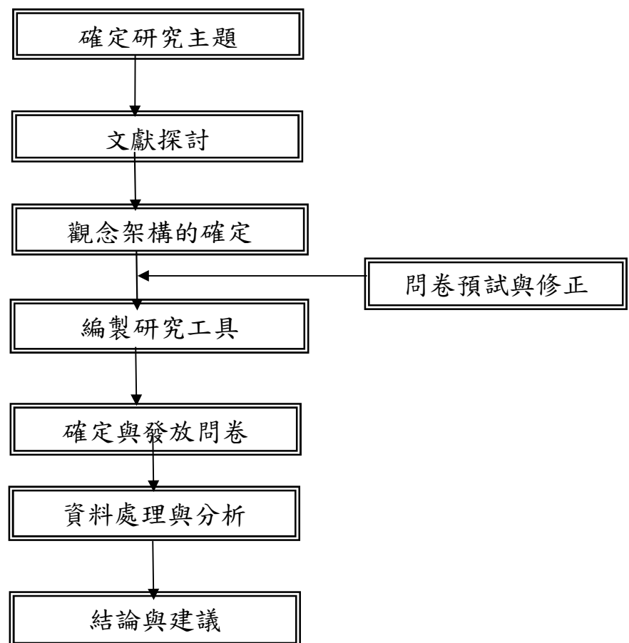
圖 1.1 研究流程圖

本研究在確定研究問題後，蒐集相關文獻，對於各個主題作更進一步的了解之後，根據研究目的及文獻探討，建立本研究的架構，提出本研究的假設、確定研究對象以及資料分析方法，接著利用問卷調查的方式蒐集研究資料，以統計軟體進行資料分析，最後進行結論撰寫，提出本研究的結果及建議。如圖 1-1 所示：