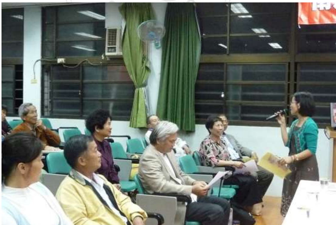
彰化市公所李專員（資深學員）熱情的心得分享（2013/3/29）