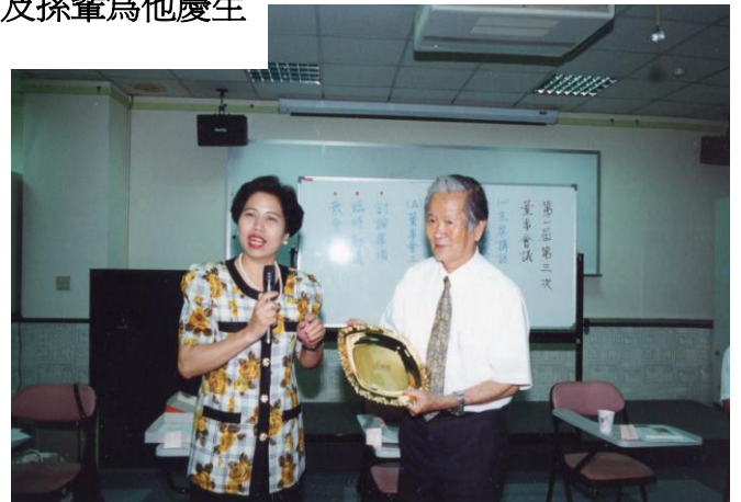
八、研究者獲頒為「彰化地區幸福家庭教室」 負責人