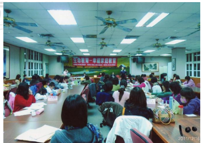
十三、2011年12月16日於彰興國中「生命教育—幸福家庭教室」學員們上課狀況