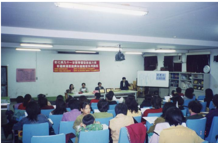
十、2002年12月11日彰化縣九十一年度學型家庭幸福美滿家庭員林進階班結業式學員心得分享