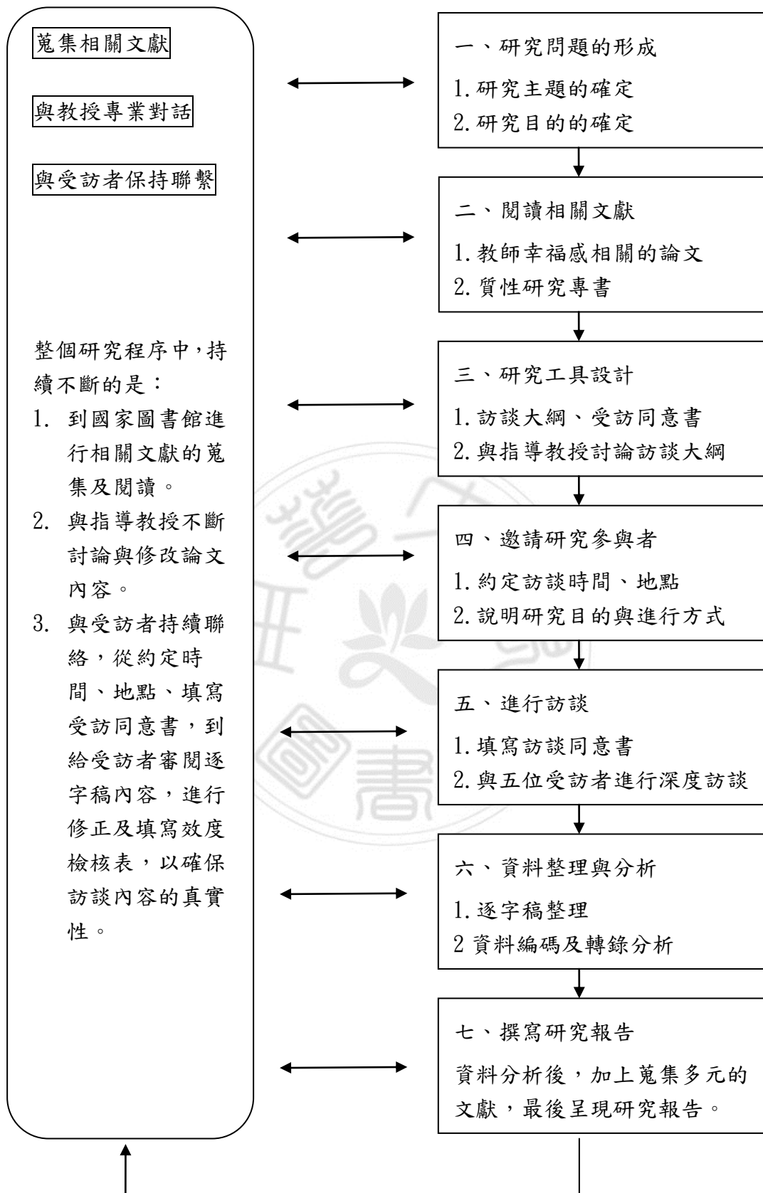
圖3-2 研究流程圖(參考張書豪，2012)