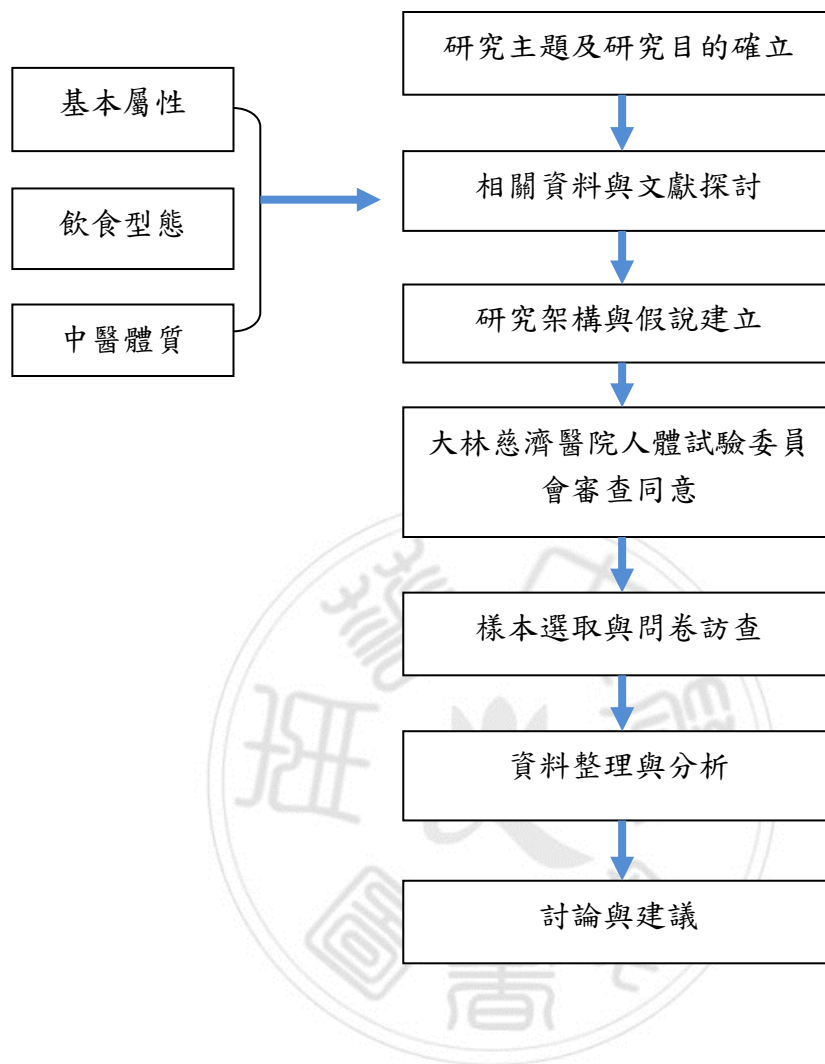
圖 3.2 研究流程