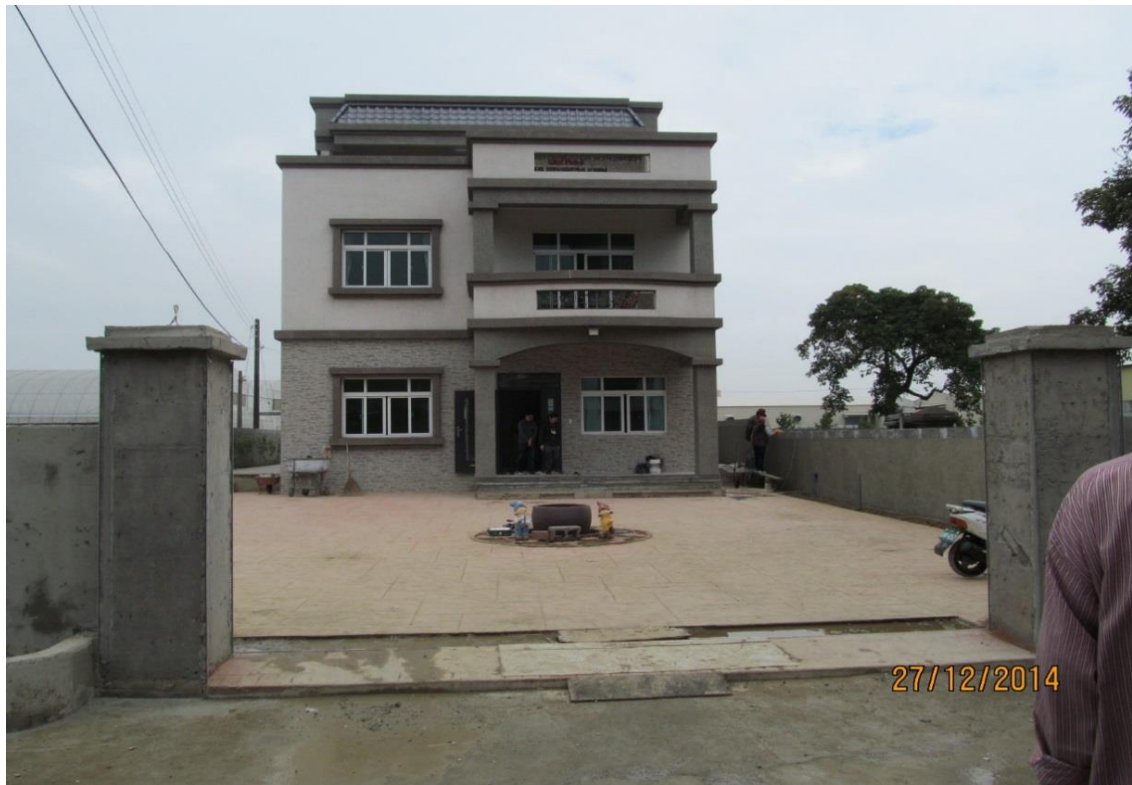
圖 5.4.3 新居入厝