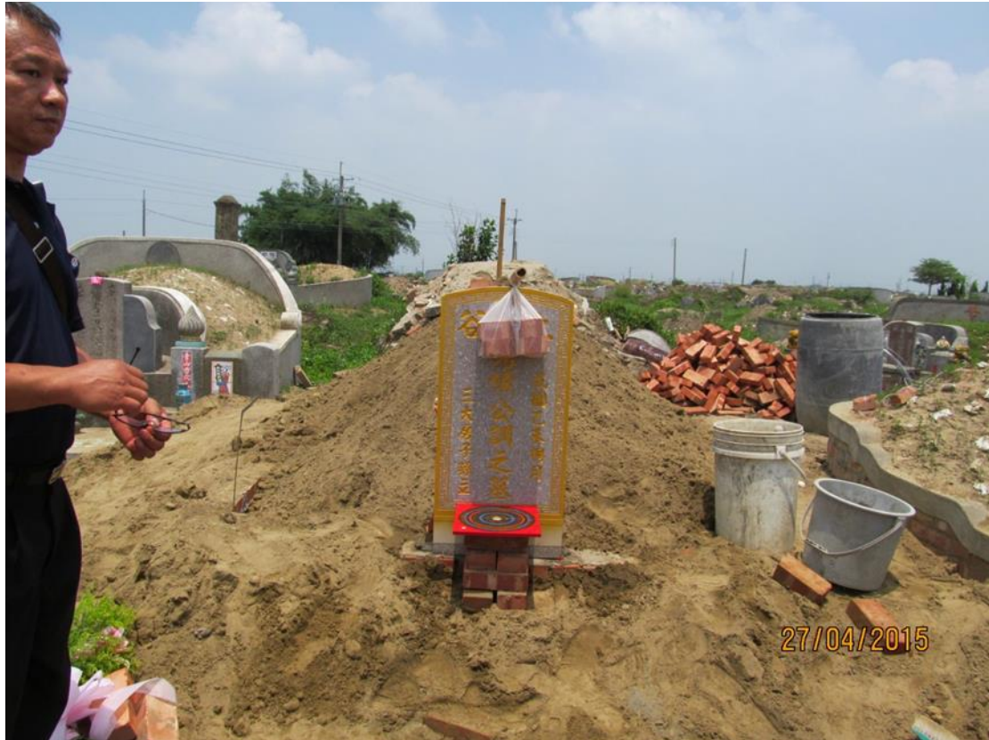
圖 5-3-5 吉時下葬覆土後立碑