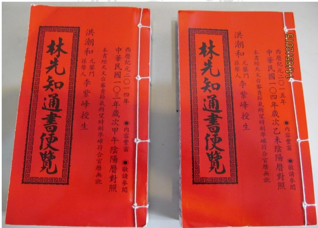
圖 3.4.1 林先知通書

資訊爆炸時代，網路資訊已有取代紙本市場的趨勢。在我們隨身攜帶的手機系統裡，只要上 PLAY 商店下載就可以搞定，不僅可以查《黃曆》找尋吉日，還具電子羅盤、八宅明鏡、八字論命等……功能。隨時隨地為自己或他人做最快速的風水堪輿或八字論命簡易解析。讓我們隨時隨地都能掌握先機以求勝券在握。(網路資訊僅供參考切記)