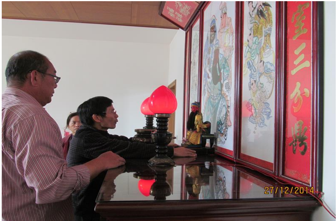
圖 5.4.1 吉時安神位