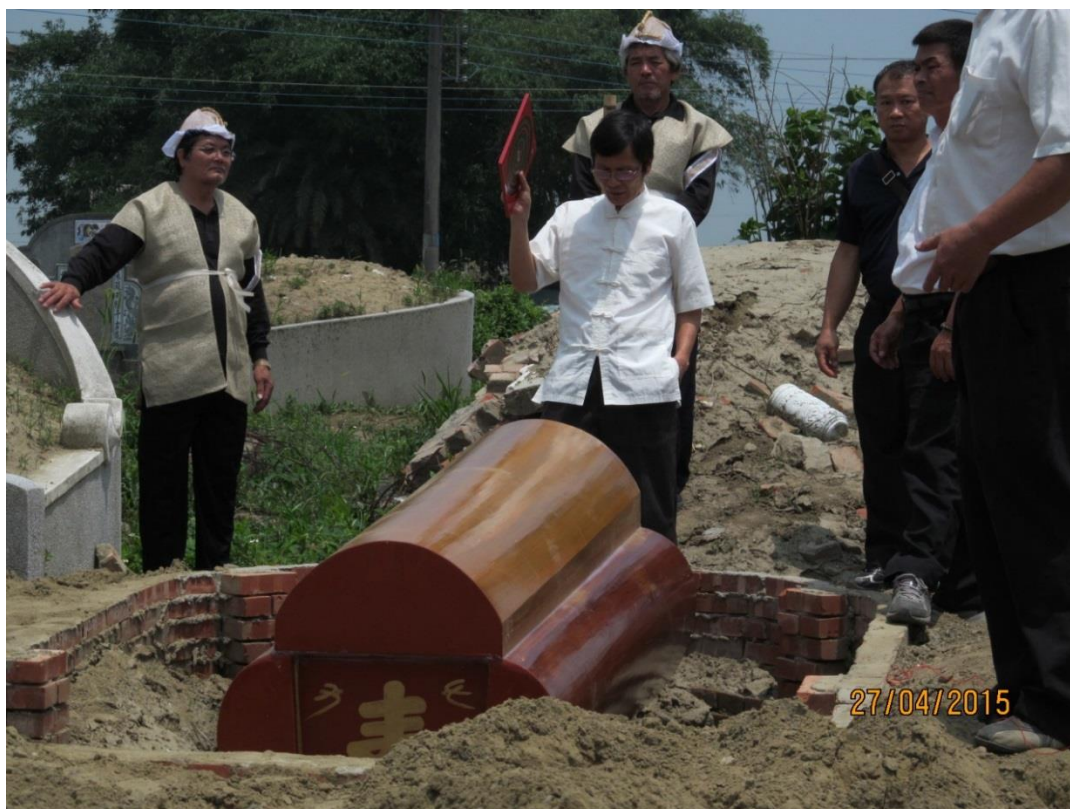
圖 5-3-3 吉時下葬覆土呼龍