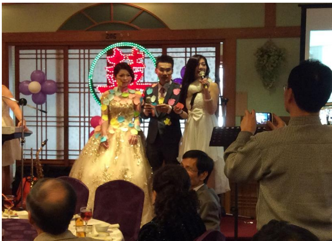
圖 5.2.1 結婚宴客