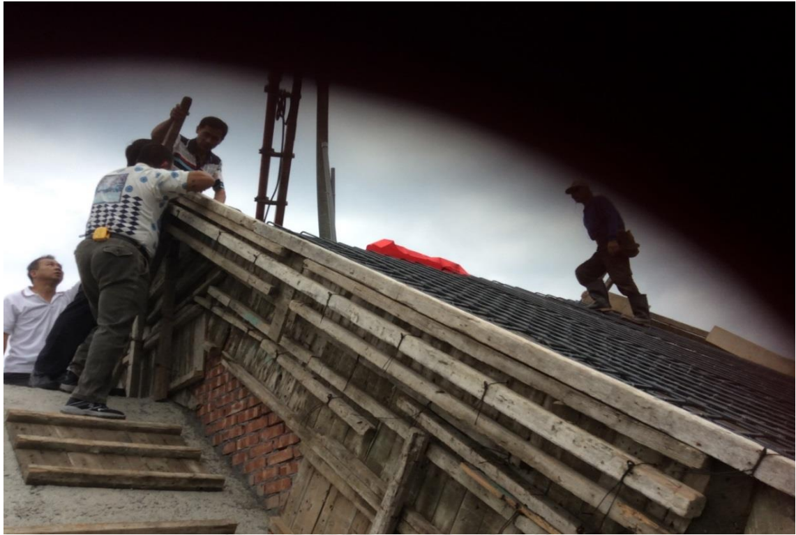
圖 5.4.5 新建廟宇上樑 2