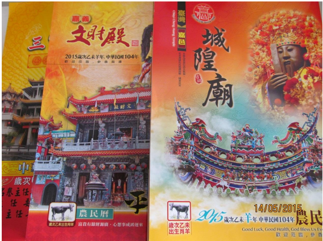
圖 3.3.1 農民曆

台灣地區每年發行的《黃曆》至少二十多種，由專業人士編輯，內容嚴謹，如《林先知通書》、《廖淵用通書》、《呂逢源通書》、《游華芳通書》、《蔡炳圳通書》等，為擇日專業人士或宮廟人員、勘輿師、擇日師等。有非專業人士所編輯，大都是抄襲或複製專業書籍，一般用作廣告用之增品，如銀行、農會、寺廟、縣市政府、鄉鎮區公所、診所、餐廳、金香鋪、廣告商等等，其專業水準可就沒那麼講究了。