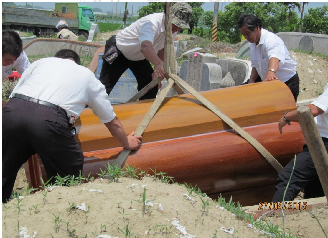
圖 5-3-2 吉時到下葬