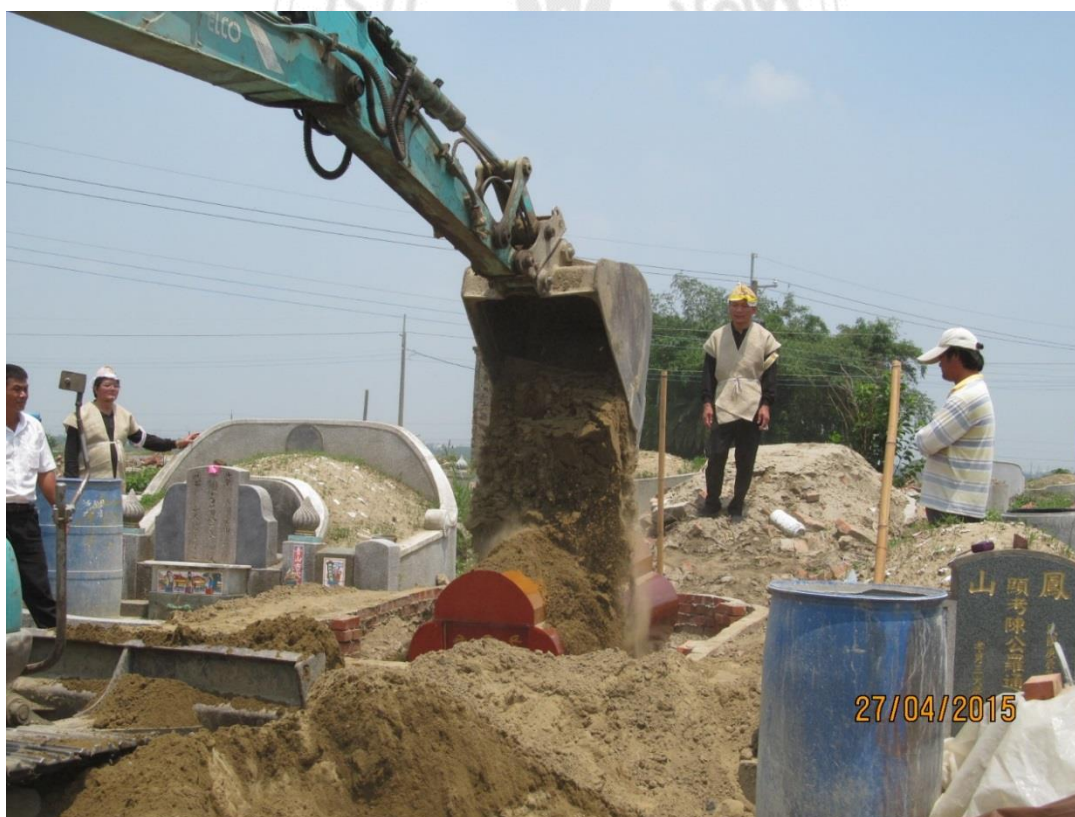
圖 5-3-4 吉時下葬覆土