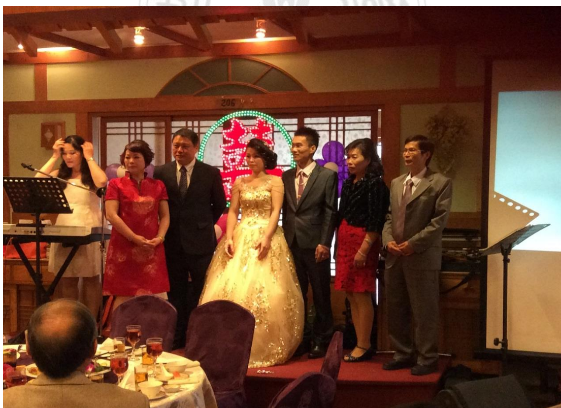
圖 5.2.2 結婚宴客