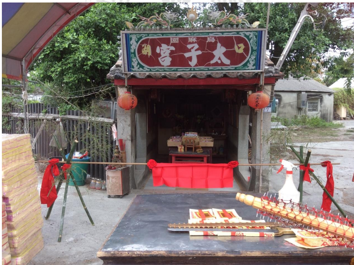
圖 5.4.4 新建廟宇上樑前先淨化