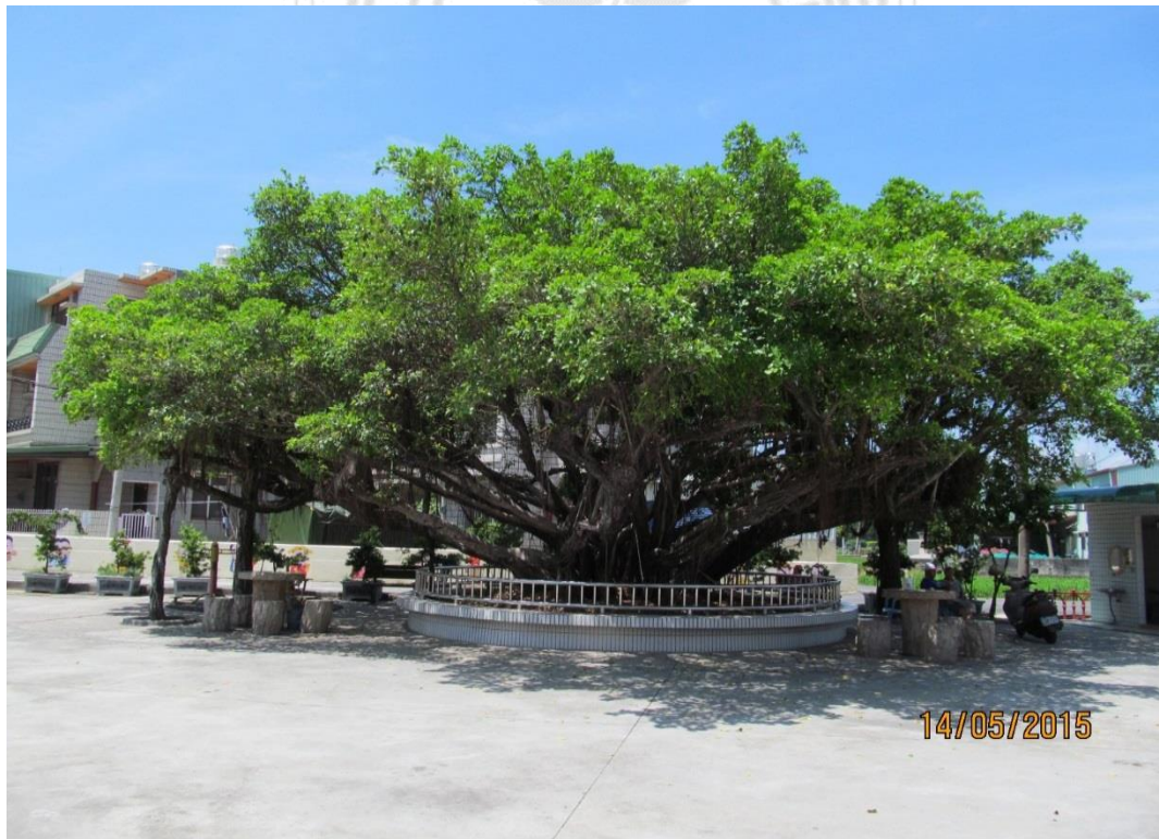
圖 4.1.1 動植物崇拜榕樹王公

關於《黃曆》和「民間信仰」兩者的關係，在蒐集資料以及研究文獻時可以發現，這兩個議題是出於同源，都是先民對大自然的崇敬及畏懼所產生祈福的方法。但是經過不同方式的轉換及呈現，變成截然不同的產物。因此，本研究的目的是希望經由了解《黃曆》的起始、發展與應用，並了解它與民間信仰相互影響的關聯。