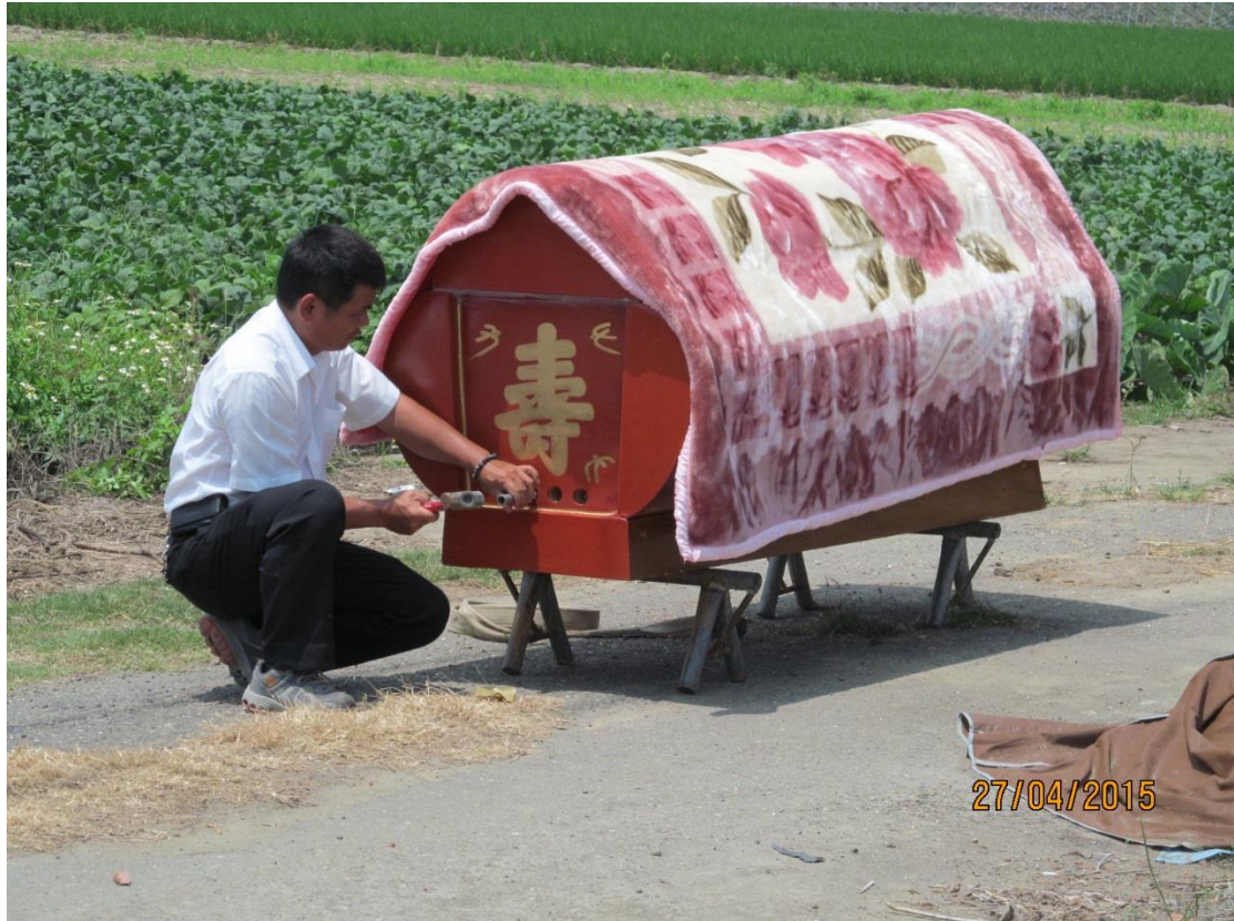
圖 5-3-1 等待吉時下葬前，先放水（氣）。