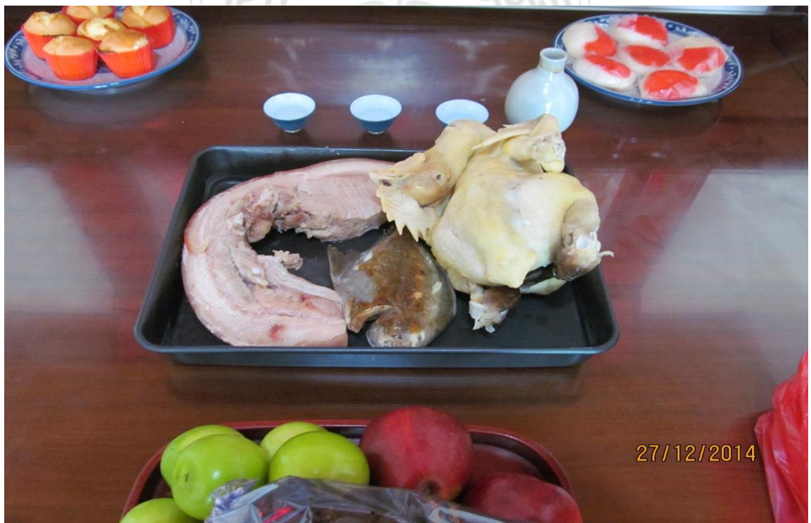
圖 5.4.2 安神位祭拜的供品三牲酒禮