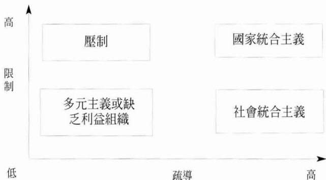
圖 1 利益組織中介的四個理念類型

綜合以上的說明，以 兩面性的觀點 來探討國家的介入與社會群體關係，顯然是較為適當的。本文採取 Collier and Collier (1979) 的分析架構，將國家的控制與預防性介入視為 限制 (constraint)，國家的承認與協助視為 疏導 (inducement)。在此，從限制與疏導高低程度的交叉分類，可以得到四種利益組織中介的理念類型 (見圖 1)：壓制 (高限制與低疏導)、國家統合主義 (高限制與高疏導)、社會統合主義 (低限制與高疏導)、多元主義或缺乏利益組織 (低限制與低疏導)。從圖 1 可知，國家統合主義到社會統合主義的演進，並不是單純由於國家介入程度的減弱，而是由於國家介入方式的改變，仍是維持高度的疏導，但是