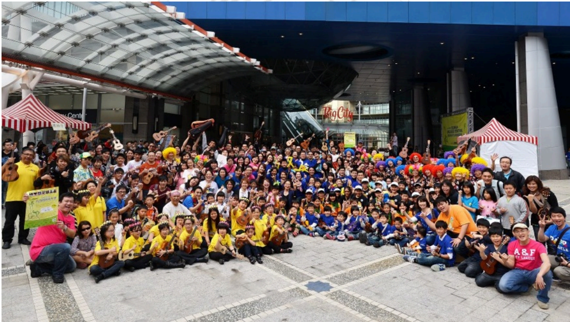
圖37：2013年新竹第五屆烏克麗麗千人嘉年華

2013年3月24日，第五屆烏克麗麗千人嘉年華，現場展演團體有四十隊，邀請全台各地及國外知名人物七人，及一組夏威夷舞蹈團，自下午一點進行至晚上八點，期間安排兩次大合照，於最後以大合唱結束活動，期間有五次摸彩贈琴，現場並設有樂器展示與教學攤位。參與展演團體，族群年齡層涵蓋幼兒至銀髮族，全以團體演出，彈唱中文流行歌曲最為普遍。觀眾席未安排座位，人潮流動，觀眾為表演團體及其家屬，表演時家屬多在拍照、攝影，團體表演後，稍作停留後，前至購物中心或離開。流程中穿插國內外烏克麗麗演奏家高技巧及不同曲風的展演，讓觀眾感受到此樂器能表現的可能性不僅是彈唱和娛樂功能。政治人物至現場致詞，樂器製造商贊助活動並親臨現場，表示相當支持舉辦活動，亦可全數贊助，但也得考慮其它品牌的生存。 143 不論是各家樂器廠商或相同地緣推廣者彼此間存在良性競爭與合作的關係，相互競爭消費市場又合作共構流行性市場成果。