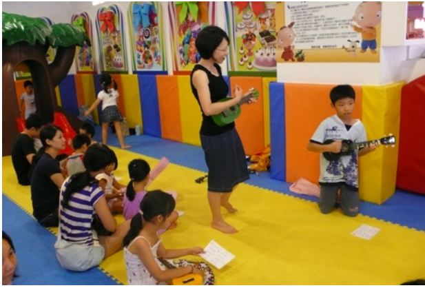
圖26：耐斯百貨公司兒童遊戲區