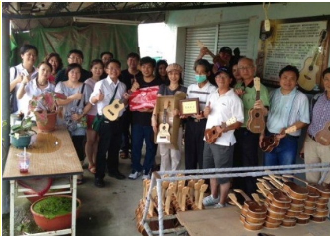
上圖18：水林烏克麗麗工廠接待機關參訪