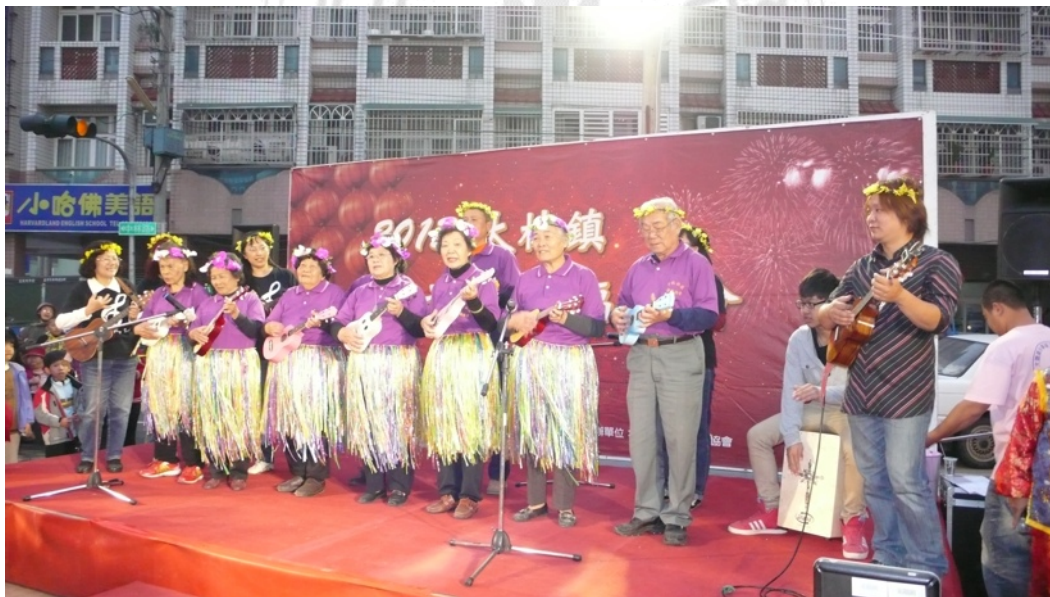
圖16：「千歲團」參與2013年嘉義縣大林鎮元宵幸福點燈 （筆者攝，2013年2月24日）

雲林縣水林鄉的「不識字樂團」，亦是由家鄉社區銀髮族成員組成的烏克麗麗的社團，並參與家鄉的各活動演出。這些高齡學習者參與社團，主要目的並非學習樂器，為打發時間、與人互動或其它誘因而參與。高齡的學習者於展演舞台上唱唱歌，手持樂器僅多為裝飾功能，推廣者安排教師裝拾音器擴音，觀眾不會在意展演者的歌唱技巧，或對使用樂器的技巧有所評論，只會覺得很有趣。推廣者透過結合家鄉節慶活動的舞台，讓計畫案學習者成果發表展演才藝，使更多的鄉民認識此樂器，承辦單位也有施政成效成果，展演者經活動參與使生活更豐富。經活動的展演，團體的高齡特色成為媒體報導的話題，透過媒體將烏克麗麗的魅力傳播開來，而從活動的鋪陳到展演無形中也凝聚了家鄉居民的情感。嘉義博愛社區大學大林分校於南華館開立烏克麗麗成人初級班課程，該單位員工暨學員表示，課程以簡章訊息公告予社區民眾，學期末安排成果發表與單位舉辦的活動結合，成為社區的施作成效。 110