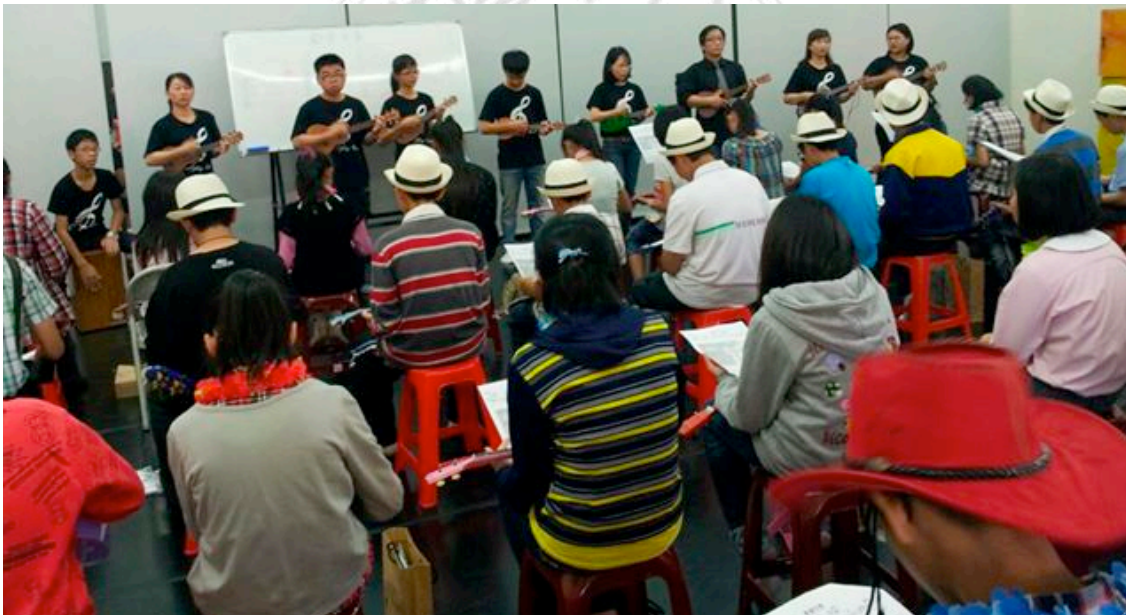
圖14：民國101年全嘉義縣模範學生表揚大會，會前教學。

以筆者參加於嘉義縣民雄演藝廳「民國101年全嘉義縣模範學生表揚大會」為例，當天與會者有嘉義縣各學校教師、模範生、學生和家長等為數眾多。所有的學生可自由選擇一項目加入演出，有戲劇、合唱、舞蹈等，學習三十分鐘後上台演出，因各項人數限制60名，烏克蘭麗是第一也是唯一爆滿的，可見烏克蘭麗之魅力。展演前三十分鐘的學習時間，由推廣者及多名教師示範持琴方式，簡單介紹C、Am、F、G7和弦後教唱〈歡樂年華〉歌曲，其他時間用於排隊形，出場演出當時由一位裝有拾音器的吉他暨烏克蘭麗教師及一位持麥克風唱歌的老師，和多名教師協助帶領六十位學生上台齊唱齊奏。如此的展演方式，學習者壓力並不會很大，烏克蘭麗聲響小，彈錯毫無影響，戴上草帽、花圈高歌傳遞烏克蘭麗令人愉快的形象。當日縣長於活動現場，受邀上台一同拿著樂器歡唱。