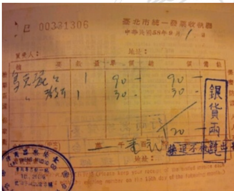
圖6：民國58年烏克麗麗樂器、樂譜書籍售價

過去在台灣生產吉他的樂器工廠，1992年遷移中國現已為全球知名樂器製造代理工廠的U樂器負責人表示，當時台灣外銷市場達高峰，但此樂器大都是外銷夏威夷，在台灣多數人不認識此樂器，或認為它是專門演奏夏威夷歌曲的概念，故此樂器在台鮮少有人懂得如何使用，大多當成玩具或擺放櫥櫃的擺飾品。 10 K品牌台灣烏克麗麗代理商表示，民國60幾年時樂器工廠在台灣就已經幫品牌代工生產烏克麗麗，因為親戚關係而贈與當擺飾，當時台灣沒有人玩所以並不流行。 11 民國五十八年烏克麗麗一支售價台幣九十元，樂譜一本三十元，以當時的物價或與其它樂器相較烏克麗麗的價位算是便宜，當時樂譜是日文書籍封面即有標明自學。