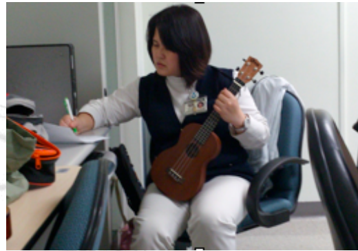
圖29：醫院社團

經教育單位推廣，如至校園或有開立學習課程的單位推廣則是較直接、有成效的。陳建廷表示，在2012年的七月和八月，兩個月間行程幾乎都排滿，北中南三場大型學校音樂老師有超過百人的師資研習。 126 除了教室廣開課程外，台北13所社區大學，2012年3月，除原住民部落大學外，其它12所社大均有開課，數量暴增。 127 全省中小學、高中，許多學校將其納入社團活動，如台灣、交通、輔仁、清華、長庚醫學大學、新竹教育大學、開南技術學院等。大專院校進修推廣部，如國立師範大學烏克麗麗師資培訓班、國立臺北科技大學推廣教育中心、國立師範大學進修推廣部烏克麗麗師資班、實踐大學音樂系烏克麗麗學分班等。