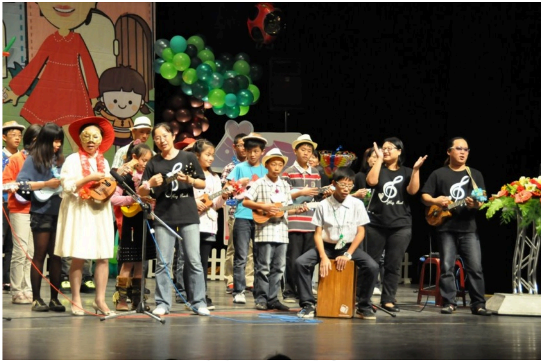
圖15：民國101年全嘉義縣模範學生表揚大會。戴紅帽與面具者為嘉義縣長張花冠（前排左一），戴墨鏡者為裝拾音器的老師（右）。

烏克麗麗的推廣企圖與任何活動結合，如筆者曾參與和C弦樂團的合作展演，弦樂團的動機為結合當今流行樂器創造另一種可能性，也藉由大批烏克麗麗的展演者和其帶來的家屬參與爆滿觀眾席，締造座無虛席佳績。烏克麗麗推廣者將經常於開放性空間展演的樂器帶入較嚴肅的室內演藝廳，企圖提高其精緻藝術的價值。對照會場上弦樂團體與烏克麗麗演出者形象，舉凡髮型、服裝、對待樂器的態度與指揮對烏克麗麗團體的態度都可見其差異。當日弦樂團的小朋友盛裝打扮，身著禮服與飾品、皮鞋，講究的髮型，對樂器小心翼翼的保管；烏克麗麗的小朋友著學校制服與平日球鞋，無刻意的打扮表現出日常生活的樣貌。因烏克麗麗展演者為聯合多所學校社團參與，演出前擔心小朋友帶樂器進入演藝廳會影響弦樂團彩排，故將所有的烏克麗麗樂器集合以大型垃圾袋收納，寄放於服務台。弦樂團彩排時老師將烏克麗麗的小朋友帶領至演出時要分佈於觀眾席的各走道位置，影響正在彩排的弦樂團而引起指揮不悅，令他們立刻離開展演廳。當日有烏克麗麗教師上台重奏的節目，並於節目最後安排由各學校社團小朋友搭配弦樂團合奏，聲樂家唱〈高山