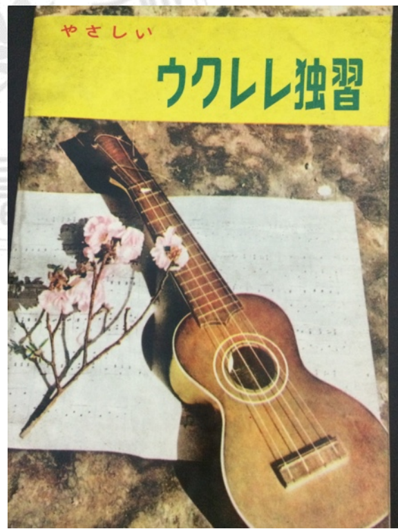
圖9：《ウクレレ独習》（筆者自藏）