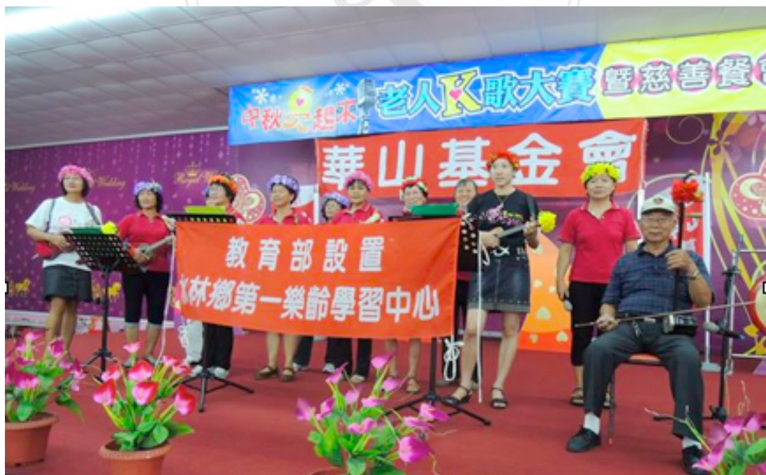
圖32：第一樂齡學習中心計畫案施作成果發表