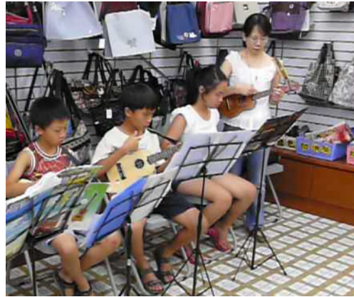
圖27：雲林縣西螺鄉金玉堂書局