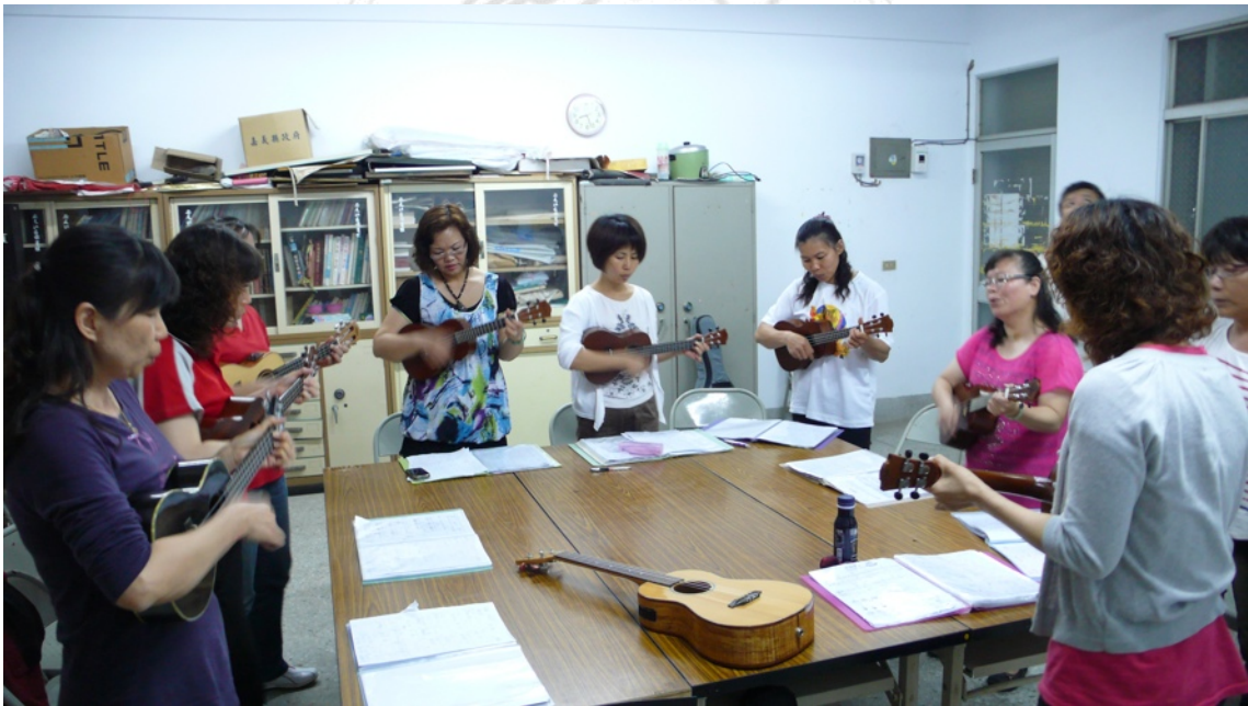
圖30：嘉義縣溪口鄉美林社區社團

至各基金會承接課程，如漢慈公益基金會、梅山文教基金會等，及宗教團體推廣成立社團，如基督長老教會的成長學苑、慈濟志工團體。成立社區才藝班，社區表演活動經常由附近學校或社區民眾組織的團體提供節目，烏克麗麗因此也走入社區，特別受家庭主婦和單身上班族喜愛，家庭主婦可暫時抽離操持家務的瑣事，進行自己的休閒活動。單身上班族無其它興趣者，想擺脫只有工作和電視的單調人生，學習時形成一個小型團體，透過互動可以相互支持，共同參與活動演出，讓生活更豐富有意義。嘉義縣大林鎮南華館佛教道館單身女性上班族學員表示，剛好在住家附近的早餐店看到簡章，就近學習很方便，但若是還得特地到市區學習，恐怕不考慮。 128 社區媽媽班成員亦對就近學習提出看法，她認為人還是要有一項專長，過去就很想學習樂器，參與此團離家近，成員都是年紀差不多的媽媽，許多事可以互相交流、幫忙，孩子大了這裡可以找到同伴。 129