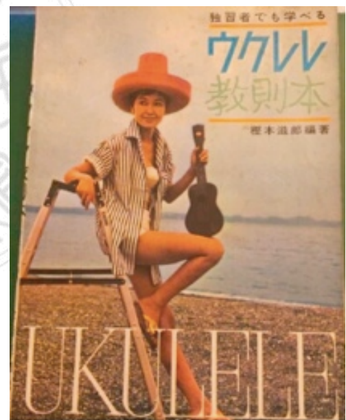
圖7：民國58年《ウクレレ》教則本