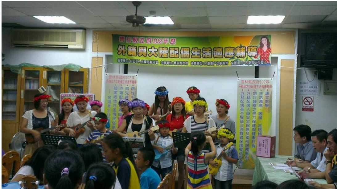
圖31：新住民生活適應輔導計畫案施作成果發表

條件和大眾對其觀感是較親民的樂器，計畫案內容的施作相較其它樂器來得易於短期內得到成效，其用於計畫案偏向娛樂性質之互動及連結的工具，而不是確切在執行學習樂器才藝。如承接「教育部水林鄉第一樂齡學習中心」計畫案，結合華山基金會於中秋節舉辦的社區慈善餐會老人K歌活動中成果發表。