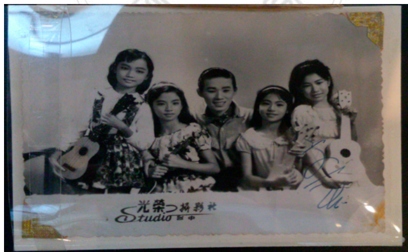
圖3：文夏四姐妹