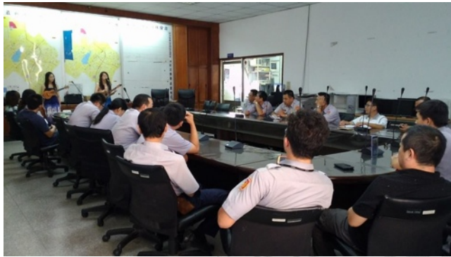
圖28：高雄市警察局推廣