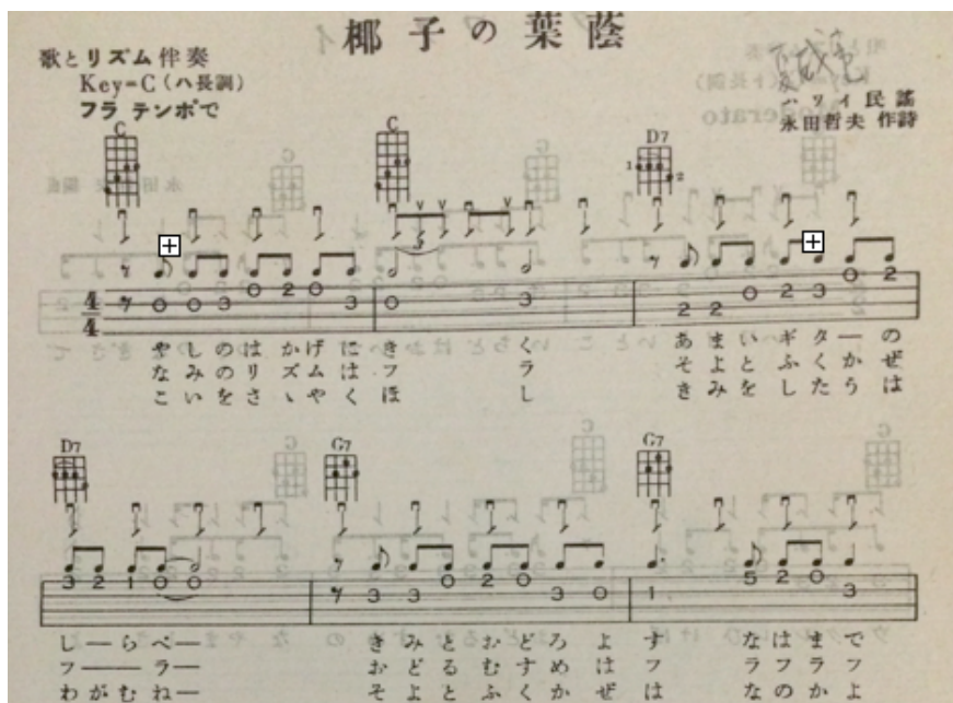
圖10：《ウクレレ獨習》譜例

U樂器製造代理工廠負責人認為，過去可以看到的烏克麗麗的樂譜絕大部份是夏威夷的曲目，即帶有夏威夷浪漫氣息的曲風，當時沒有人會拿烏克麗麗演奏流行歌。 13 故約1970至二十一世紀前烏克麗麗乃屬異國風情的民族樂器，在台灣並不普及，具文化特殊性用來演奏夏威夷曲目，民間鮮少人使用。