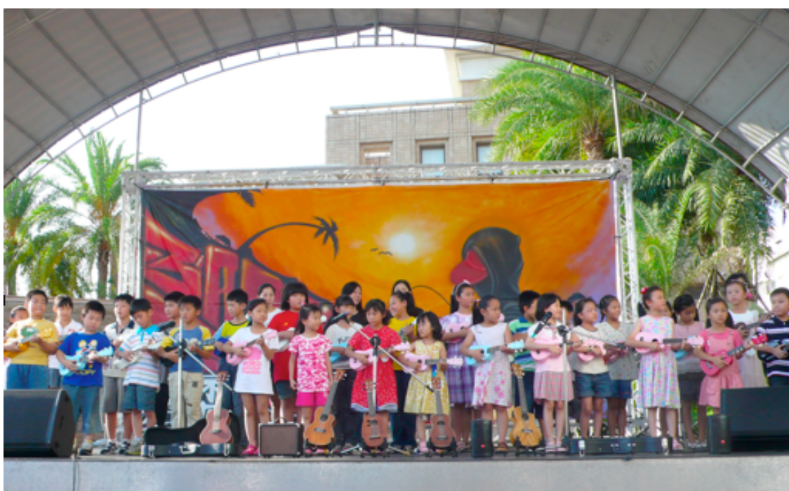
圖21：嘉義市耐斯松屋百貨廣場烏克麗麗音樂發表會（2011年6月5日）

與展演，現場觀眾來源為參與演出的成員及其家屬，顯少有專程前去觀賞展演者，雖會吸引經過的人稍作留步觀看，但不會駐足久留，因於開放性空間而引起路過的民眾注意。百貨公司免費提供舞台外尚提供音響設備、觀眾席椅子、服務區鳳凰帳等設備。筆者也曾協助推廣者於該百貨兒童館遊戲區，提供免費教學體驗活動，讓逛百貨的家長和兒童可以認識此樂器。對此百貨公司公關處表示，提供免費舞台與相關設備予表演團體是互利合作形式，可帶動人潮與提升知名度。而表演當日商場業績很難統計是否因表演團體帶動，但當日美食街業績絕對是成長的。 114