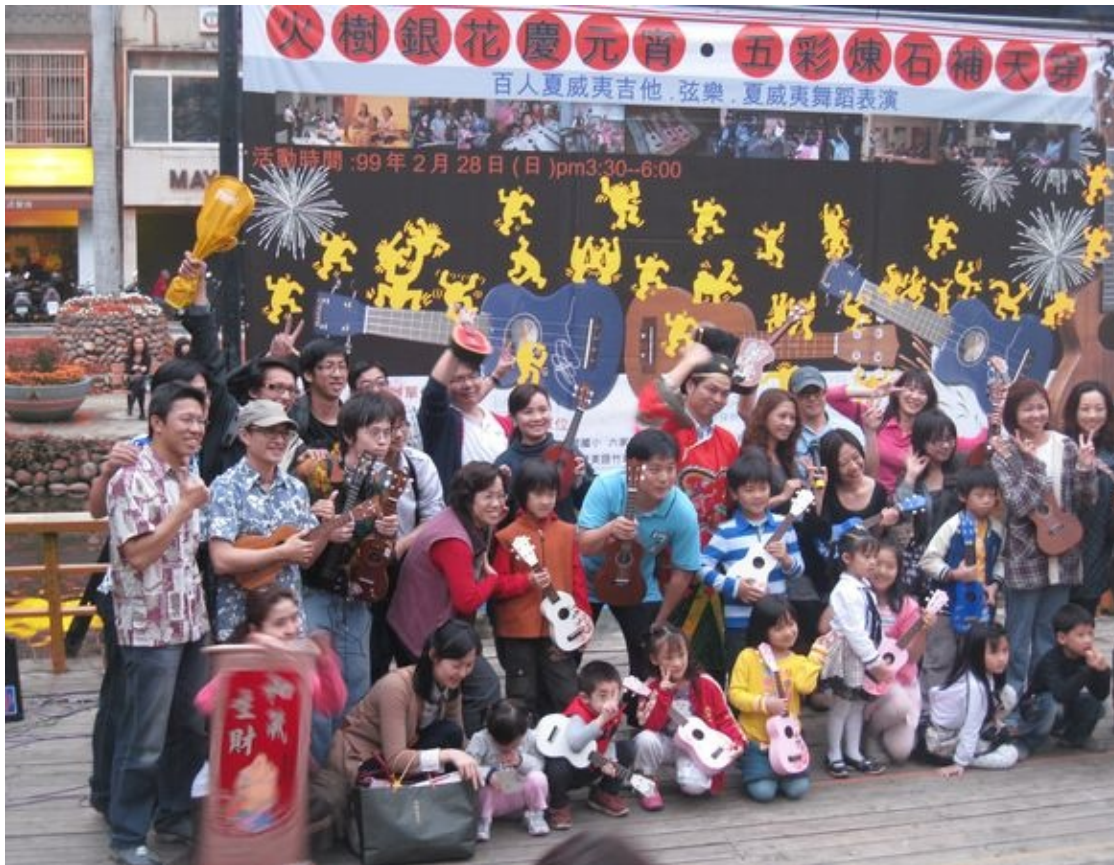
圖20：2010年2月28 新竹慶元宵夏威夷吉他街頭活動