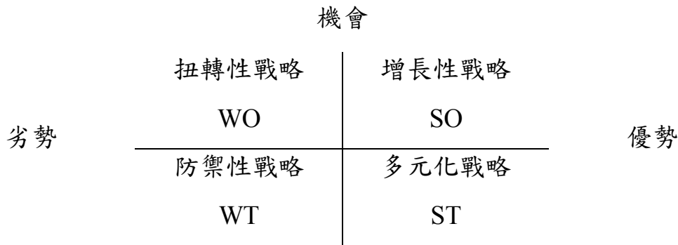
圖 4.1 SWOT 分析圖