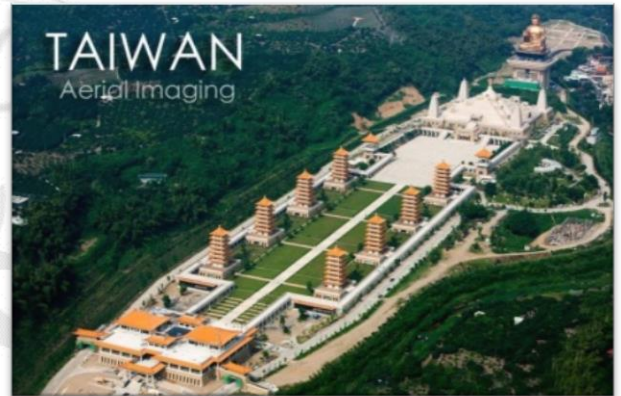
圖 10：佛陀紀念館全景圖