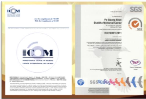
圖 13：佛陀紀念館 2014 年獲 ICOM 認證