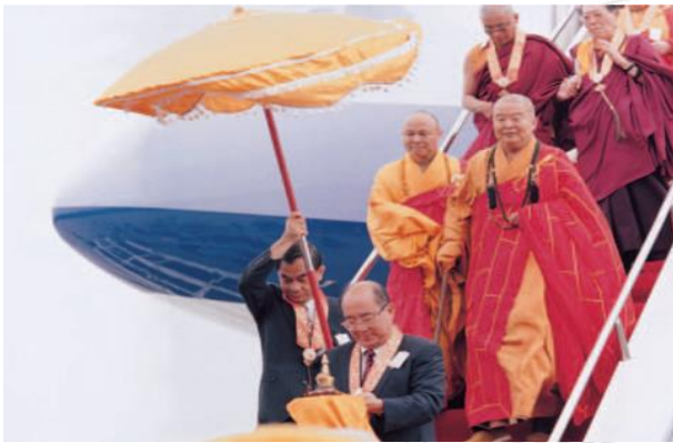
圖 9：1998 年迎接舍利