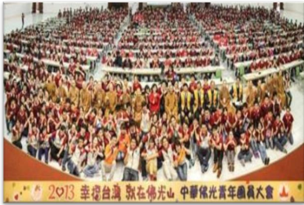
圖 7：世界佛光青年大會