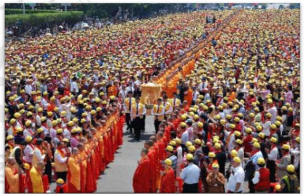
圖 4：凱達格蘭大道浴佛節