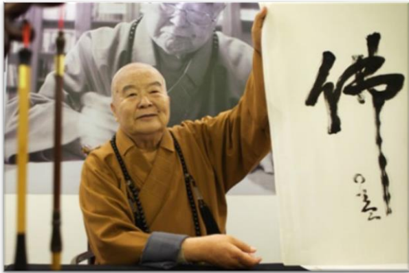
圖 1：開山宗長星雲法師