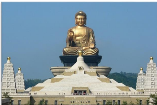
圖 11：佛陀紀念館大佛