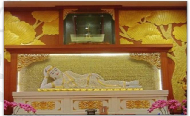
圖 16：佛陀紀念館玉佛殿