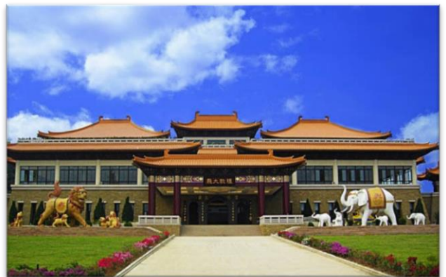
圖 12：佛陀紀念館大門