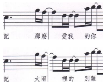
圖 5-10：切分音的態樣之二

B 的「那麼」、「愛我」、「的你」與 B' 的「大雨」、「裡的」、「別離」，都是後半拍的十六分音符，旋律有被動的成分在，由前半的切分長音帶出，但音程部分，分別以下二度、同音程及上二度構成，「麼愛」、「雨裡」下三度、「我的」、「的別」上五度，有 Release 轉 Intensity 的動力。