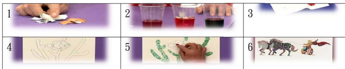
圖 4.1 蛋殼馬賽克製作圖