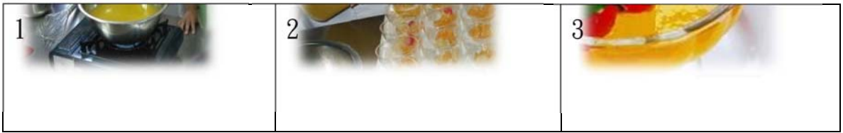
圖 4.3 鮮果凍製作圖