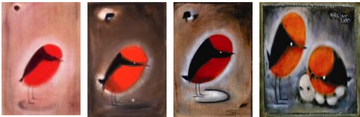
圖 9：「薄暮的呼聲」(九) 圖 10：「薄暮的呼聲」(十) 圖 11：「薄暮的呼聲」(十一) 圖 12：「薄暮的呼聲」(十二)