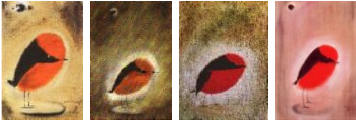
圖 5：「薄暮的呼聲」(五) 圖 6：「薄暮的呼聲」(六) 圖 7：「薄暮的呼聲」(七) 圖 8：「薄暮的呼聲」(八)