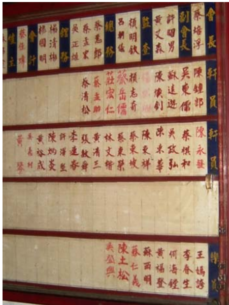
圖 2-4 集雅軒的幹部人員表

集雅軒的會長是四年一任，會長是經由每個會員所選舉出來的而參加廟會活動則是由總幹事負責召集的，其餘幹部則分作會計一名、總務三名、監察三名，都是由會員選舉而產生，由總幹事爲聘任的 3 。