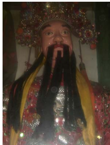
圖 2-7 西秦王爺的大仙童仔

當我查到對西秦王爺有不同的說法時，也和集雅軒的團員們討論過，他們各有各的意見，但是大多數的團員還是堅持西秦王也就是唐太宗李世民這項說法，但是不管西秦王爺是誰，集雅軒的團員們還是對於西秦王爺很尊重，對於王爺的敬重也不會減少。