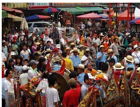
圖 2-8 集雅軒參加北港媽祖繞境

集雅軒現在主要的表演類型是以參加廟會活動為主，尤其是在北港朝天宮的媽祖繞境時，集雅軒每年不會缺席，當有其他的廟宇需要幫忙時，他們也義不容辭的去幫忙，在早期，集雅軒的表演類型是有分唱戲（包括子弟戲）與純音樂的，但是在早期集雅軒所