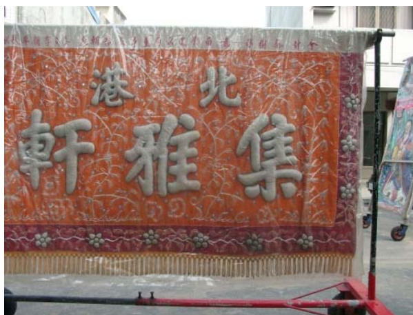
圖 1-2 集雅軒的錦旗