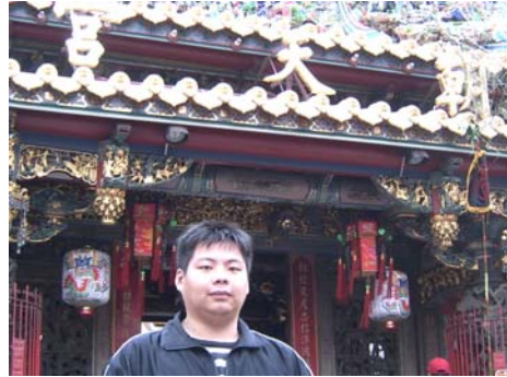
圖 4-1 筆者在北港朝天宮前