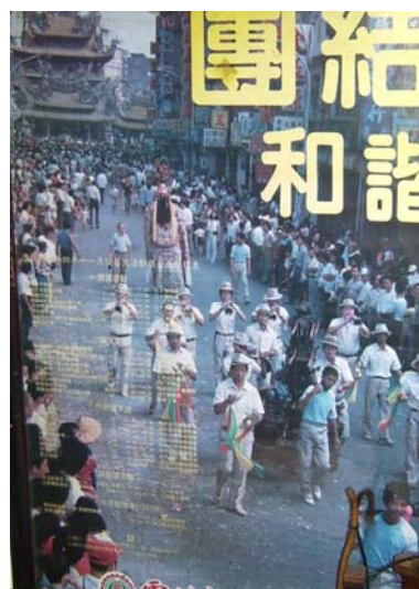
圖 2-9 集雅軒參加民國 74 年百年繞境活動

一、廟宇慶典活動：就目前來說，這個是集雅軒常常的表演類型，不管是北港地區的活動，還是來自台灣各地方要到北港朝天宮進香的廟宇，只要事前有與集雅軒聯繫過後，集雅軒負責活動的人員就會安排時間，如果縣政府有活動的話，集雅軒也會受到邀請而去表演，不過都是以音樂為主，比較沒有唱戲跟演戲，在民國七十四年雲林縣政府曾辦了一個活動，「北港百年藝陣繞境」，集雅軒也有受到邀請而演出。