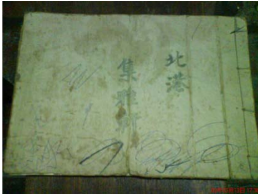
圖 3-1 集雅軒僅存的唱譜

方自己組一團，要不就是比較老的團員，想要把這些譜給留下來，所以就自行帶走了，以致於現在，在會館裡只剩下少許的唱譜而已，而曲譜則是沒有半本，這點原因讓現在集雅軒裡面的團員，非常的懊悔，如果他們有這些譜，他們可以自己練習，也不用再花錢請老師來了，這就是早期傳承方式的一個重大的缺失。