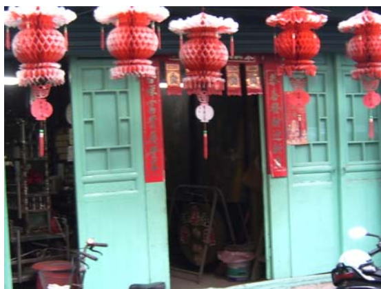
圖 4-2 集雅軒會館