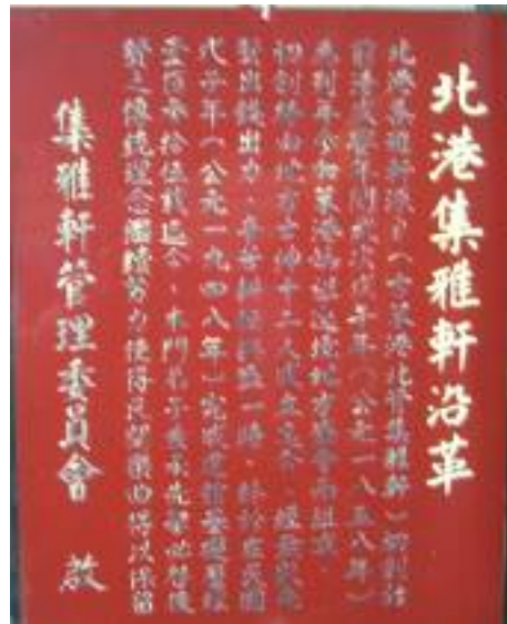
圖 2-1 館方所藏建管沿革

在館方所提供的刊版上，可以看出集雅軒是在民國前 58 年(西元 1858 年)創團的，其內容如下：「北港集雅軒源自(古笨港北管集雅軒)初創於前清咸豐年間歲次戊午年(公元一八五八年)為列年參加本港媽祖遶境地方盛會而組成，初創時由地方士紳十二人成立迄今，經無數先賢出錢出力，辛苦耕耘興盛一時，終於在民國戊子年(公元一九四八年)