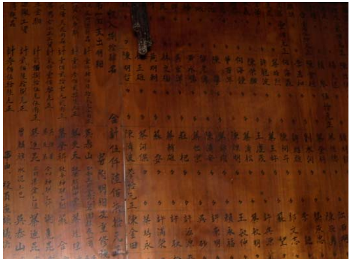
圖 2-5 集雅軒早期的支出明細