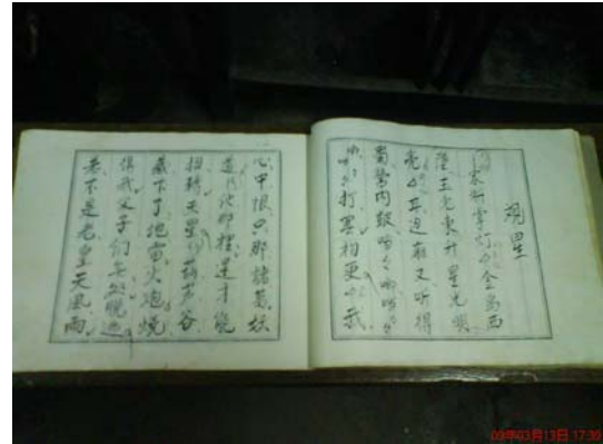
圖 3-2 「觀星」的唱詞