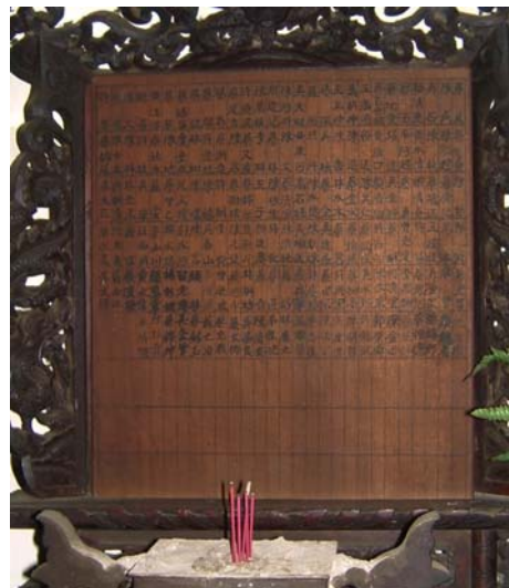
圖 2-2 創立先賢與先師神主牌位

由上述可知，集雅軒已創團至今 105 餘年，到現在算是第五代了，現在則由雲林縣縣議員蔡岳儒先生為現在的團長，剛創立時，主要是以笨港街蔡及、陳貞、吳石等共十二人發起(圖 2—2)，正式開館，早期因應地方迎神賽會之需而組織，集雅軒經由最初牌場、出陣，吸收的會員日漸增加，財源穩定後