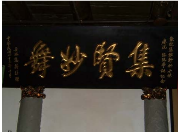
圖 2-3 於民國 46 年參加蔣公生日時所送的牌子

在早期時，集雅軒主要表演可以分爲音樂與子弟戲，最興盛期，人手可分雙陣，一陣參加遶境，一陣演戲。學戲的人多到可以出雙棚戲，雙棚演員同時在加大的戲台上演戲，且戲碼有鳳鶴樓、忠義節等大戲。一棚演員就需二、三十人，其盛況可知。民國四十六年，曾被邀請到士林參加故總統蔣公六十八歲生日盛會，是集雅軒重要的歷史紀錄。