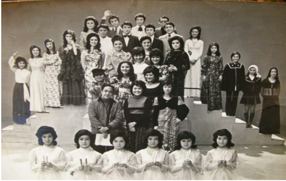
圖二十 群星會一千集劇照